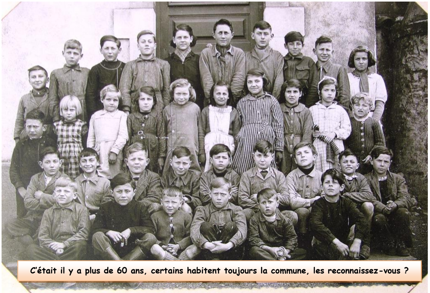
C'était il y a plus de 60 ans, certains habitent toujours la commune, les reconnaissez-vous ?