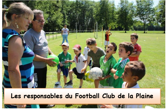
Les responsables du Football Club de la Plaine