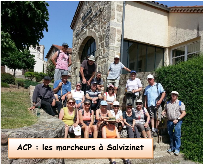
ACP : les marcheurs à Salvizinet