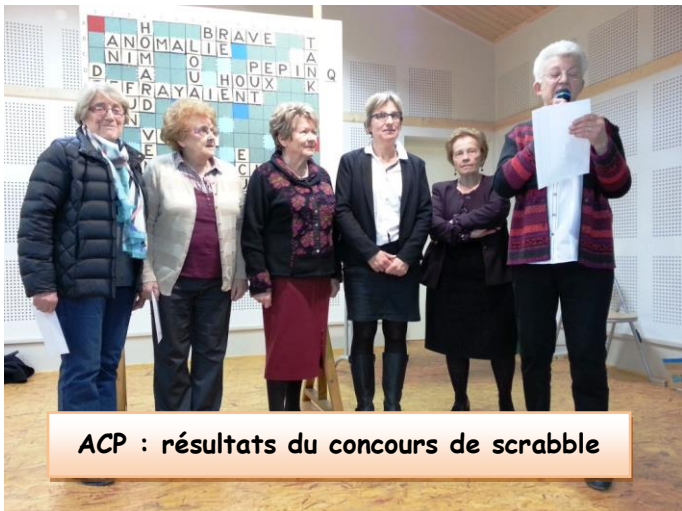
ACP : résultats du concours de scrabble