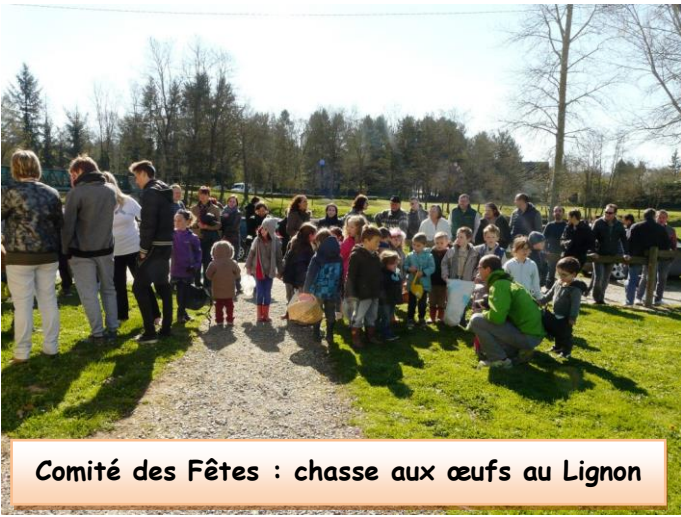
Comité des Fêtes : chasse aux œufs au Lignon