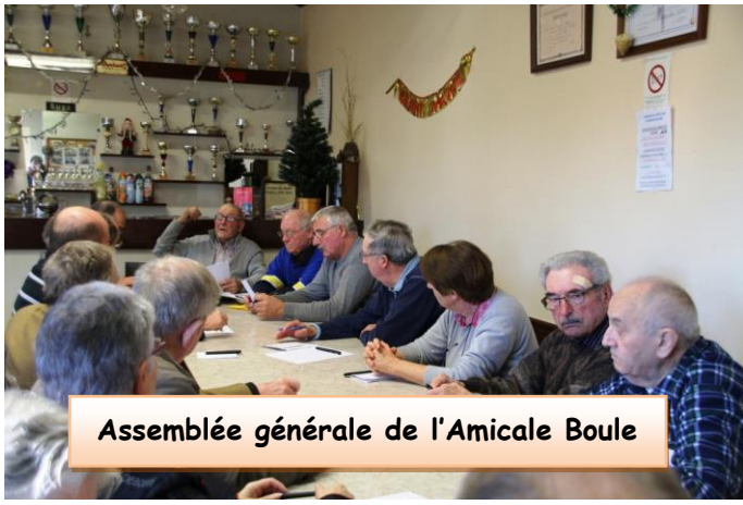
Assemblée générale de l'Amicale Boule