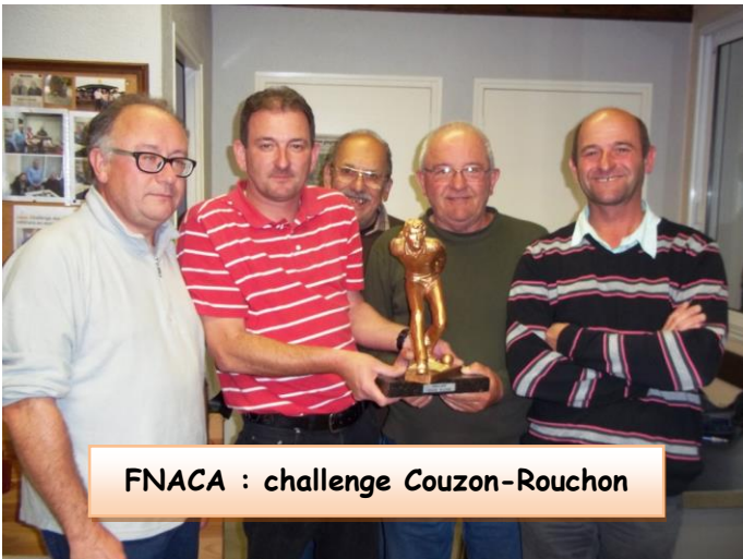
FNACA : challenge Couzon-Rouchon