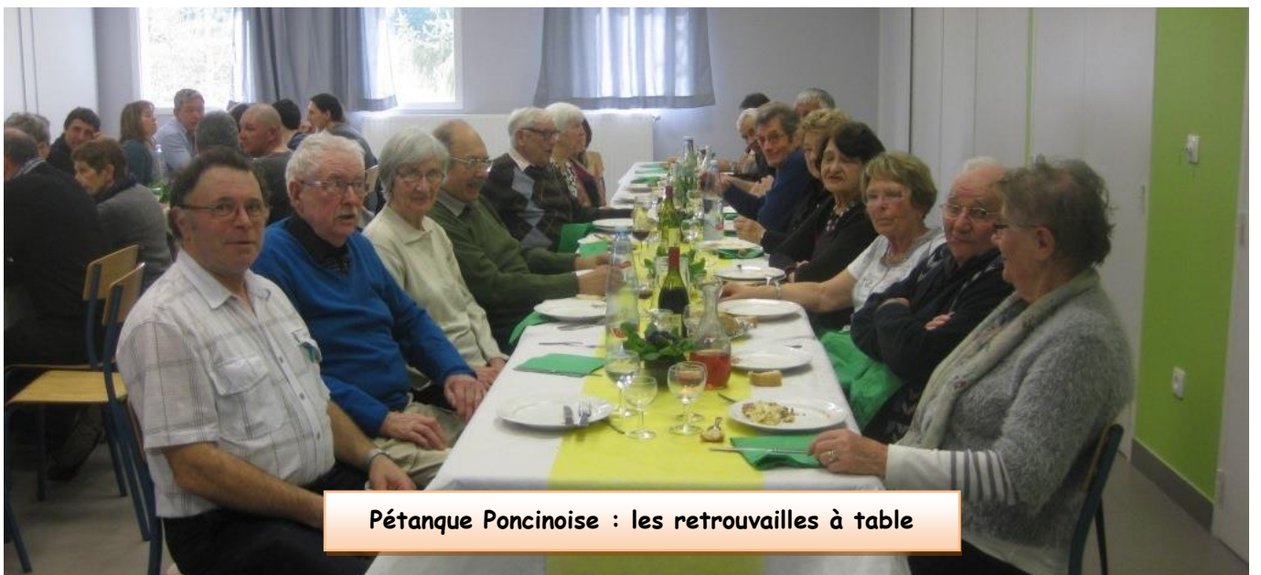
Pétanque Poncinoise : les retrouvailles à table