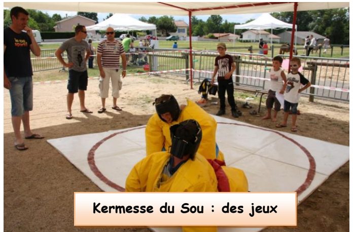
Kermesse du Sou : des jeux