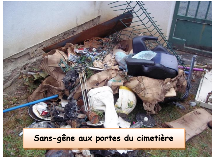
Sans-gêne aux portes du cimetière