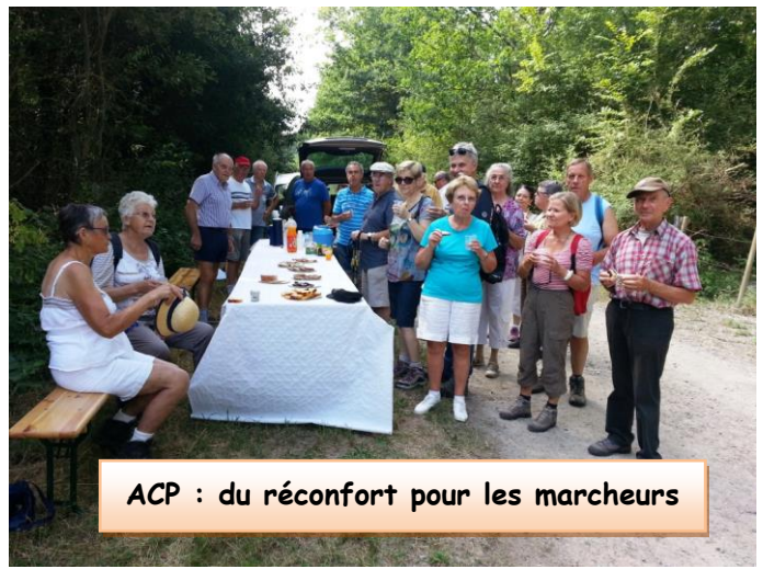
ACP : du réconfort pour les marcheurs