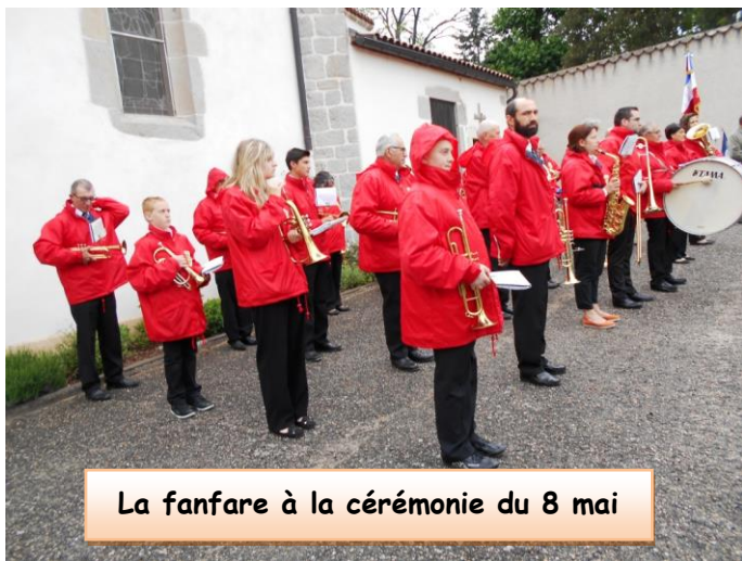
La fanfare à la cérémonie du 8 mai