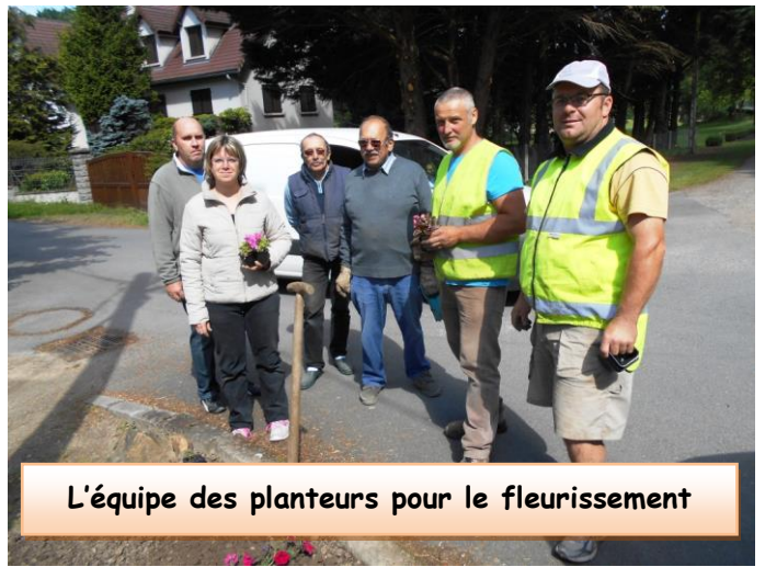
L'équipe des planteurs pour le fleurissement