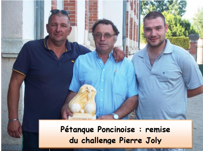
Pétanque Poncinoise : remise du challenge Pierre Joly