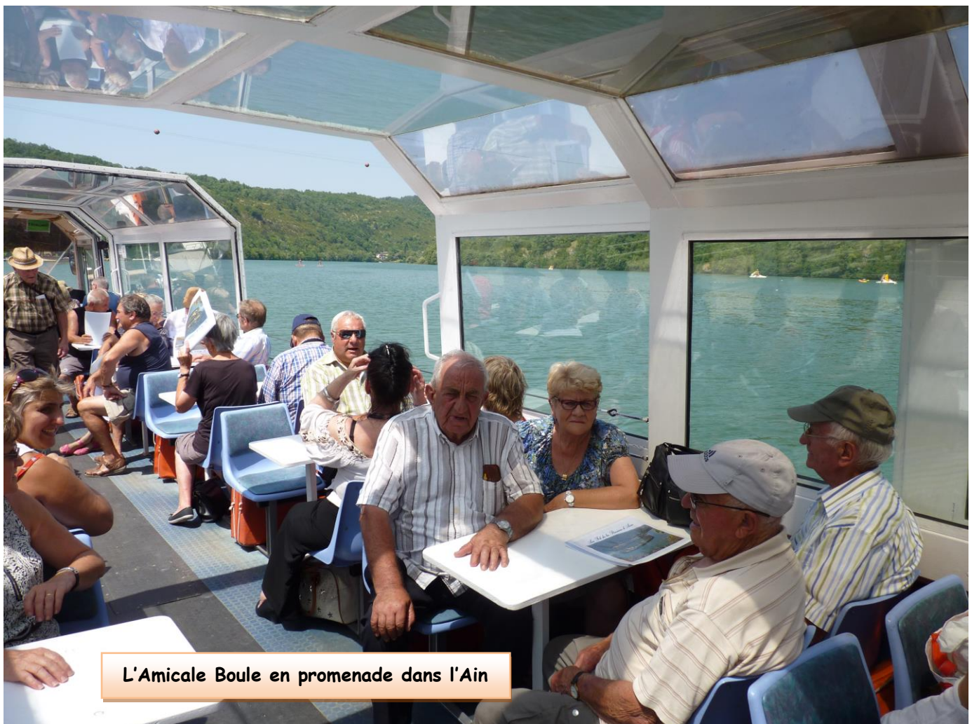
L'Amicale Boule en promenade dans l'Ain