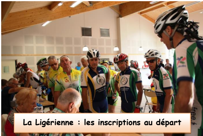
La Ligérienne : les inscriptions au départ