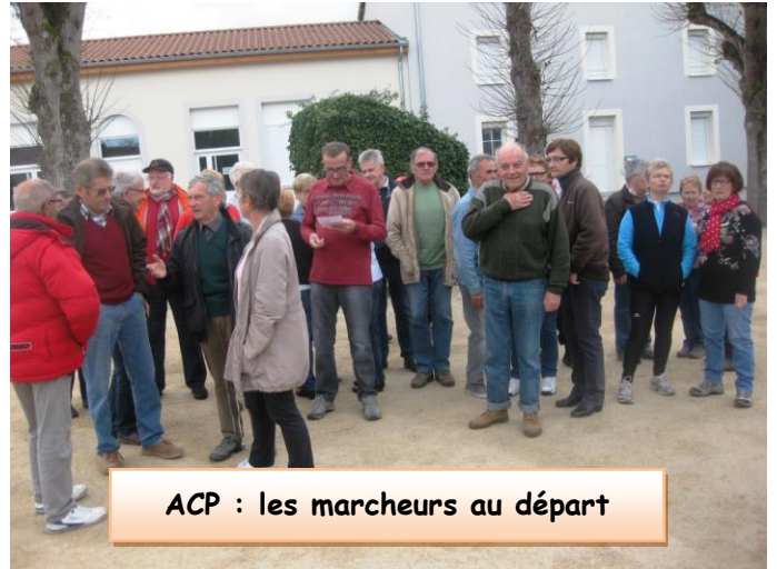
ACP : les marcheurs au départ