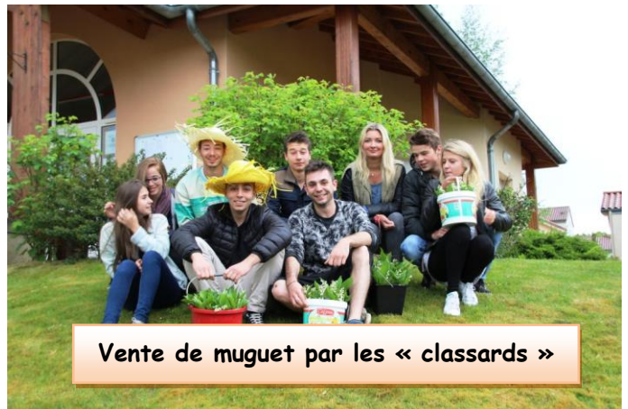
Vente de muguet par les « classards »