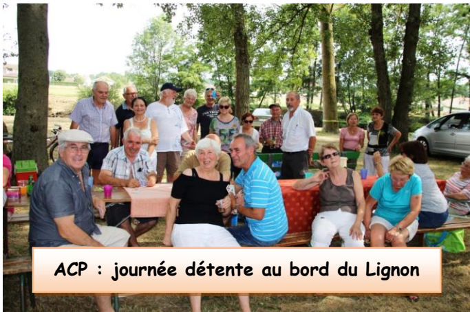
ACP : journée détente au bord du Lignon