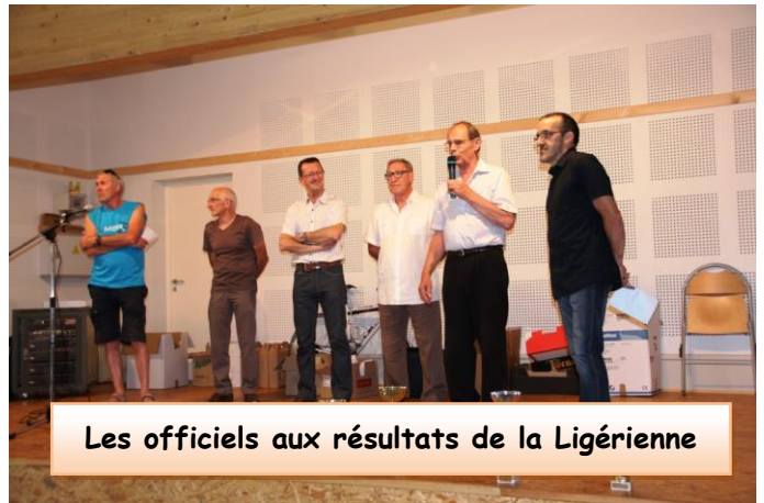
Les officiels aux résultats de la Ligérienne