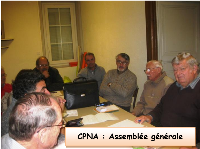
CPNA : Assemblée générale