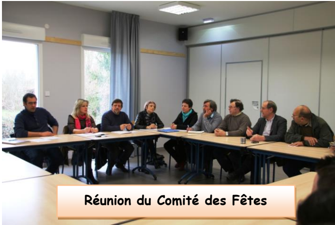
Réunion du Comité des Fêtes