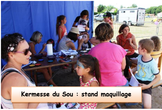
Kermesse du Sou : stand maquillage