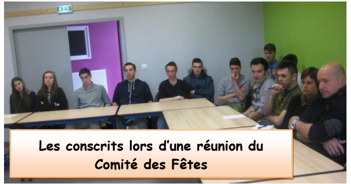
Les conscrits lors d'une réunion du Comité des Fêtes