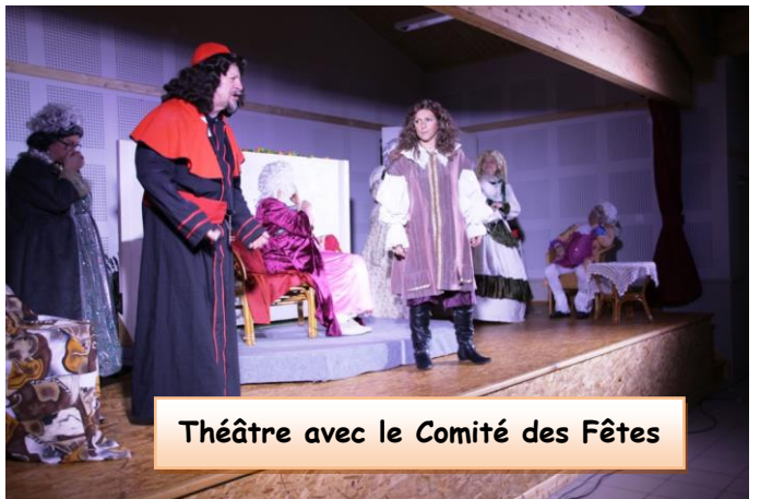
Théâtre avec le Comité des Fêtes