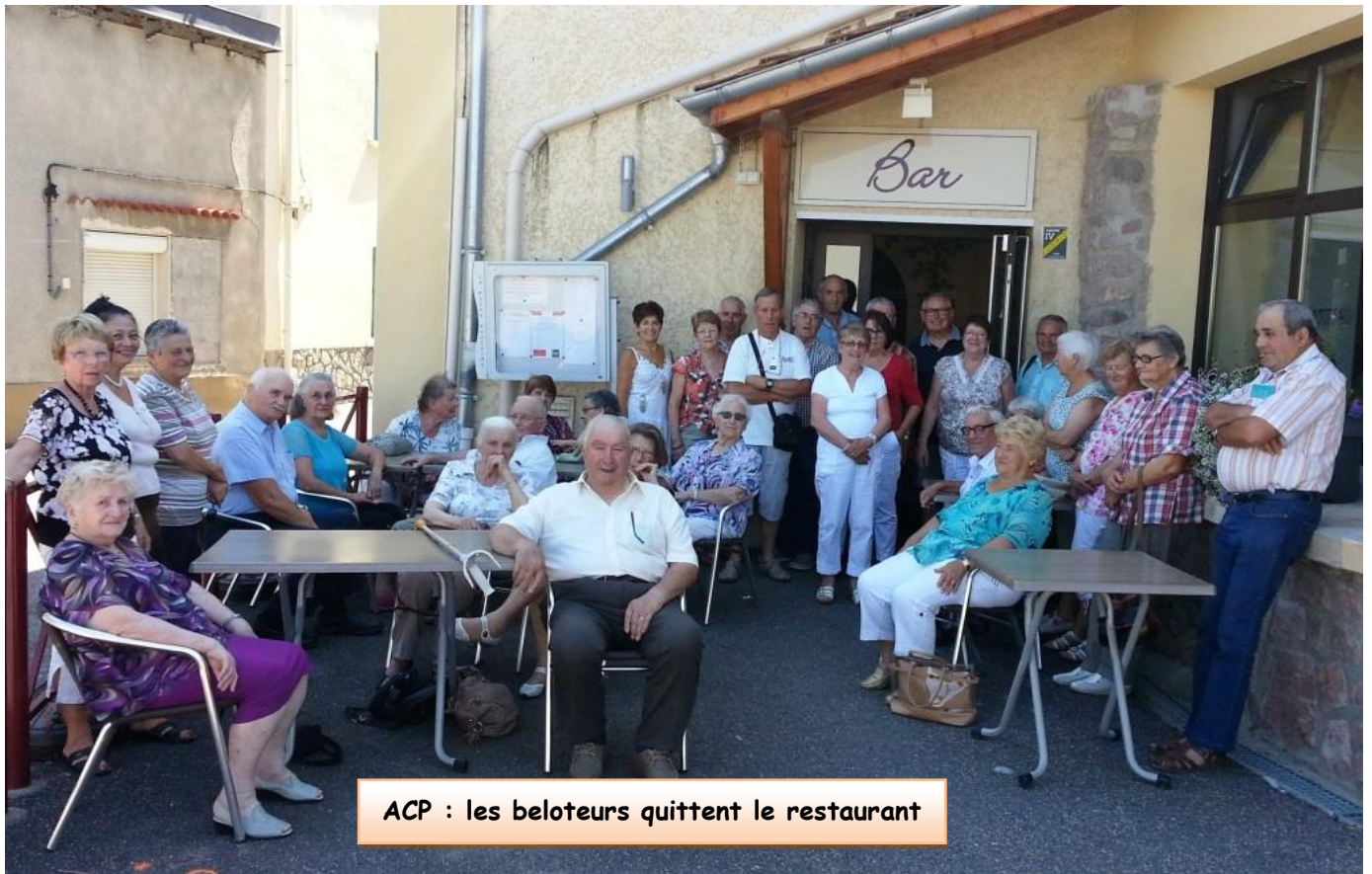
ACP : les beloteurs quittent le restaurant