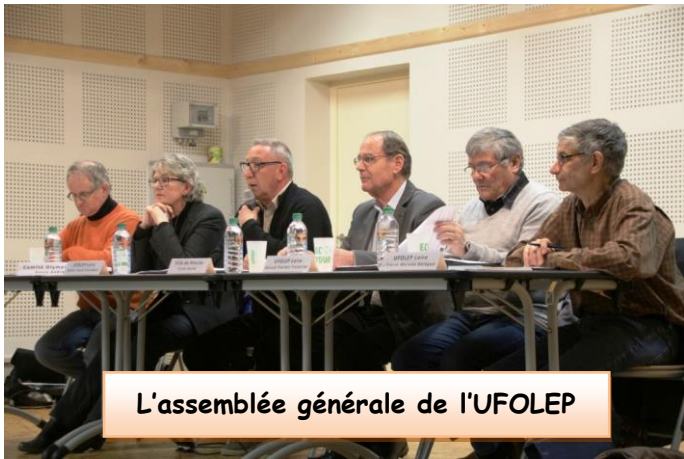
L'assemblée générale de l'UFOLEP