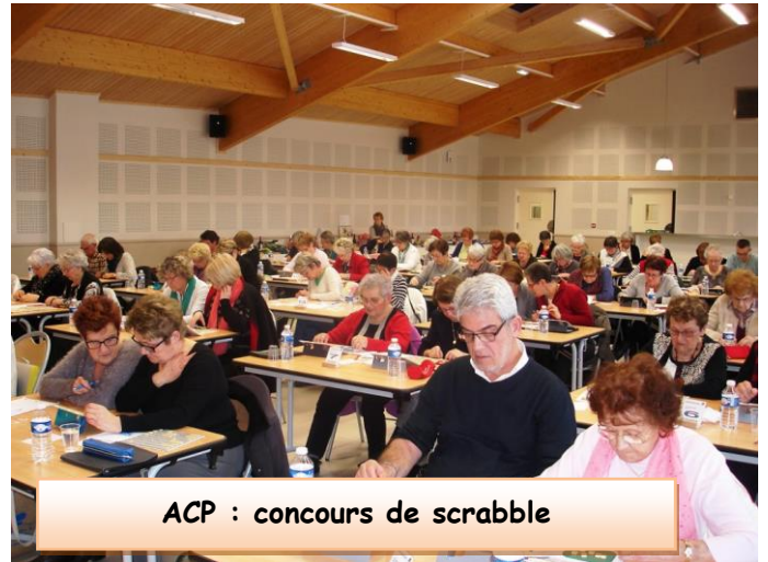
ACP : concours de scrabble