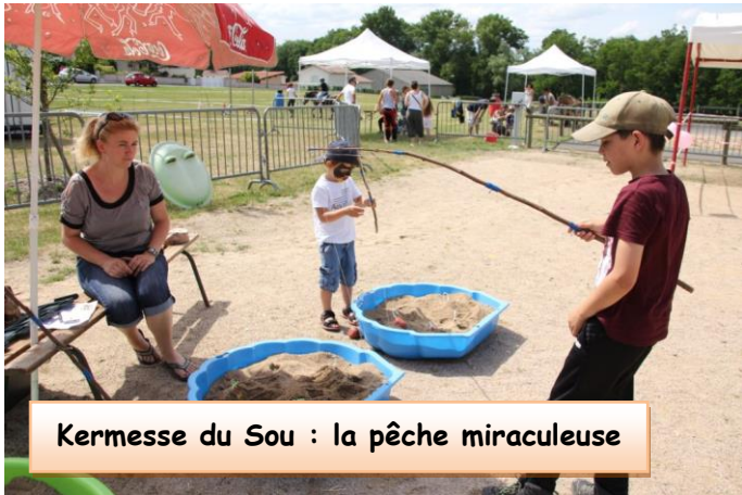
Kermesse du Sou : la pêche miraculeuse