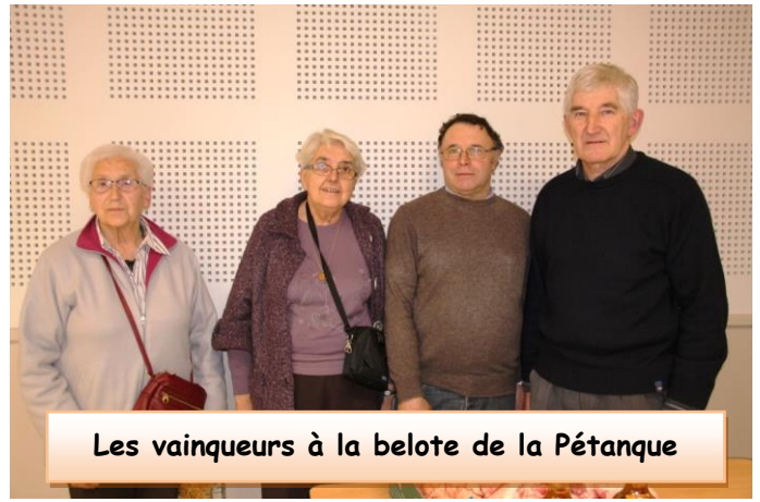
Les vainqueurs à la belote de la Pétanque