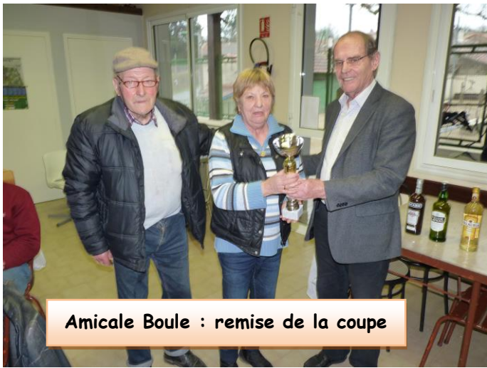
Amicale Boule : remise de la coupe