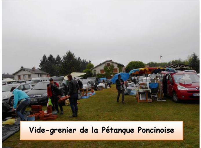
Vide-grenier de la Pétanque Poncinoise