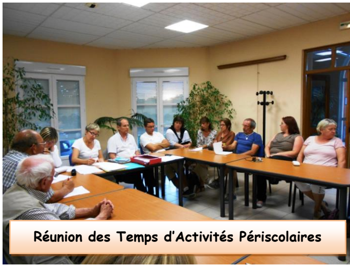
Réunion des Temps d'Activités Périscolaires