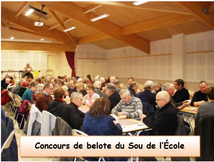
Concours de belote du Sou de l'École