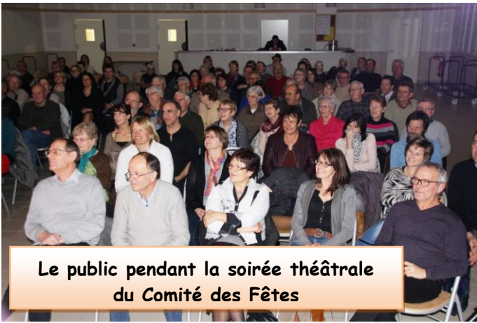
Le public pendant la soirée théâtrale du Comité des Fêtes