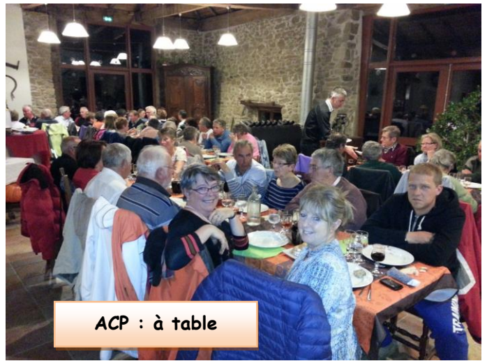
ACP : à table