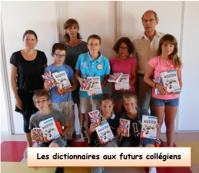
Les dictionnaires aux futurs collégiens