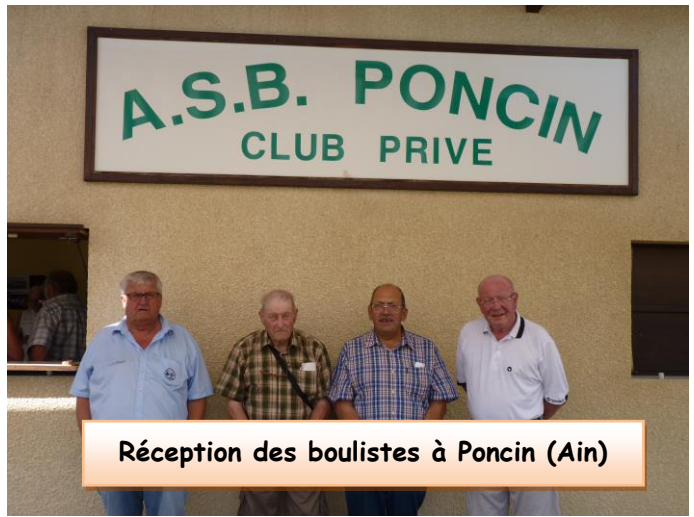
Réception des boulistes à Poncin (Ain)