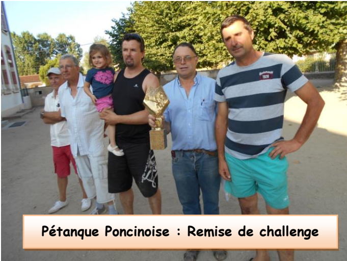
Pétanque Poncinoise : Remise de challenge