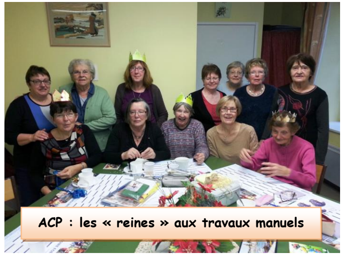
ACP : les « reines » aux travaux manuels