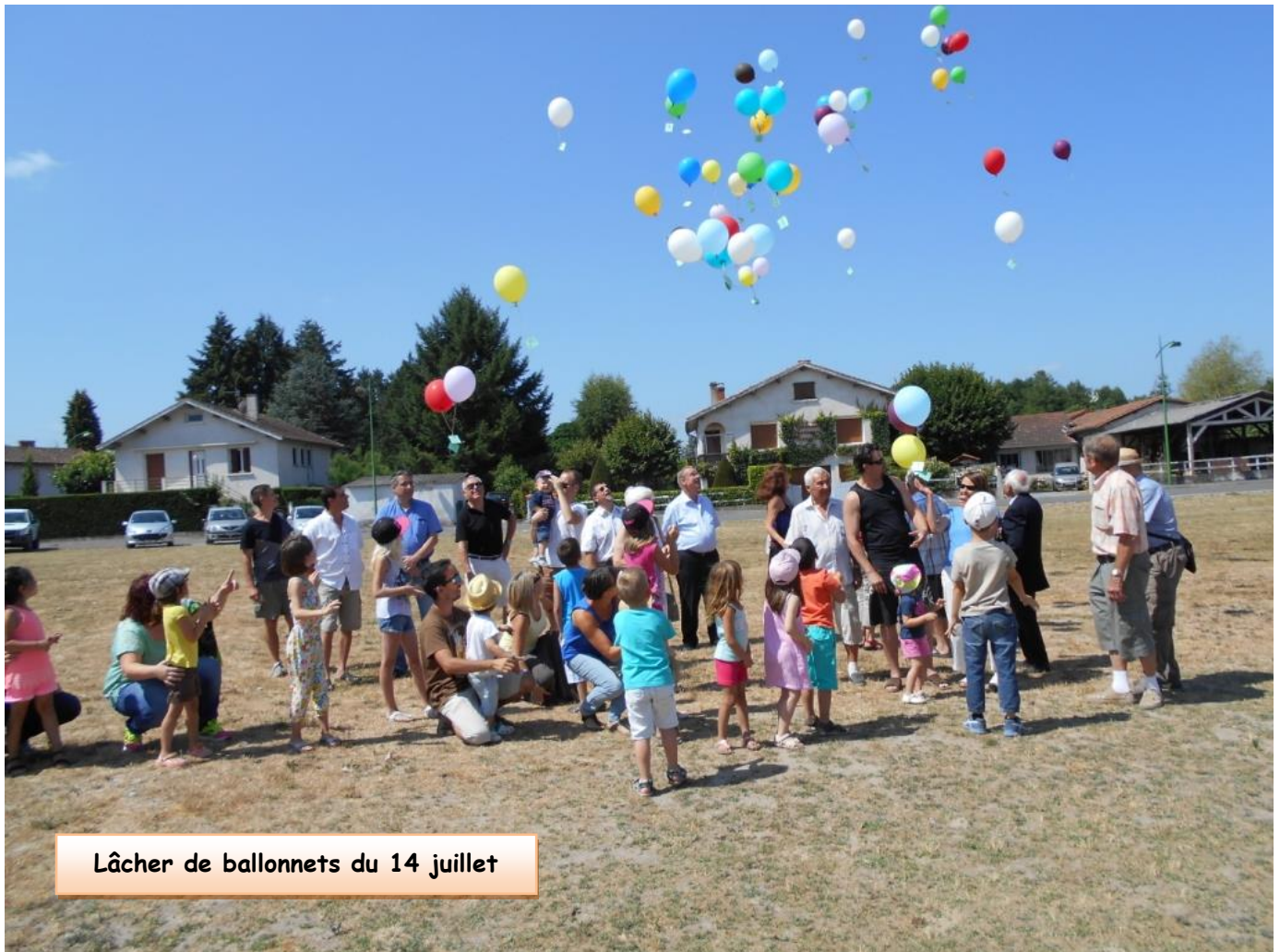
Lâcher de ballonnets du 14 juillet