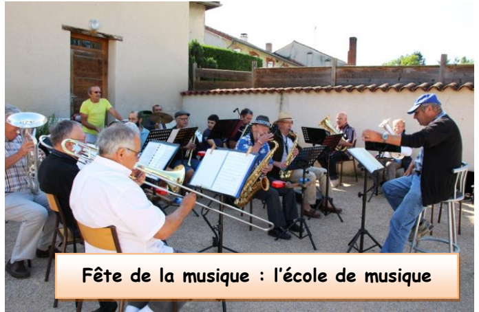
Fête de la musique : l'école de musique