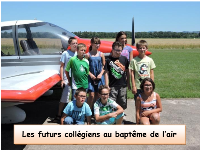
Les futurs collégiens au baptême de l'air