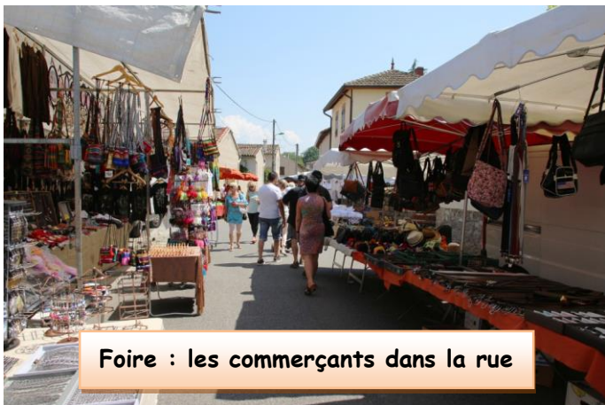
Foire : les commerçants dans la rue