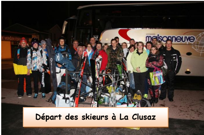
Départ des skieurs à La Clusaz