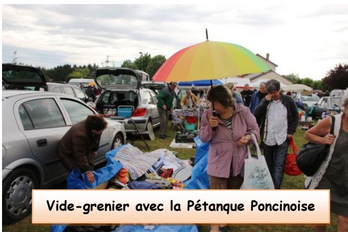
Vide-grenier avec la Pétanque Poncinoise