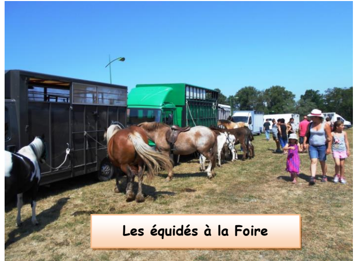
Les équidés à la Foire