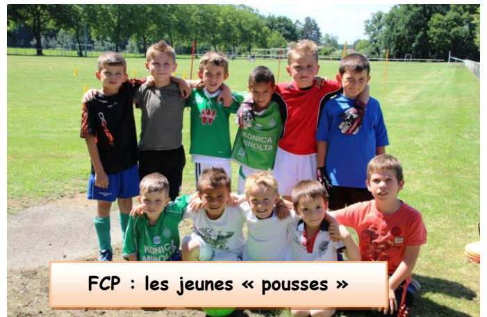
FCP : les jeunes « pousses »