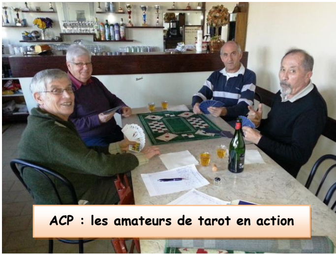
ACP : les amateurs de tarot en action