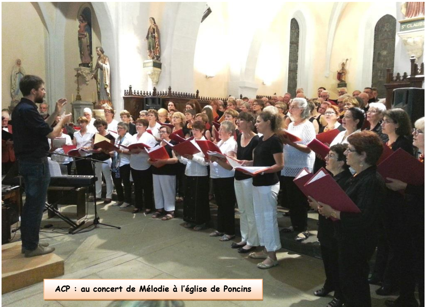
ACP : au concert de Mélodie à l'église de Poncins