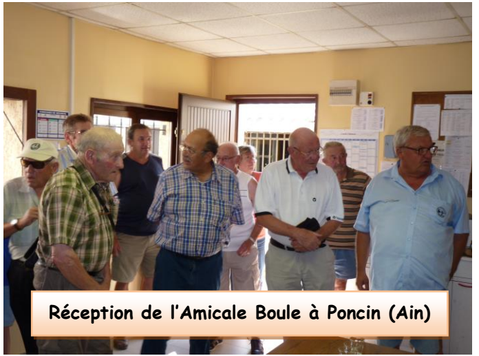
Réception de l'Amicale Boule à Poncin (Ain)