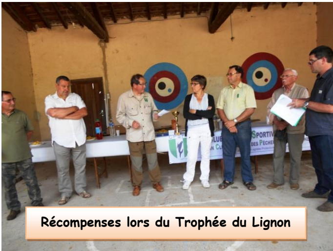
Récompenses lors du Trophée du Lignon