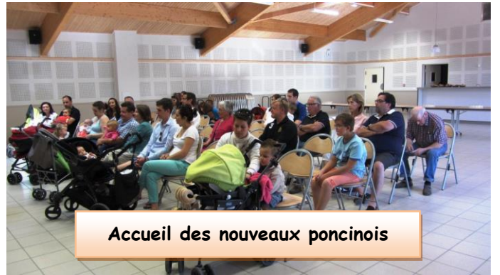
Accueil des nouveaux poncinois