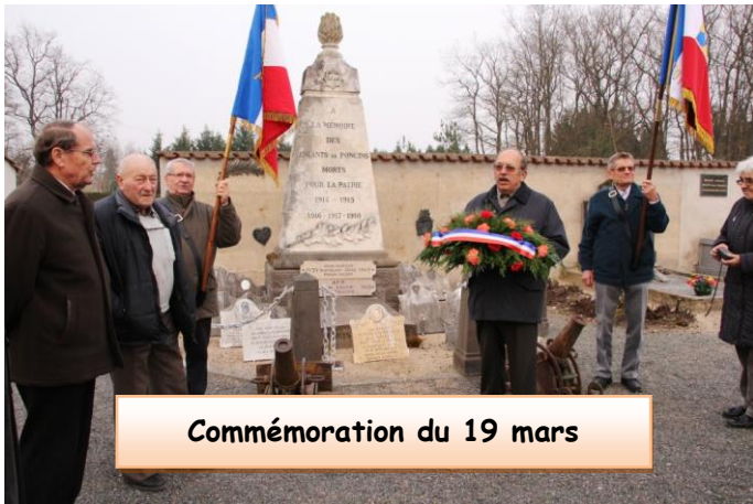
Commémoration du 19 mars