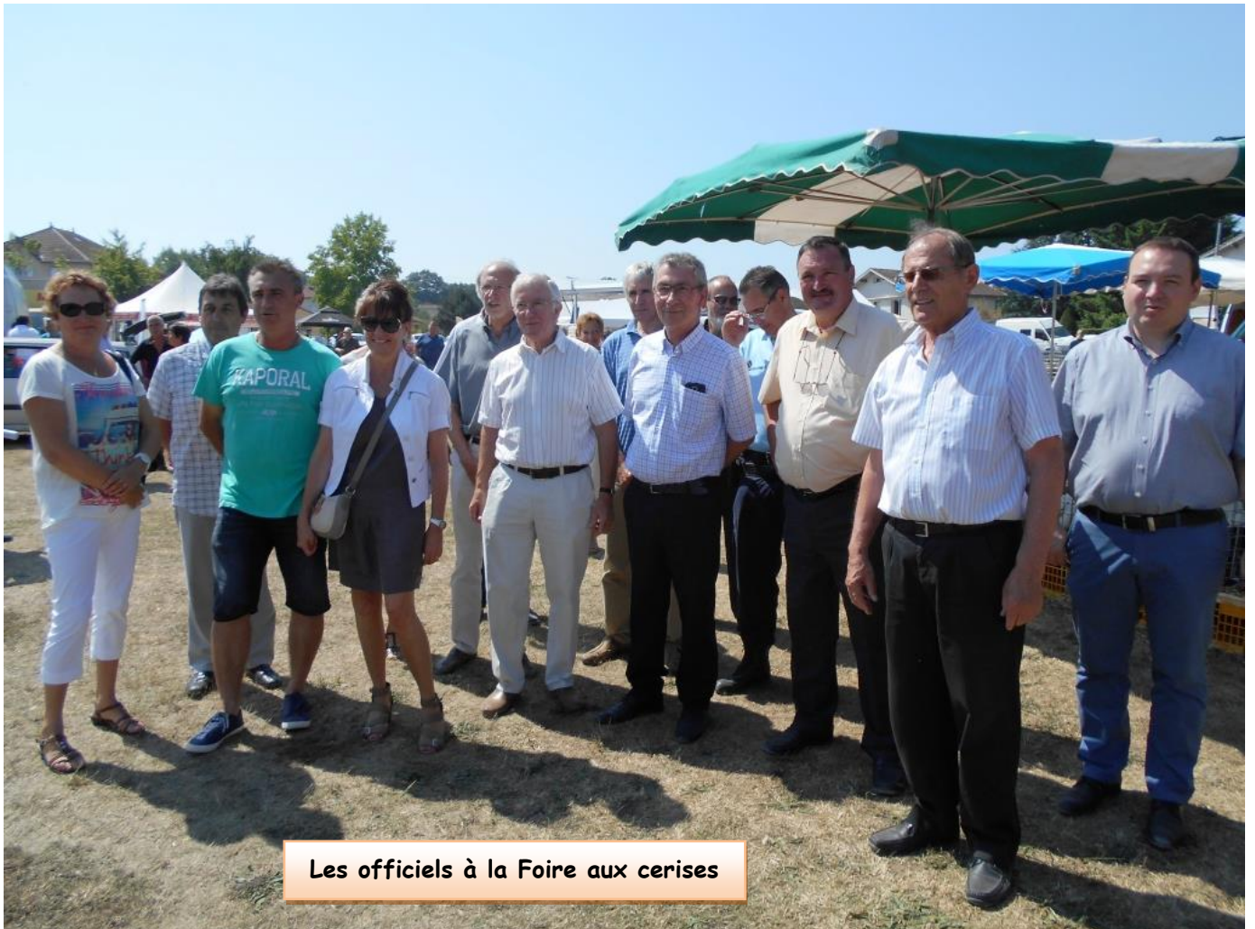
Les officiels à la Foire aux cerises