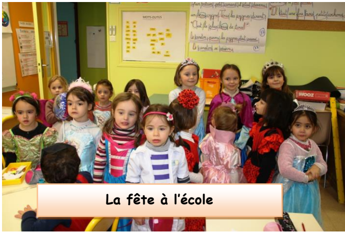
La fête à l'école