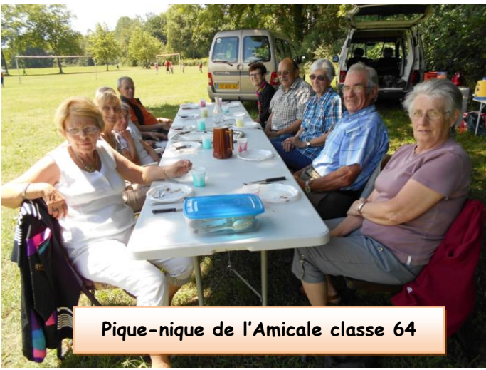
Pique-nique de l'Amicale classe 64