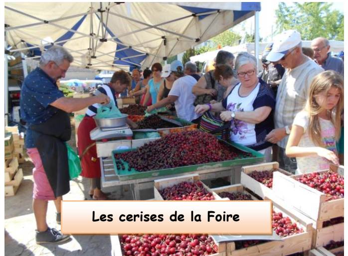
Les cerises de la Foire