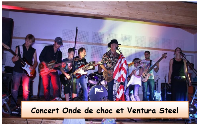
Concert Onde de choc et Ventura Steel