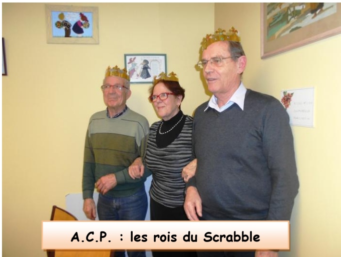
A.C.P. : les rois du Scrabble