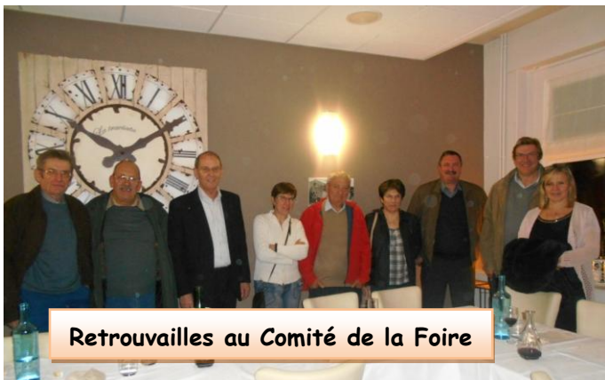
Retrouvailles au Comité de la Foire