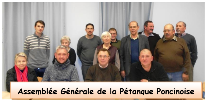
Assemblée Générale de la Pétanque Poncinoise