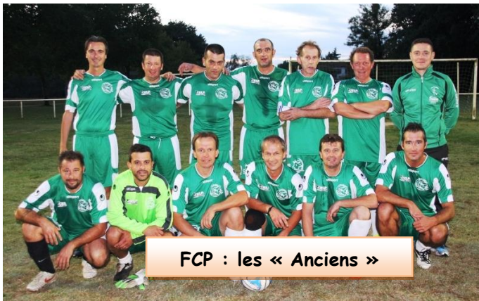
FCP : les « Anciens »