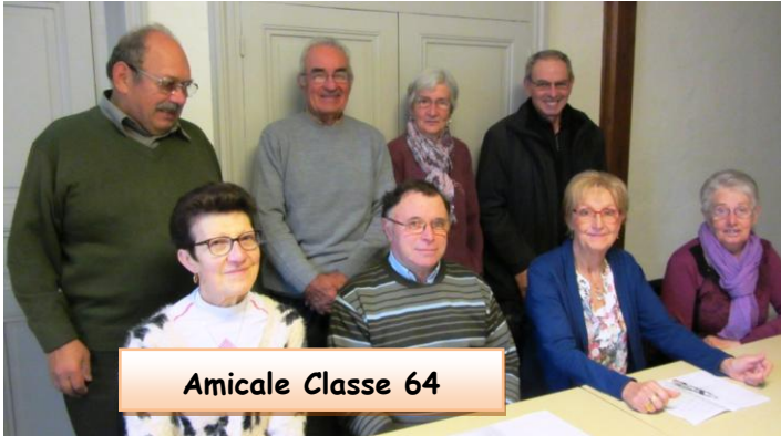
Amicale Classe 64