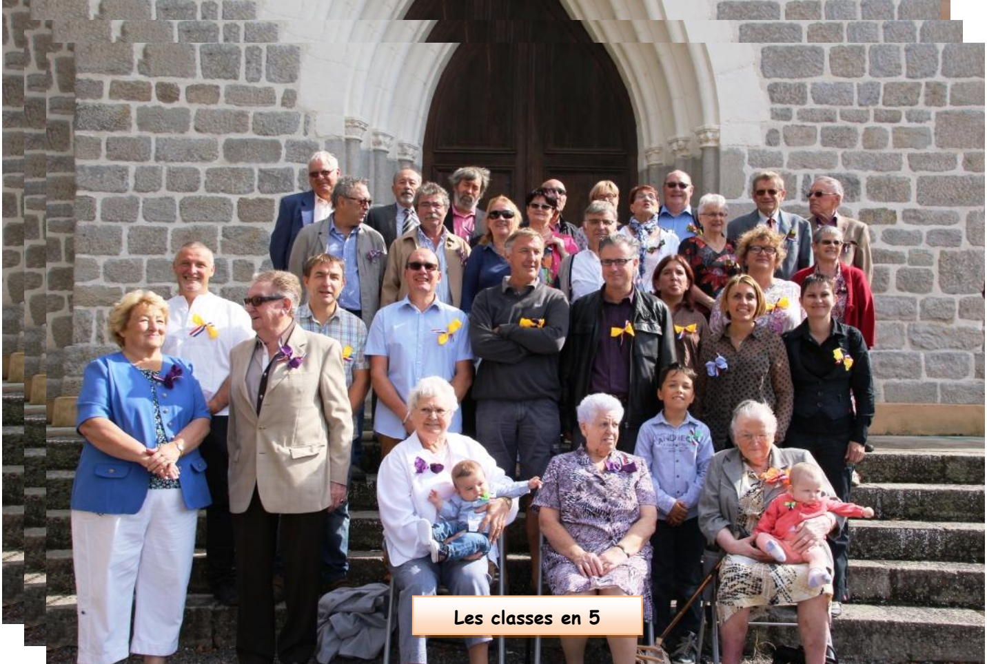
Les classes en 5