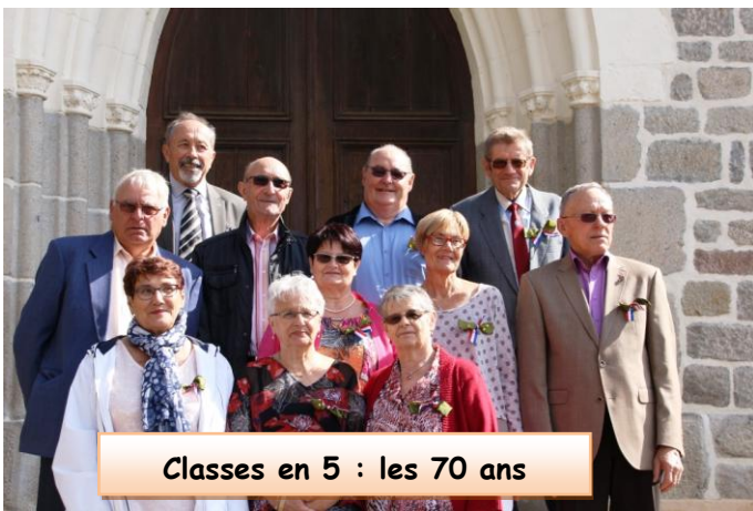
Classes en 5 : les 70 ans