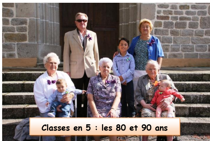
Classes en 5 : les 80 et 90 ans