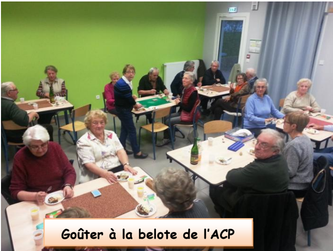
Goûter à la belote de l'ACP