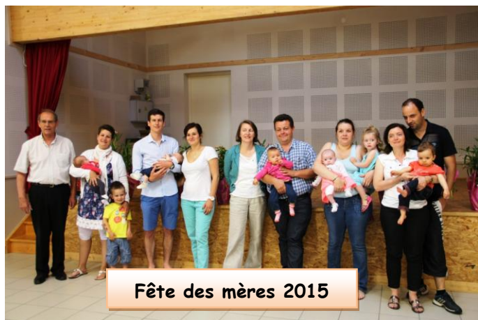
Fête des mères 2015