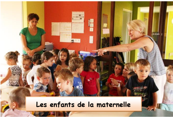
Les enfants de la maternelle