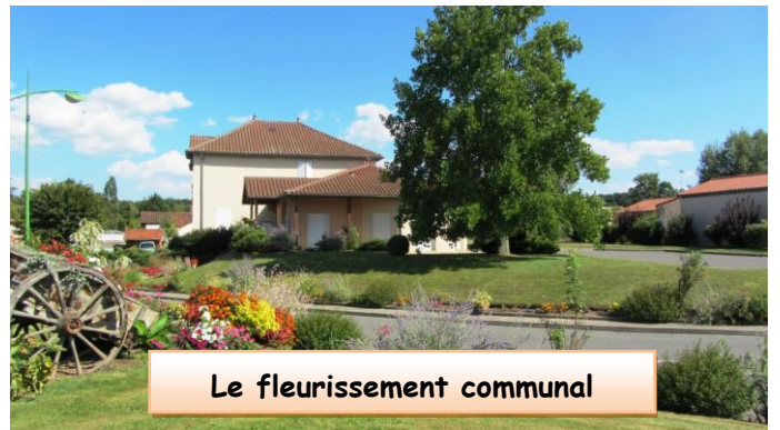
Le fleurissement communal