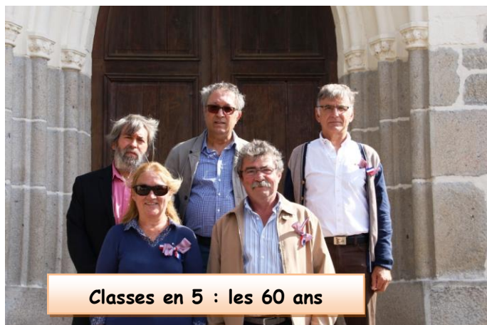
Classes en 5 : les 60 ans