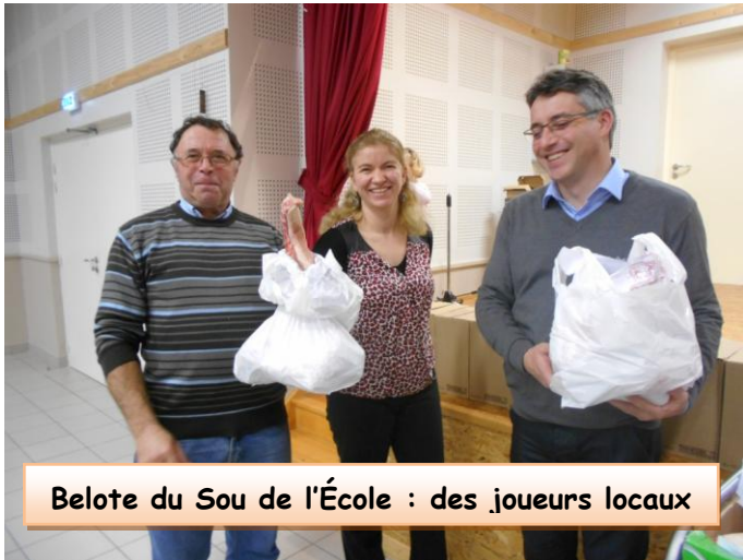
Belote du Sou de l'École : des joueurs locaux