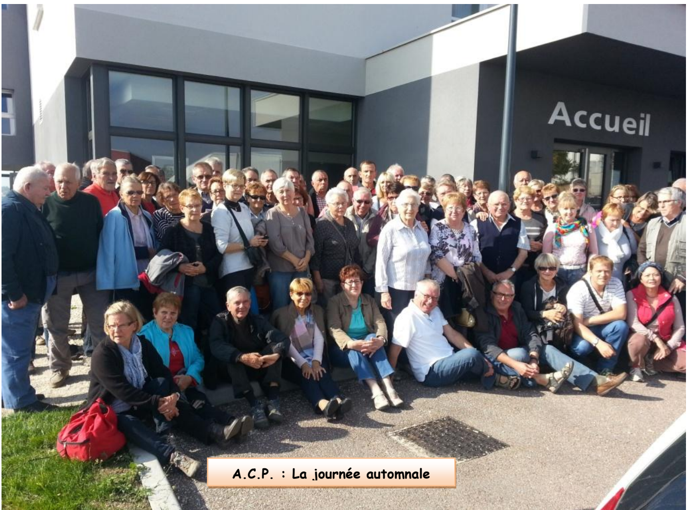
A.C.P. : La journée automnale