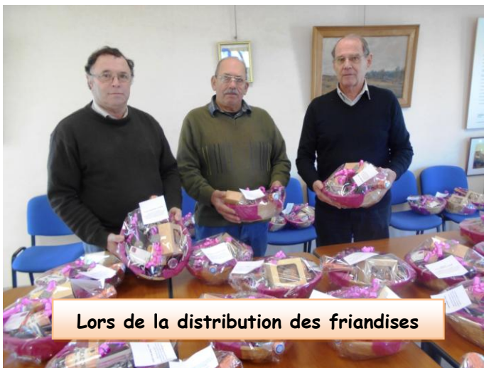
Lors de la distribution des friandises