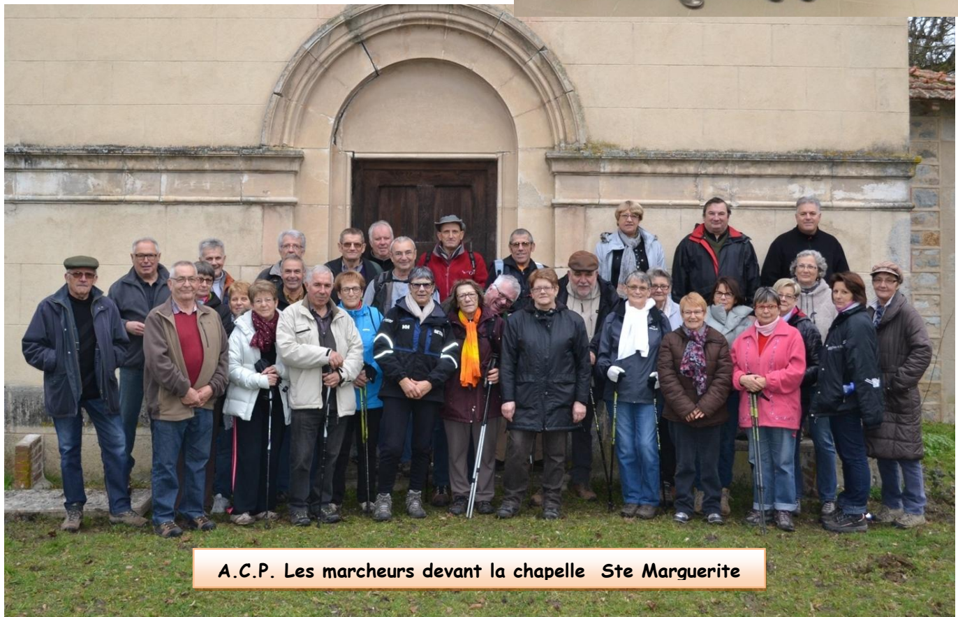
A.C.P. Les marcheurs devant la chapelle Ste Marguerite