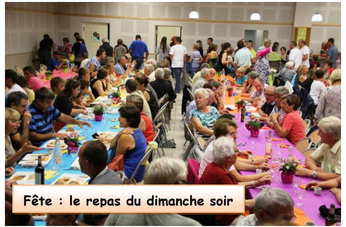
Fête : le repas du dimanche soir