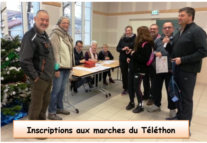
Inscriptions aux marches du Téléthon