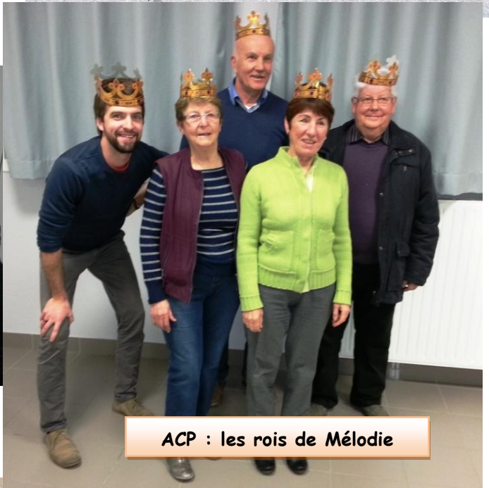
ACP : les rois de Mélodie