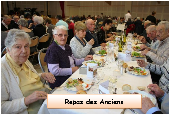
Repas des Anciens