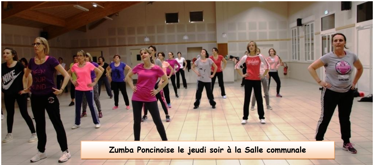
Zumba Poncinoise le jeudi soir à la Salle communale

L'illustration de ce blason s'explique par la présence dans le Lignon d'un poisson rare « l'ombre commun » et par l'existence depuis de nombreux siècles d'une foire aux cerises.