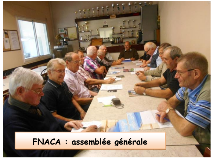
FNACA : assemblée générale