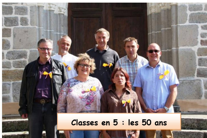
Classes en 5 : les 50 ans