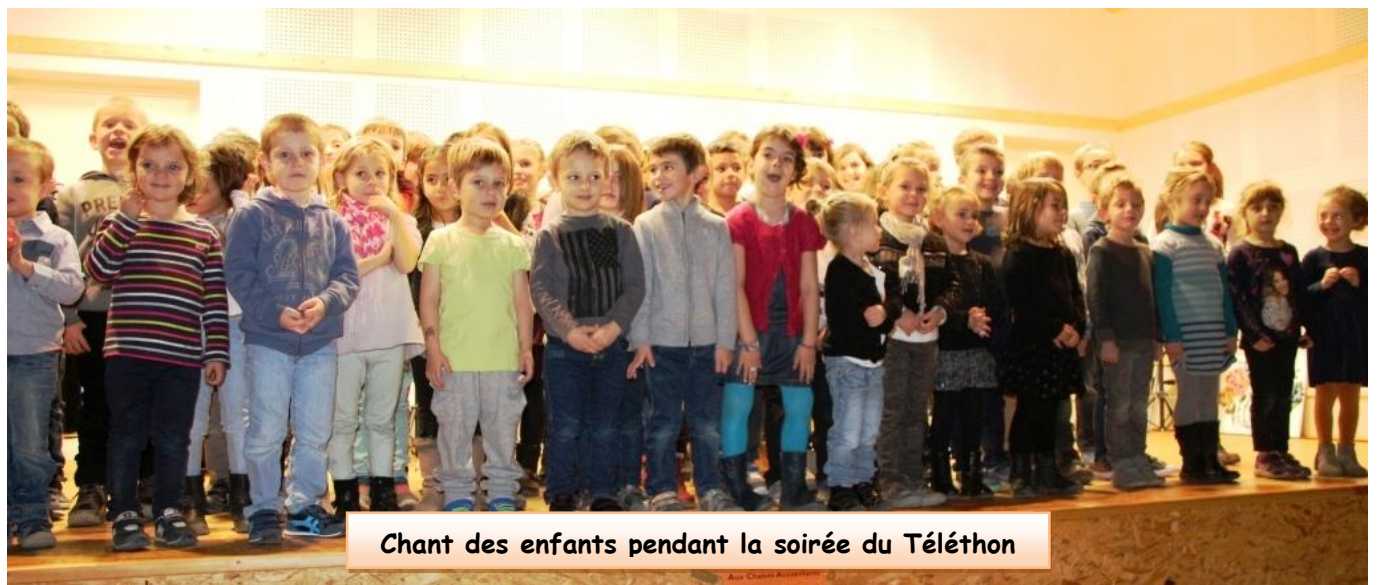
Chant des enfants pendant la soirée du Téléthon