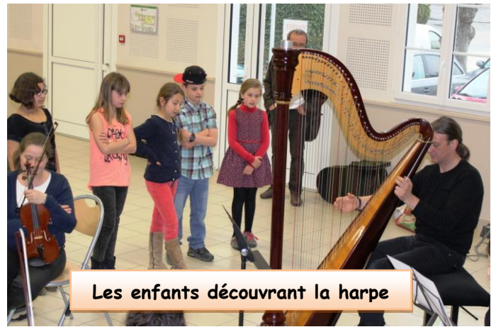
Les enfants découvrant la harpe