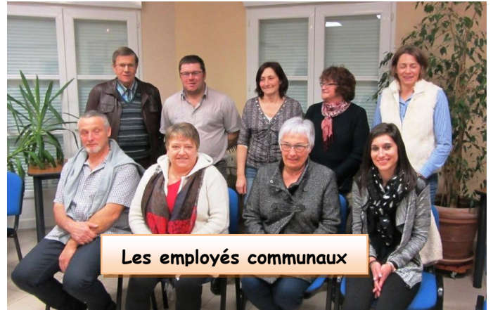
Les employés communaux