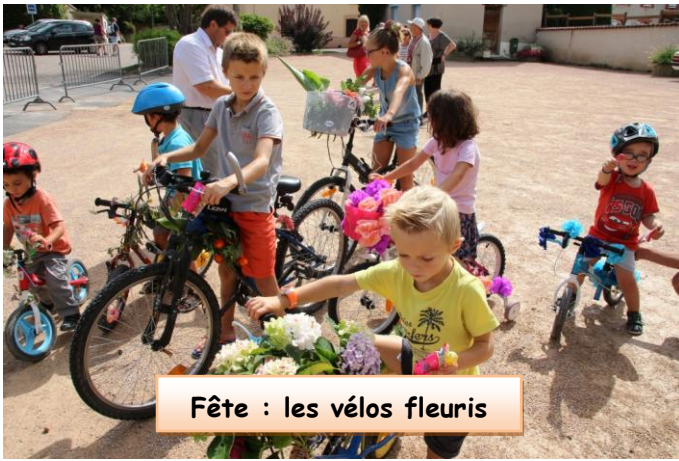
Fête : les vélos fleuris