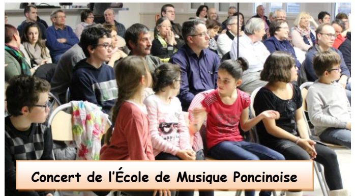
Concert de l'École de Musique Poncinoise