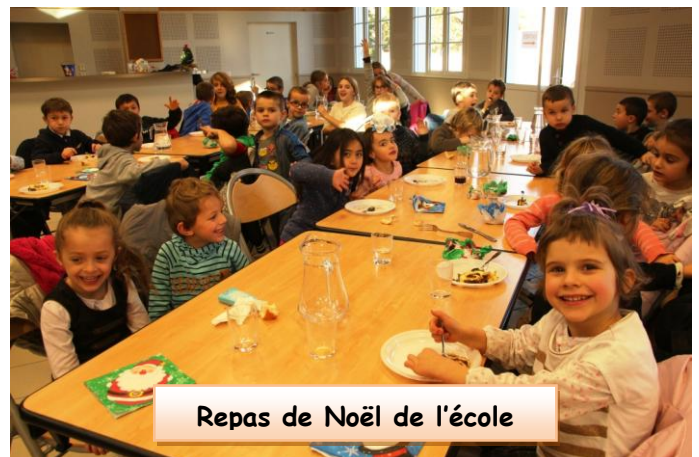
Repas de Noël de l'école