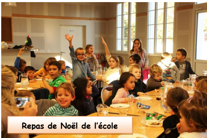
Repas de Noël de l'école