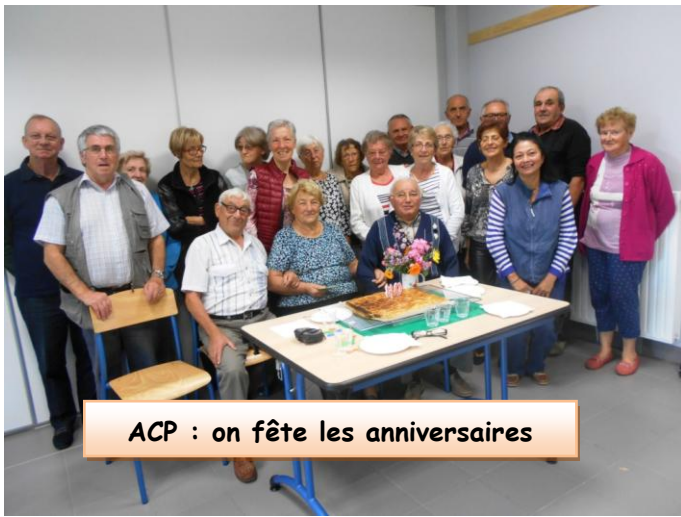
ACP : on fête les anniversaires