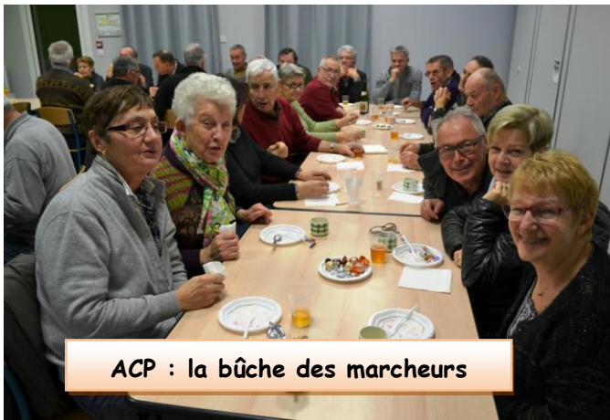
ACP : la bûche des marcheurs