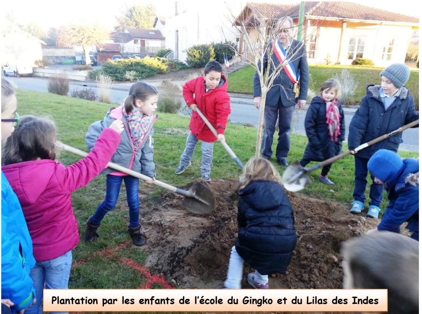
Plantation par les enfants de l'école du Gingko et du Lilas des Indes