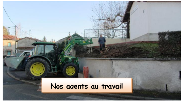
Nos agents au travail