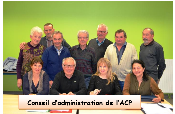
Conseil d'administration de l'ACP