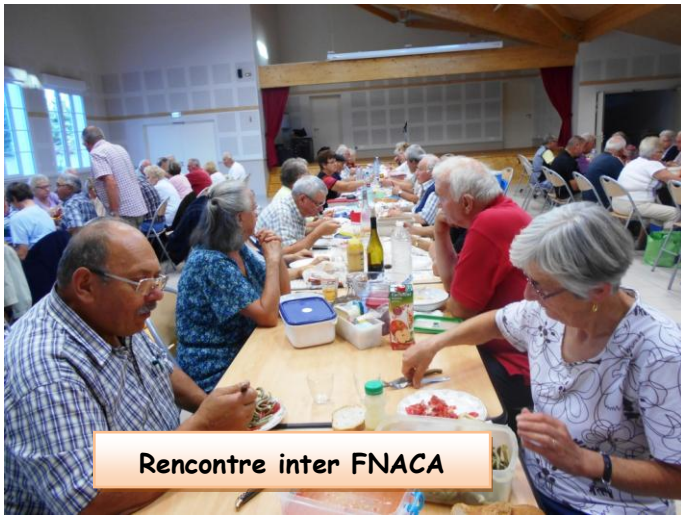
Rencontre inter FNACA