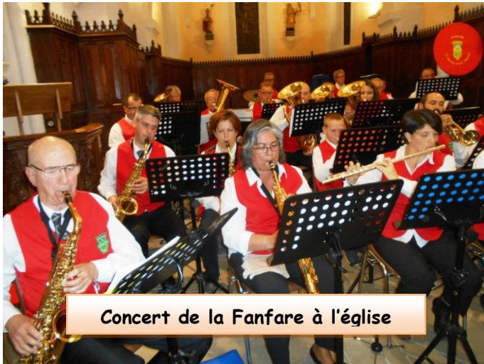
Concert de la Fanfare à l'église