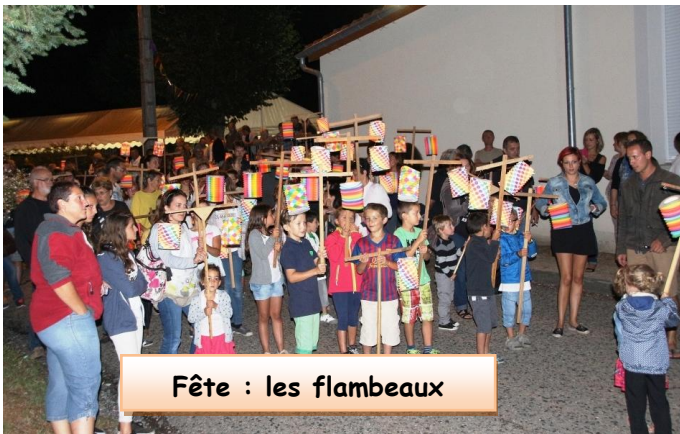
Fête : les flambeaux