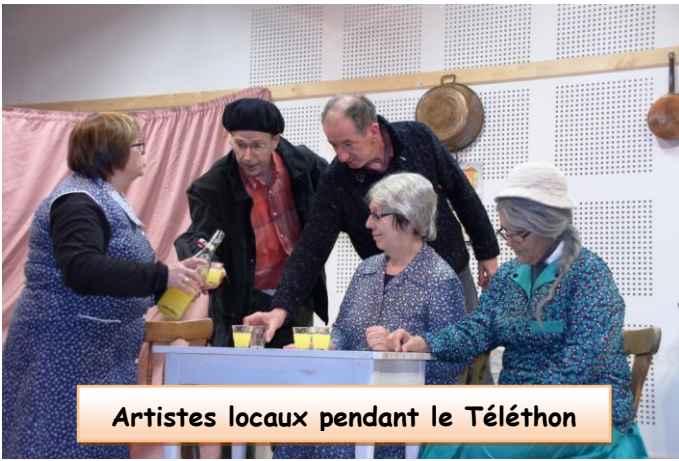
Artistes locaux pendant le Téléthon