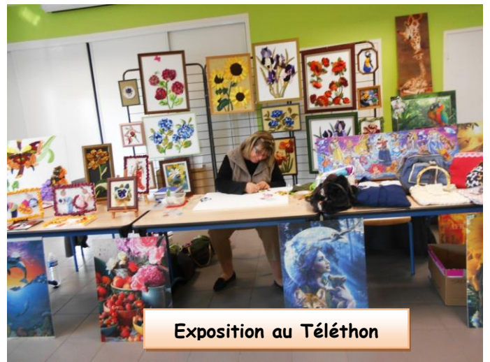
Exposition au Téléthon