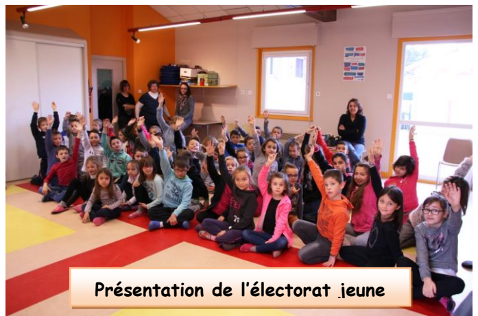
Présentation de l'électorat jeune