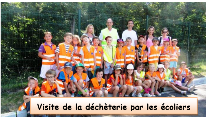
Visite de la déchèterie par les écoliers