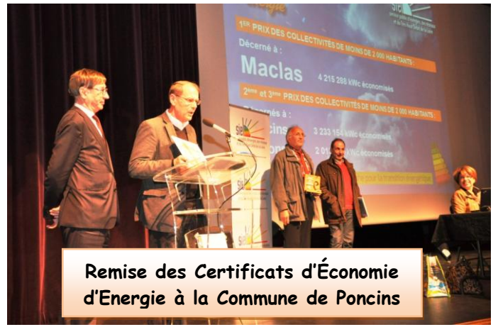
Remise des Certificats d'Économie d'Énergie à la Commune de Poncins