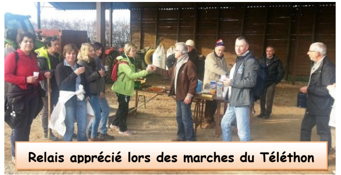
Relais apprécié lors des marches du Téléthon