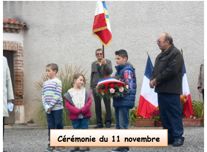
Cérémonie du 11 novembre