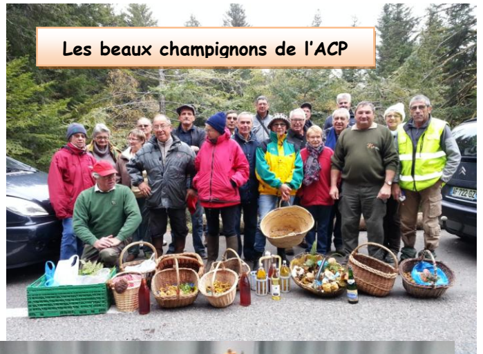
Les beaux champignons de l'ACP