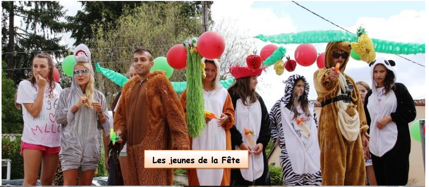
Les jeunes de la Fête