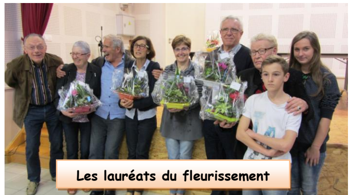
Les lauréats du fleurissement