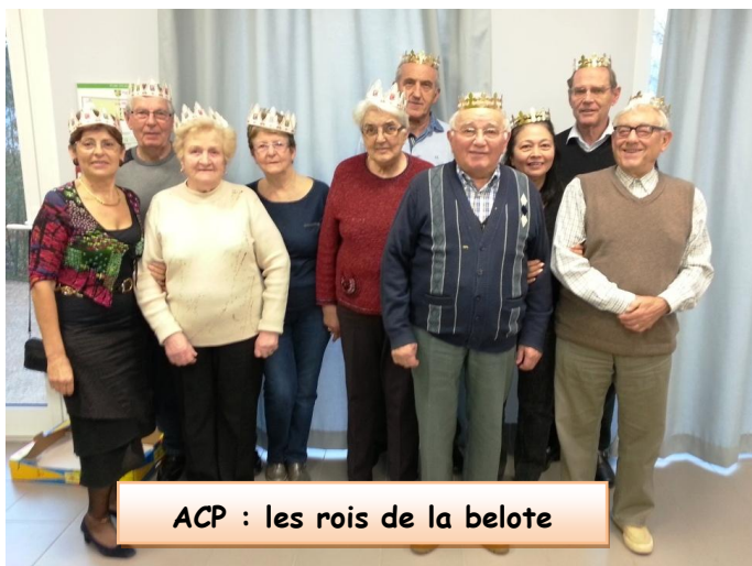
ACP : les rois de la belote