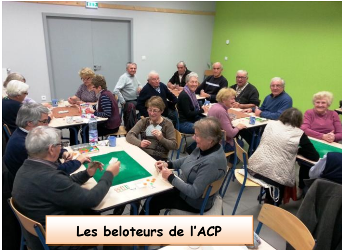
Les beloteurs de l'ACP