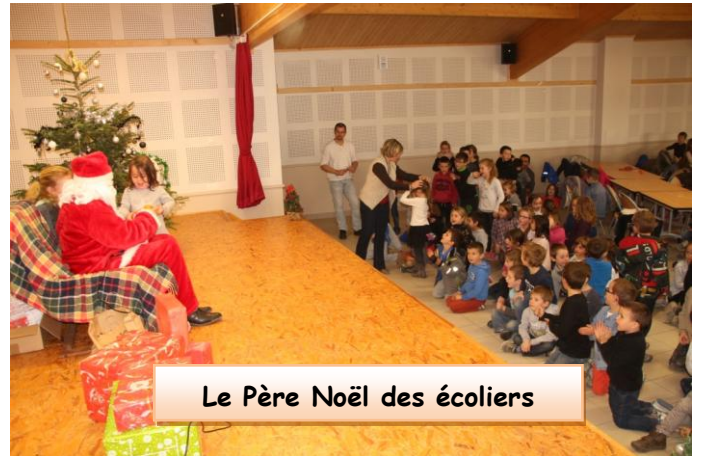
Le Père Noël des écoliers