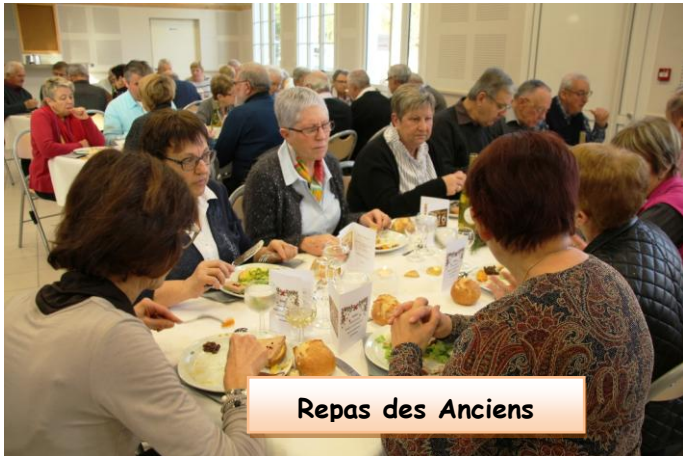
Repas des Anciens