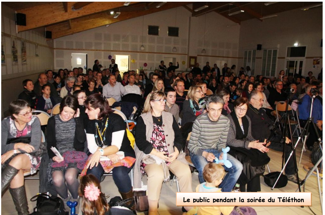
Le public pendant la soirée du Téléthon