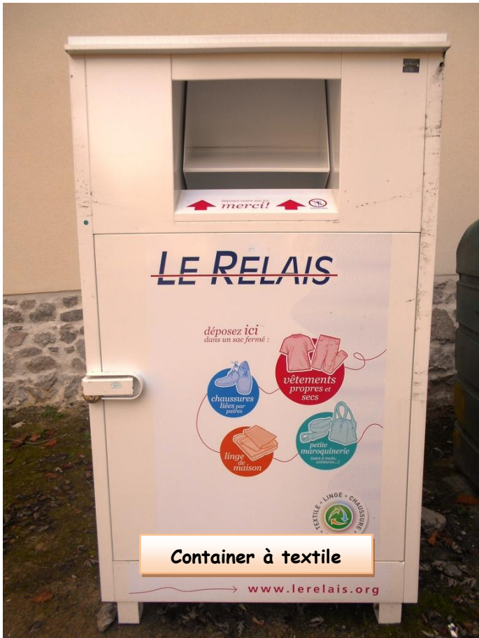
Container à textile www.lerelais.org