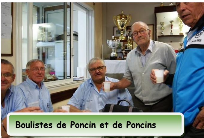
Boulistes de Poncin et de Poncins