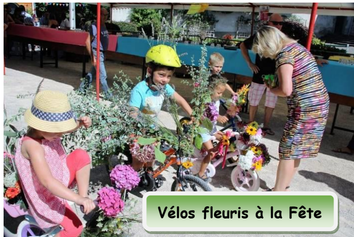
Vélos fleuris à la Fête