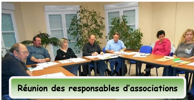
Réunion des responsables d'associations