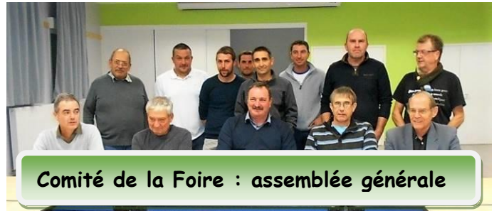
Comité de la Foire : assemblée générale