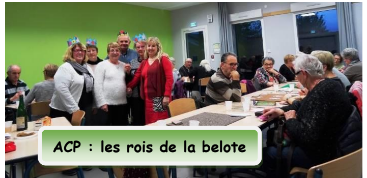
ACP : les rois de la belote