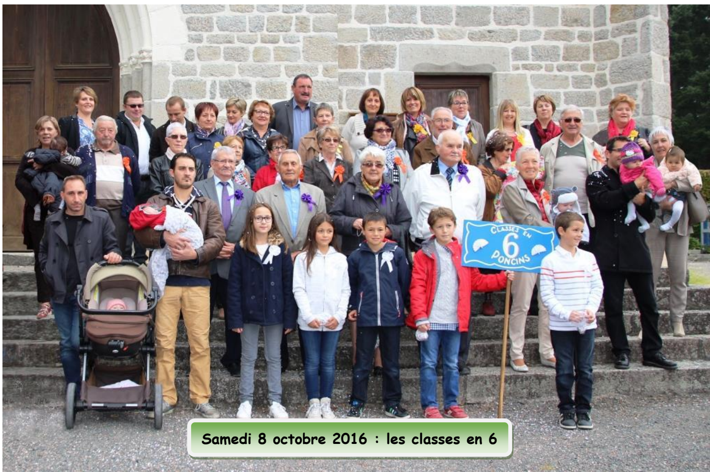
Samedi 8 octobre 2016 : les classes en 6