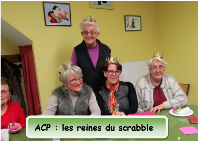
ACP : les reines du scrabble