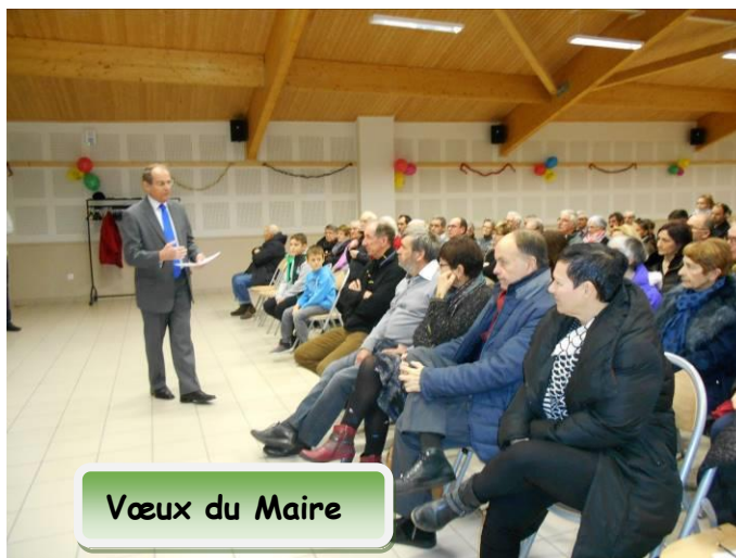
Vœux du Maire