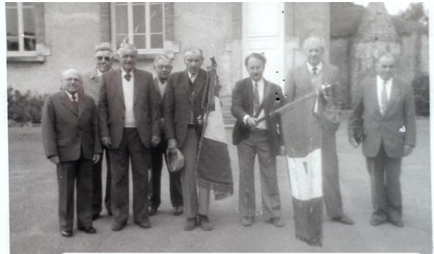
Anciens combattants de Poncins