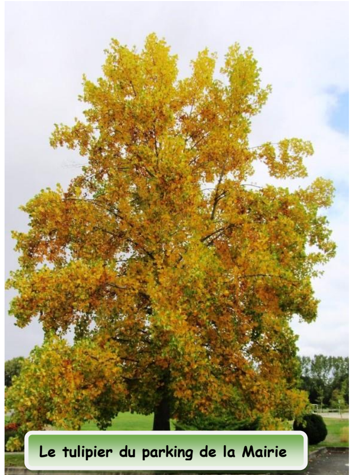
Le tulipier du parking de la Mairie