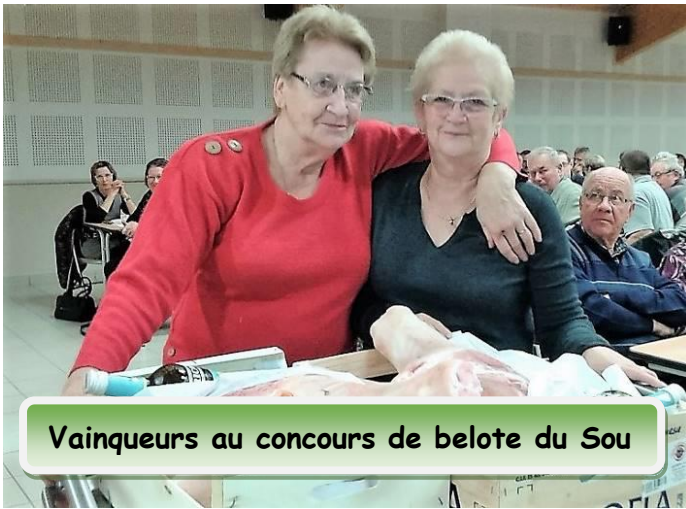
Vainqueurs au concours de belote du Sou