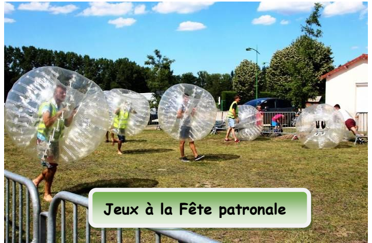
Jeux à la Fête patronale