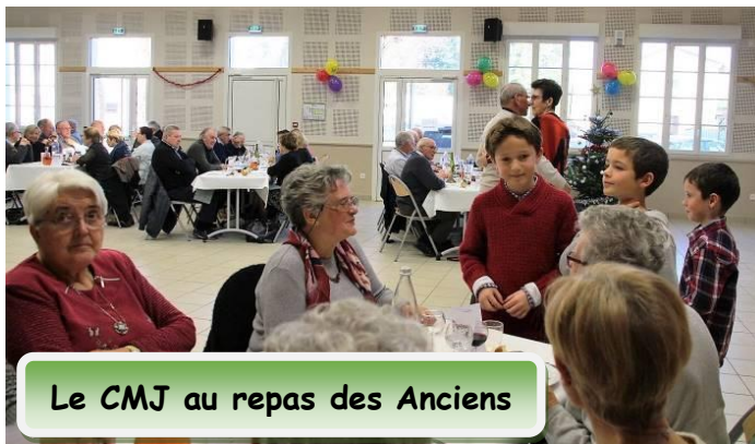
Le CMJ au repas des Anciens