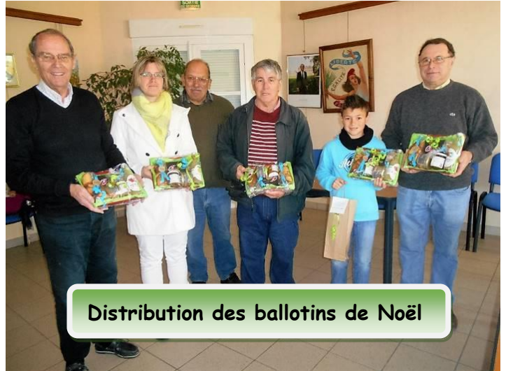
Distribution des ballotins de Noël