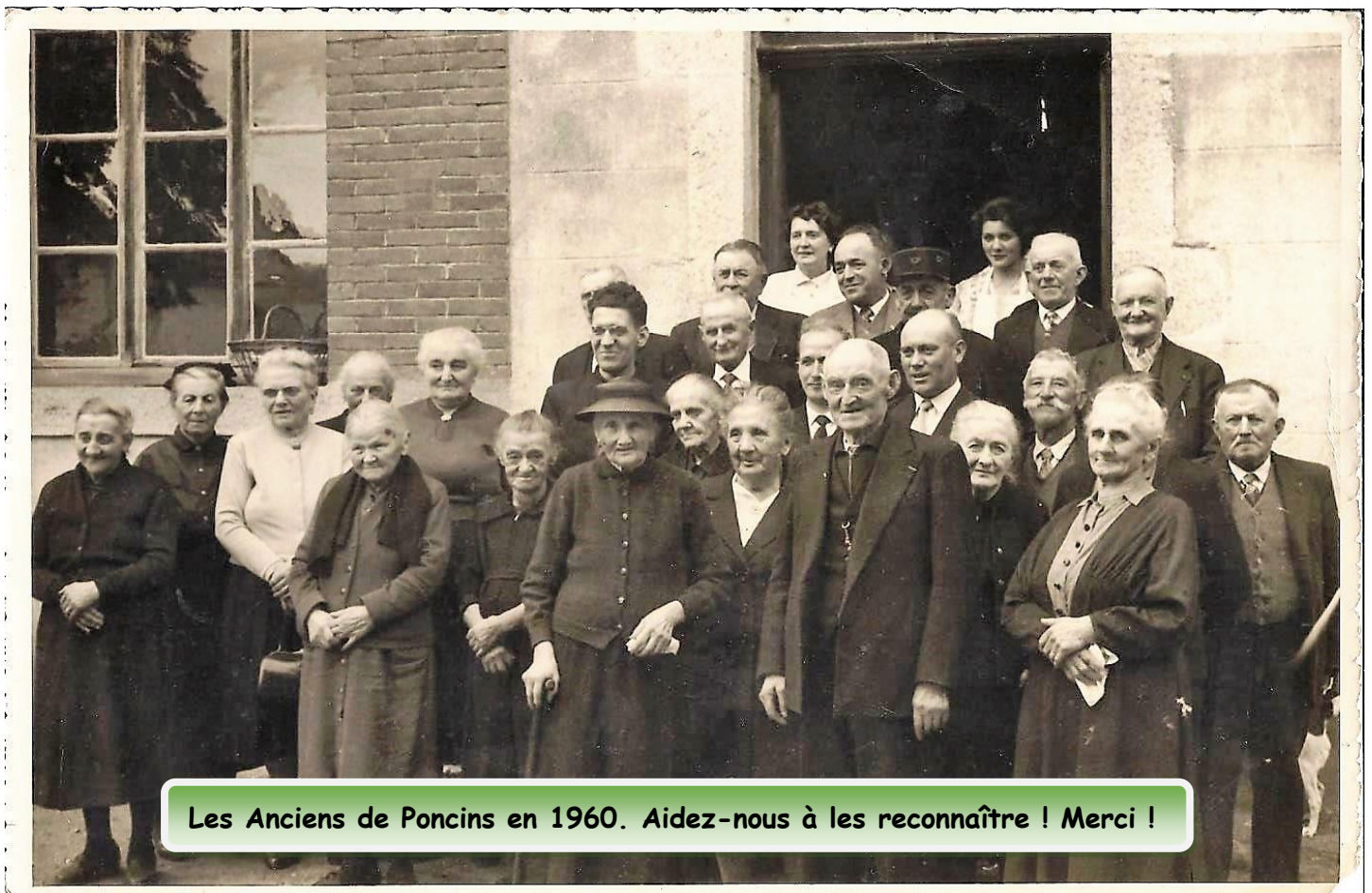
Les Anciens de Poncins en 1960. Aidez-nous à les reconnaître ! Merci !