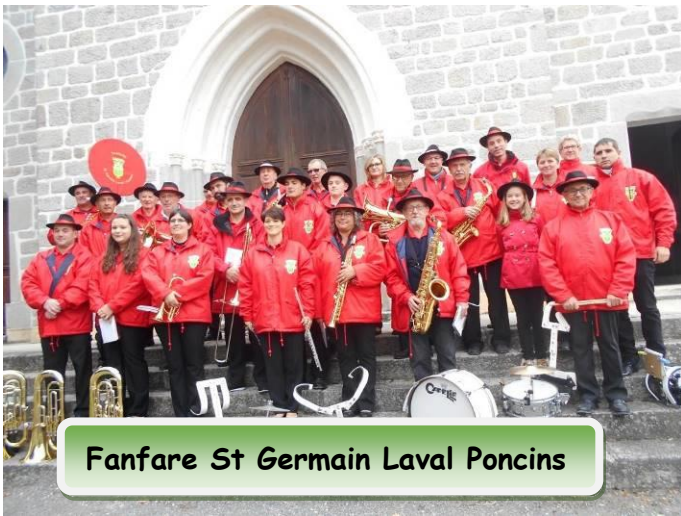
Fanfare St Germain Laval Poncins