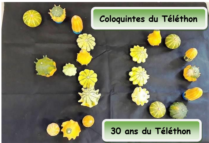
Coloquintes du Téléthon