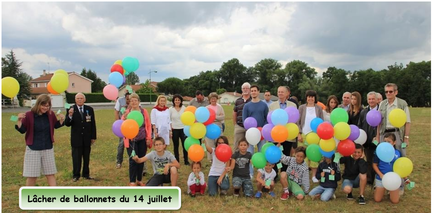
Lâcher de ballonnets du 14 juillet