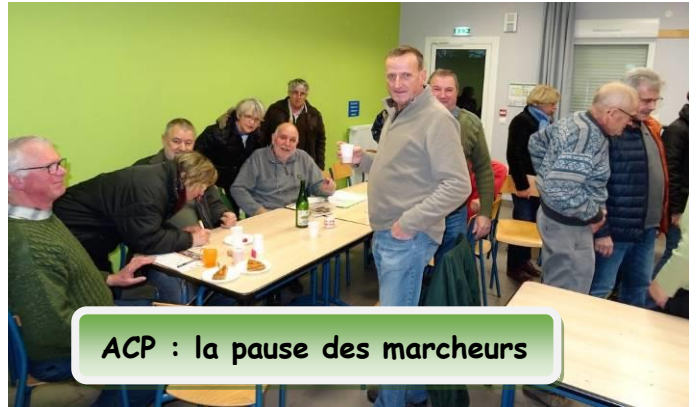
ACP : la pause des marcheurs