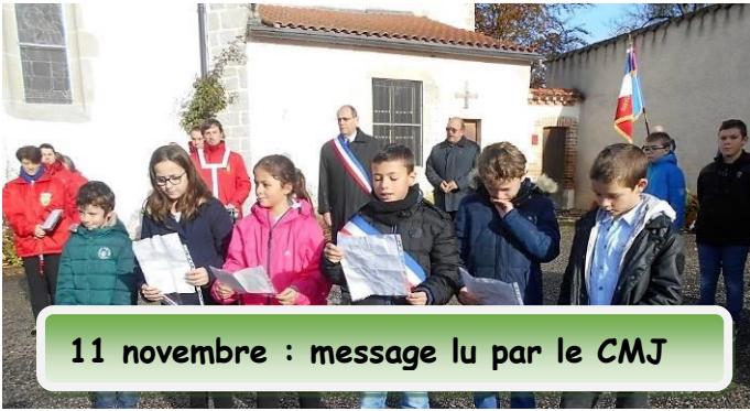
11 novembre : message lu par le CMJ