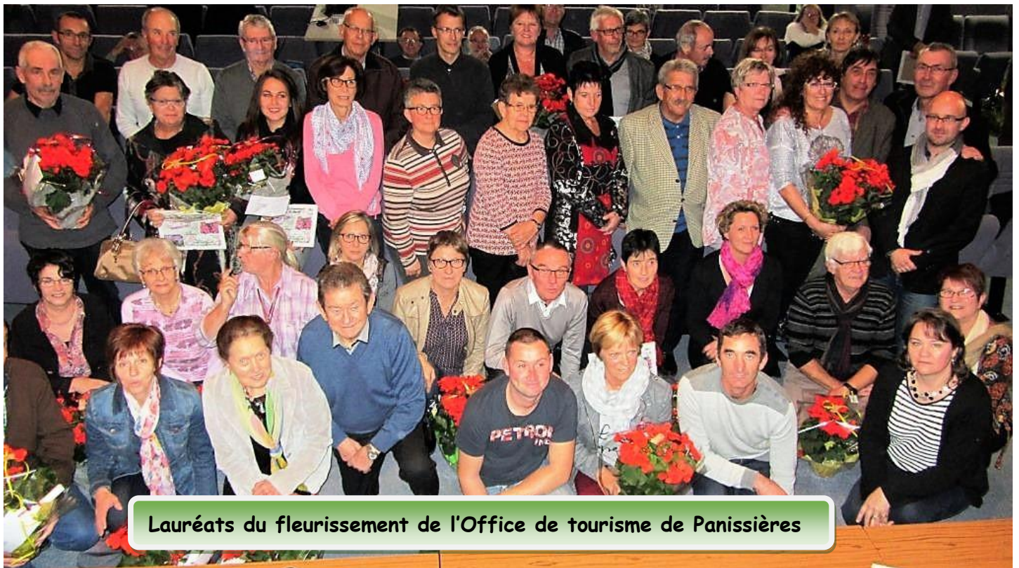
Lauréats du fleurissement de l'Office de tourisme de Panissières