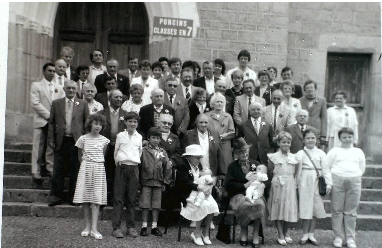
Classes en 7 en 1987 Les reconnaissez-vous ?