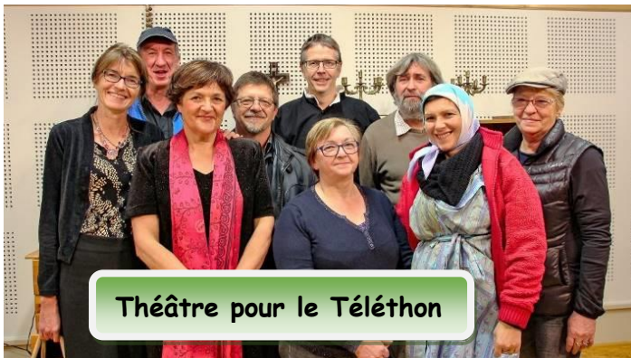
Théâtre pour le Téléthon