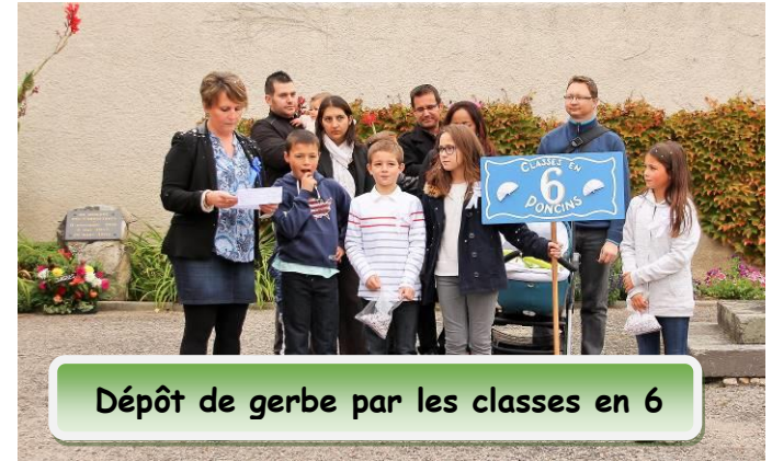
Dépôt de gerbe par les classes en 6