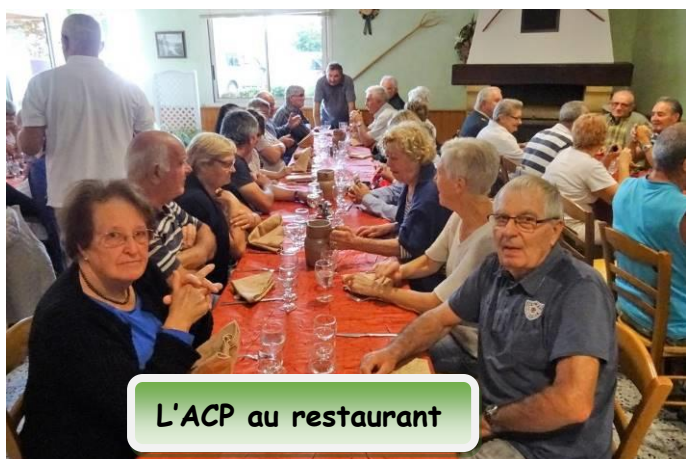
L'ACP au restaurant