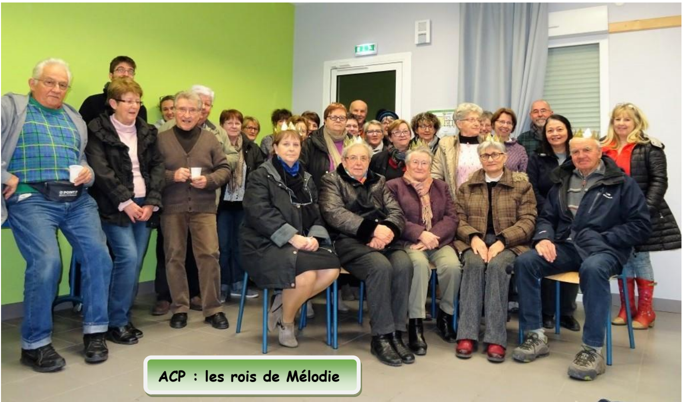
ACP : les rois de Mélodie