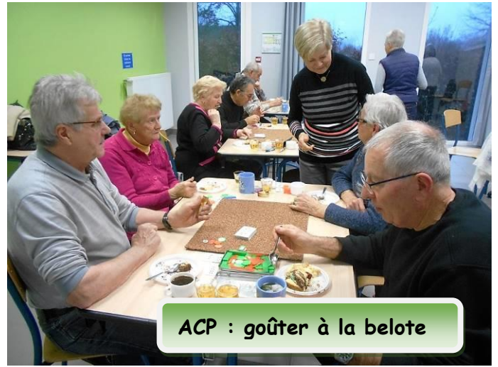
ACP : goûter à la belote