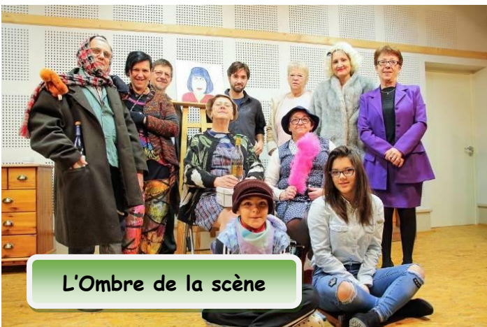
L'Ombre de la scène