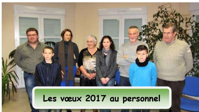
Les vœux 2017 au personnel