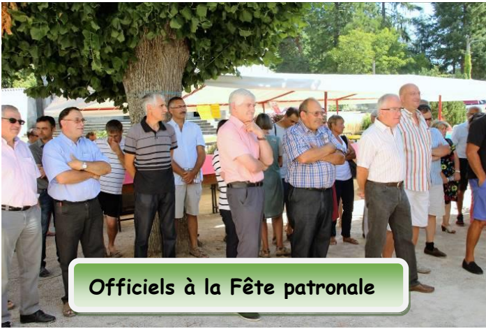
Officiels à la Fête patronale