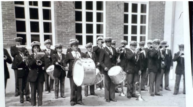
Fanfare de St Germain Laval Poncins