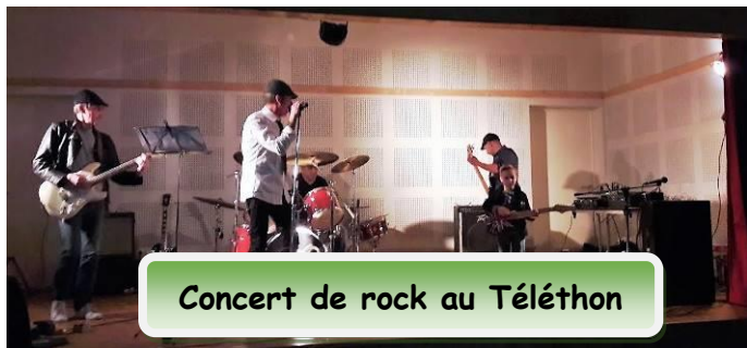
Concert de rock au Téléthon