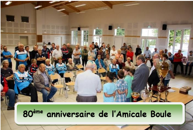
80 ème anniversaire de l'Amicale Boule