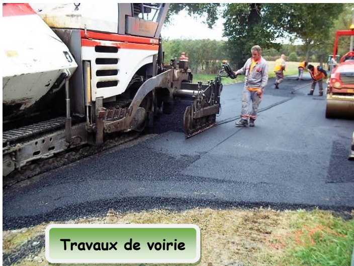
Travaux de voirie