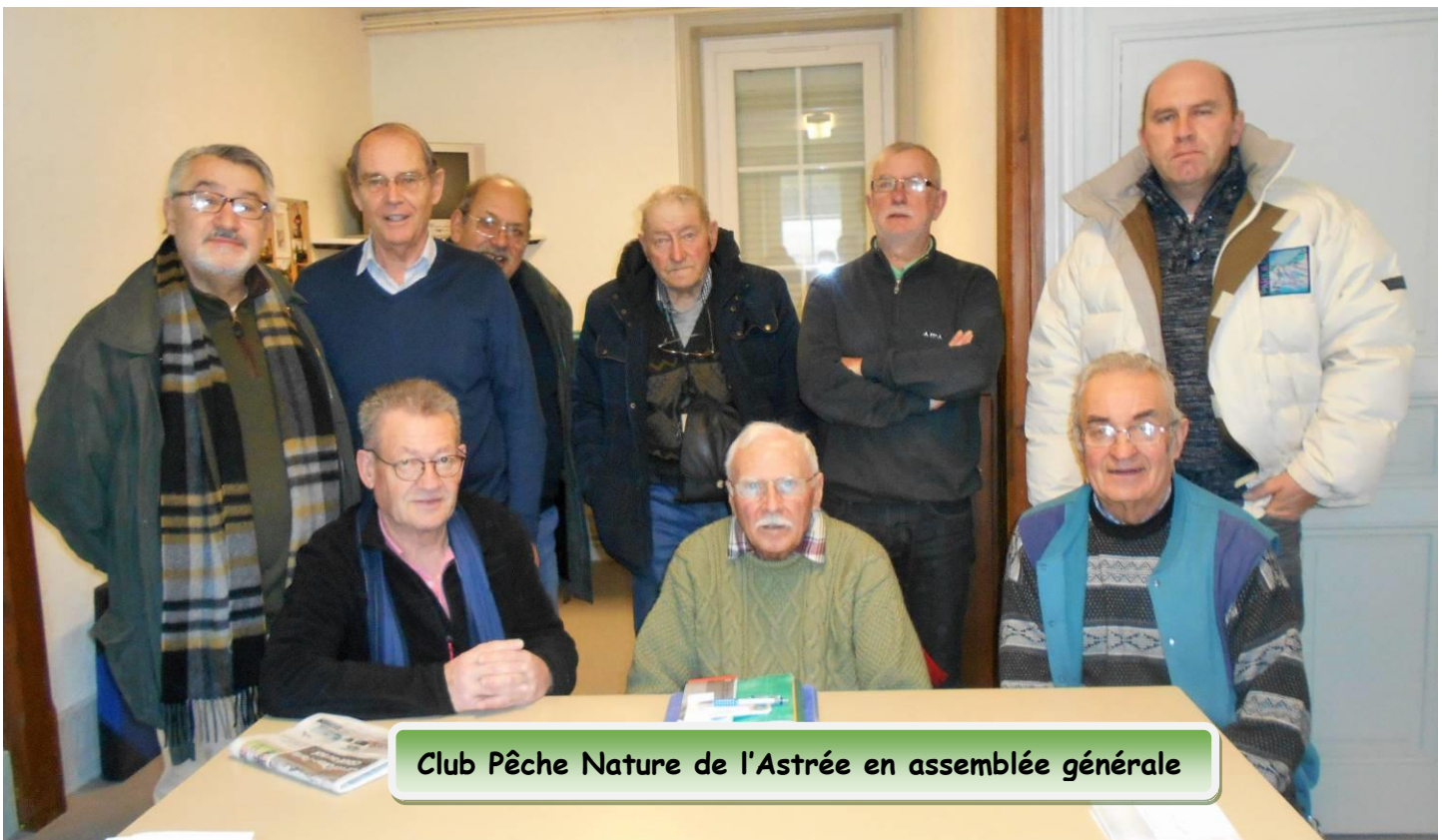
Club Pêche Nature de l'Astrée en assemblée générale