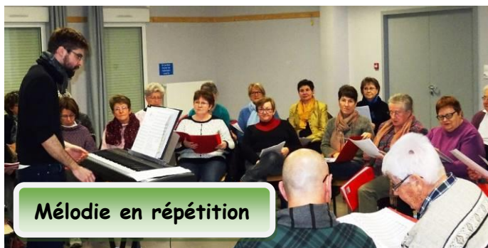
Mélodie en répétition