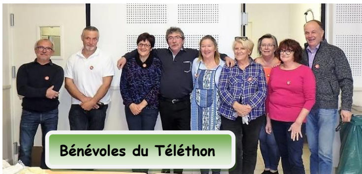
Bénévoles du Téléthon