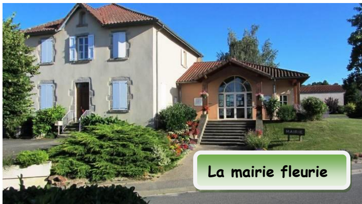
La mairie fleurie