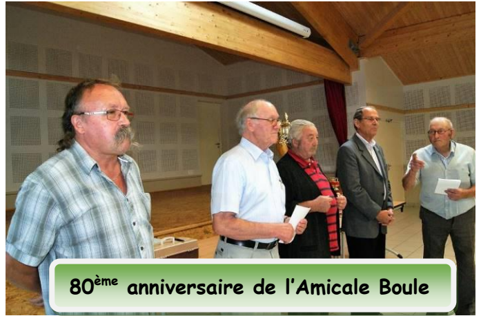
80 ème anniversaire de l'Amicale Boule