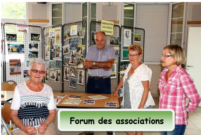
Forum des associations