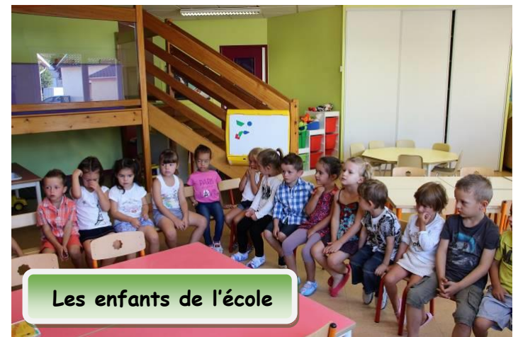
Les enfants de l'école