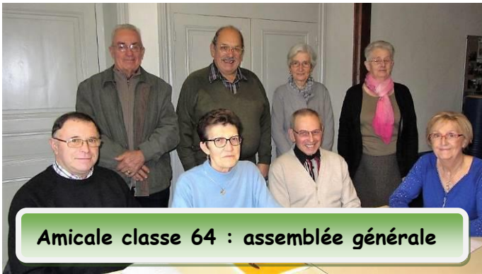
Amicale classe 64 : assemblée générale