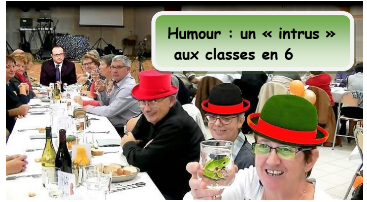
Humour : un « intrus » aux classes en 6