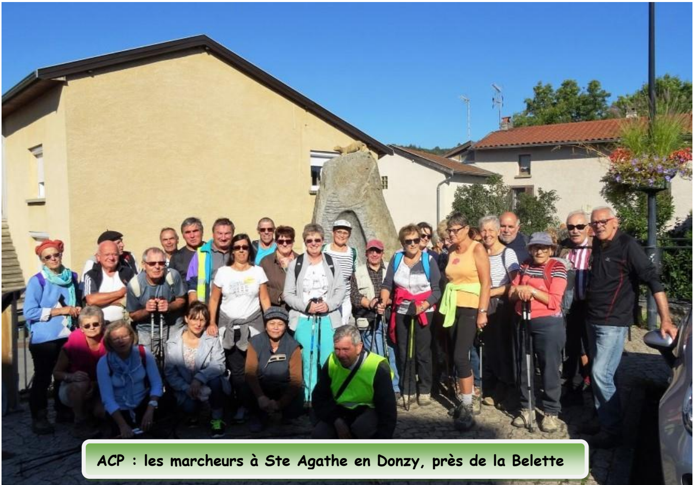
ACP : les marcheurs à Ste Agathe en Donzy, près de la Belette