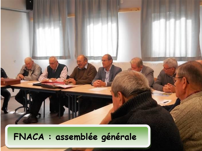
FNACA : assemblée générale