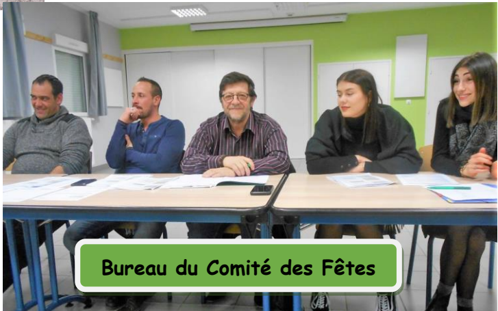
Bureau du Comité des Fêtes