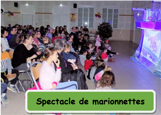
Spectacle de marionnettes