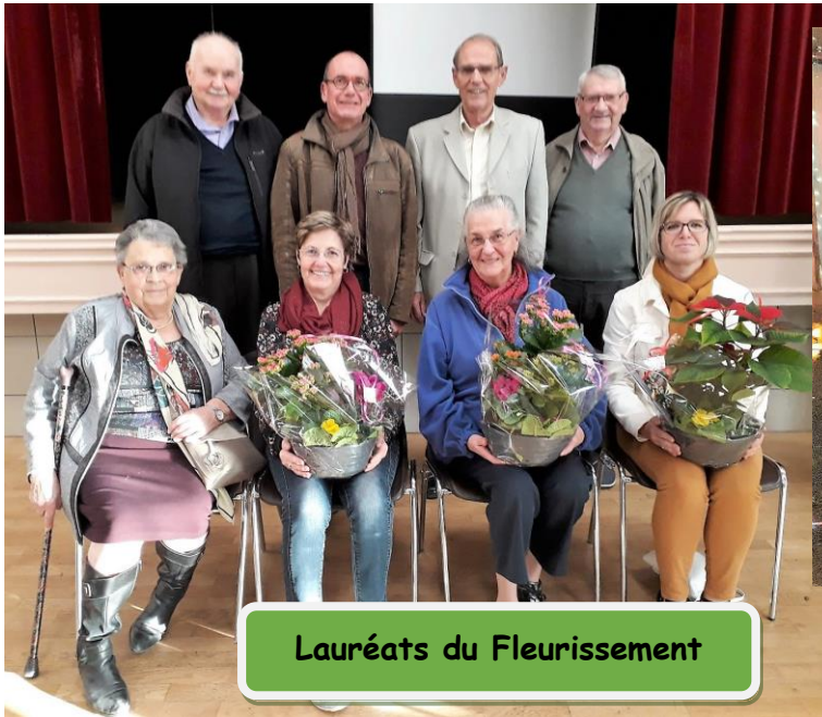
Lauréats du Fleurissement