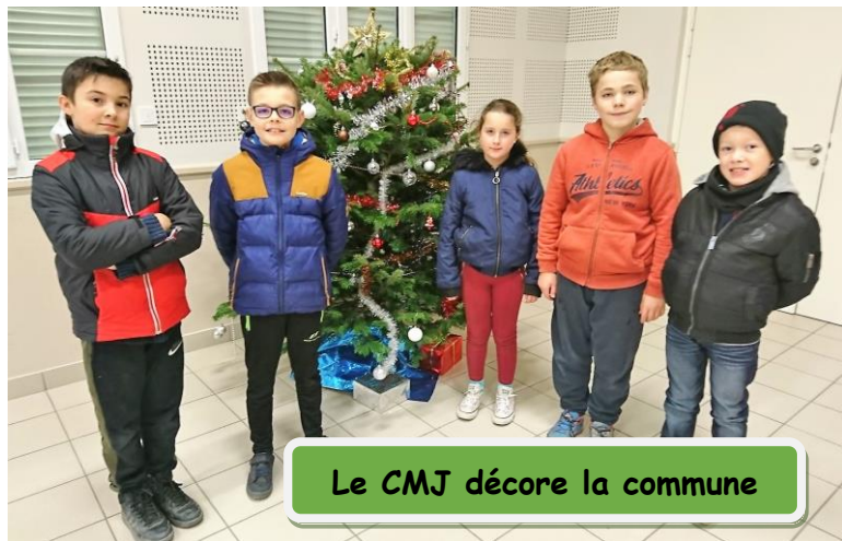
Le CMJ décore la commune