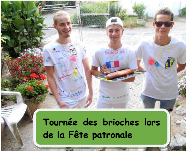
Tournée des brioches lors de la Fête patronale