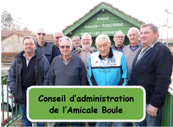
Conseil d'administration de l'Amicale Boule