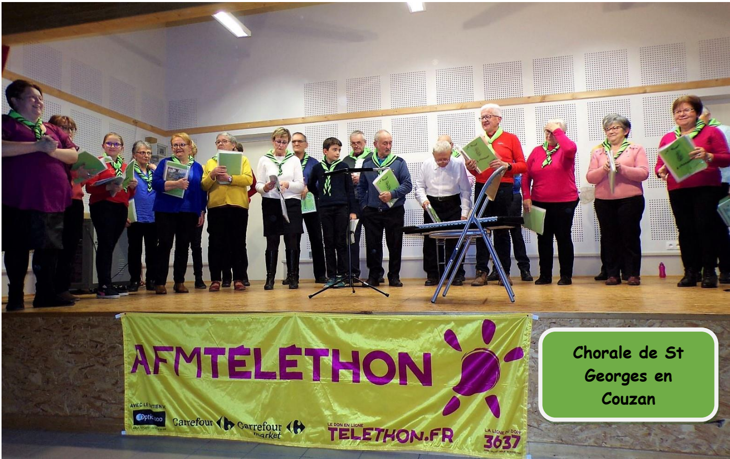
Chorale de St Georges en Couzan