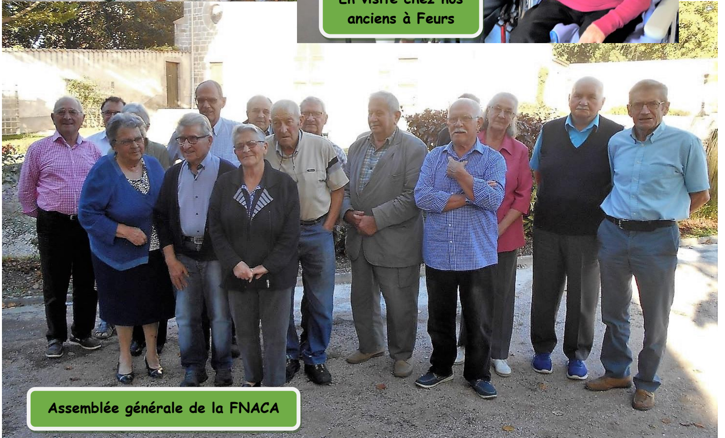
Assemblée générale de la FNACA