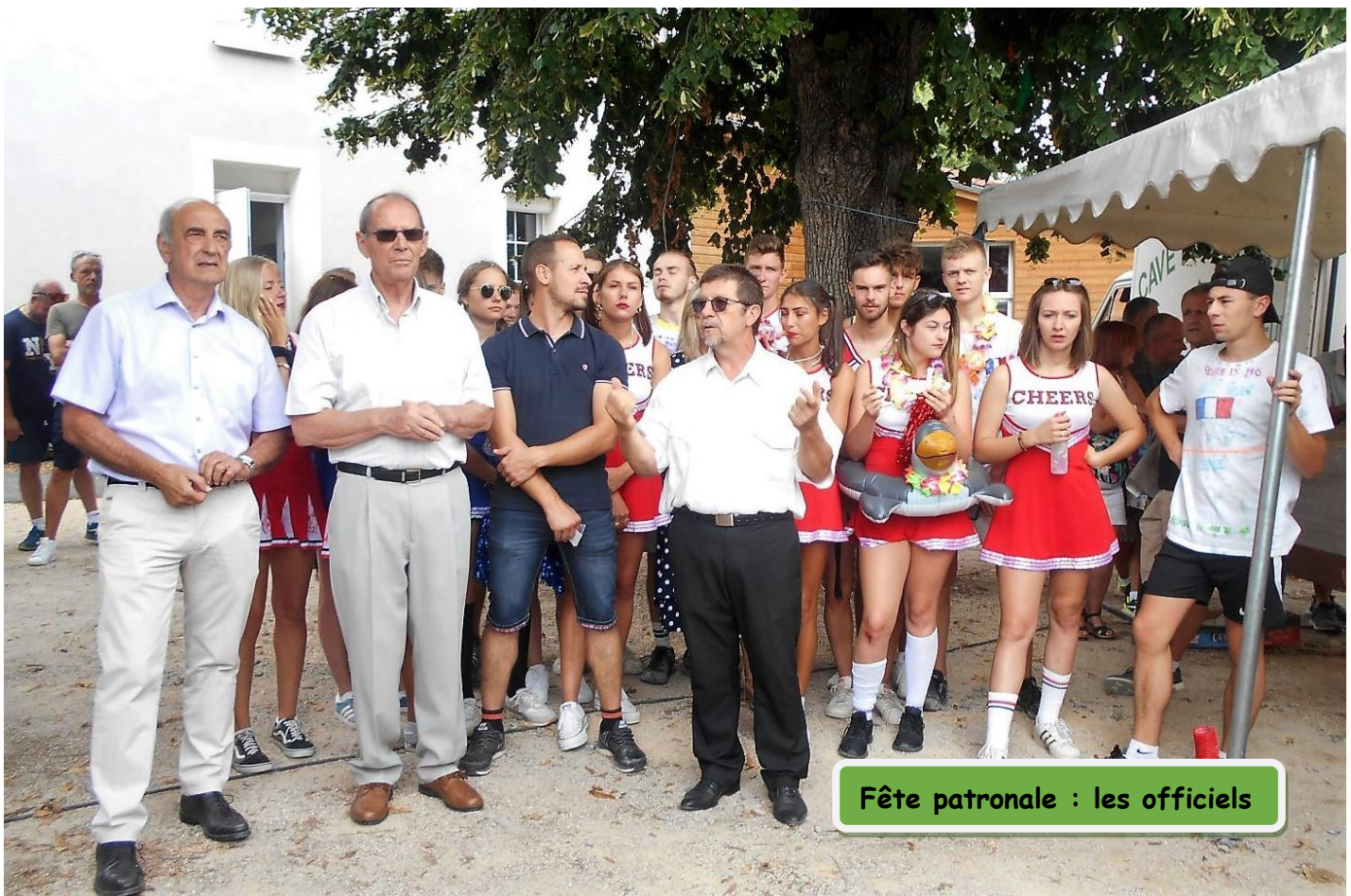
Fête patronale : les officiels