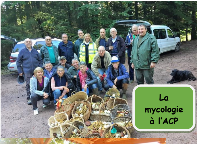
La mycologie à l'ACP