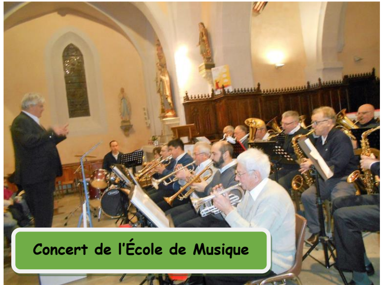
Concert de l'École de Musique