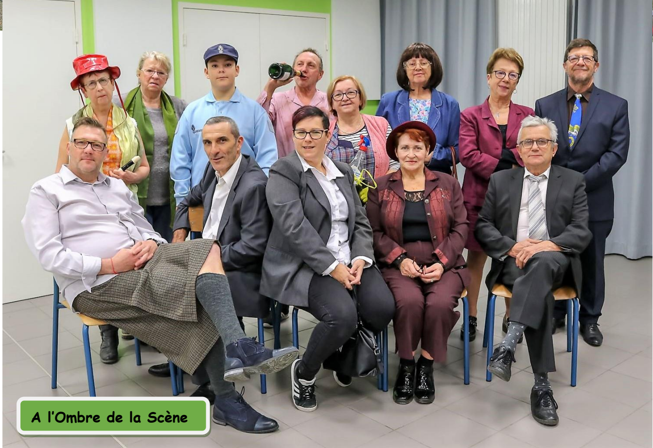
A l'Ombre de la Scène