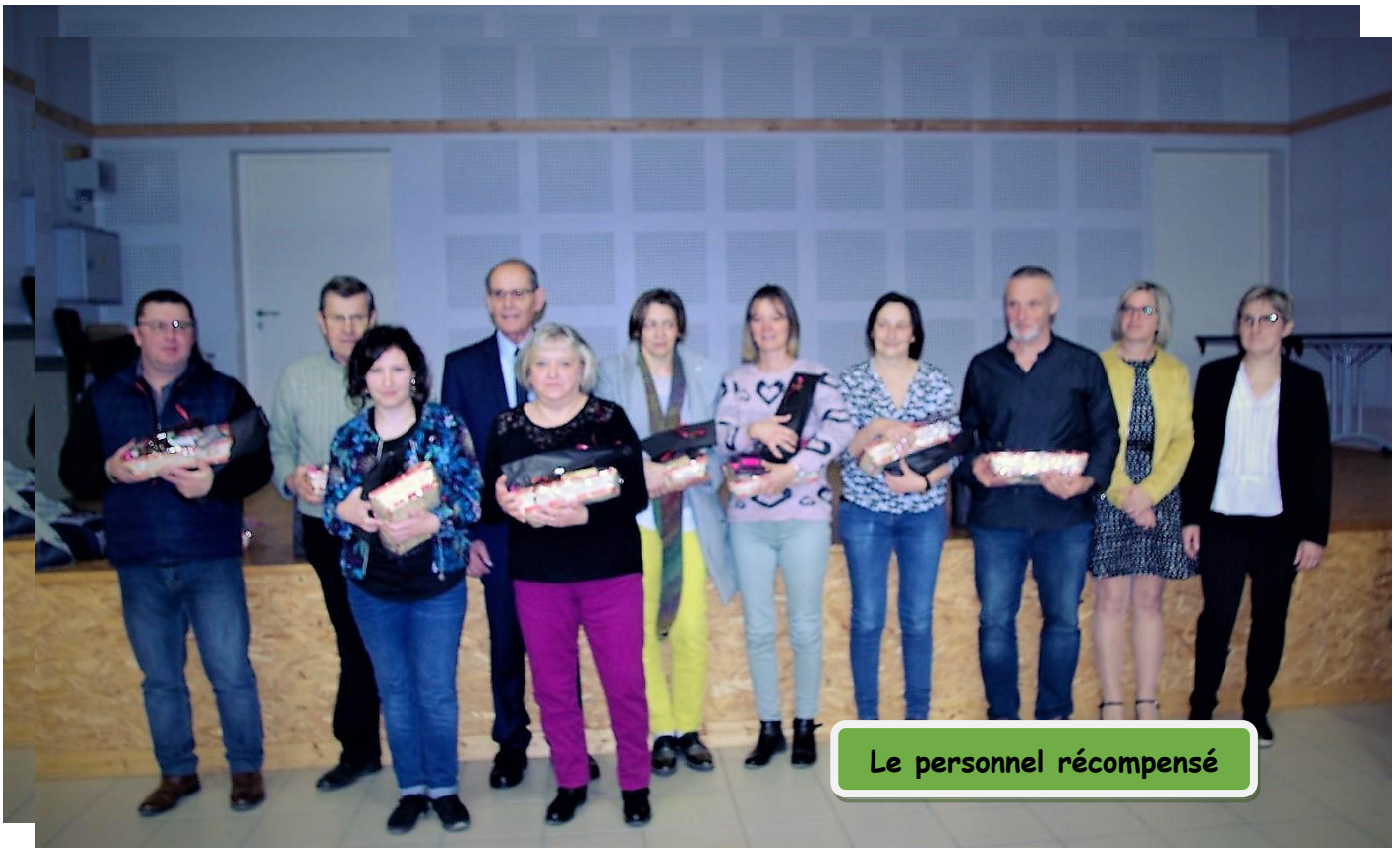
Le personnel récompensé