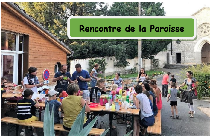
Rencontre de la Paroisse