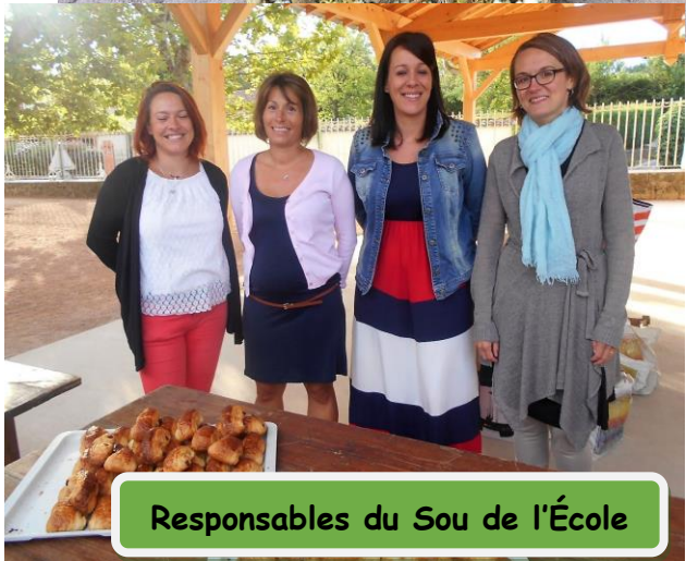
Responsables du Sou de l'École