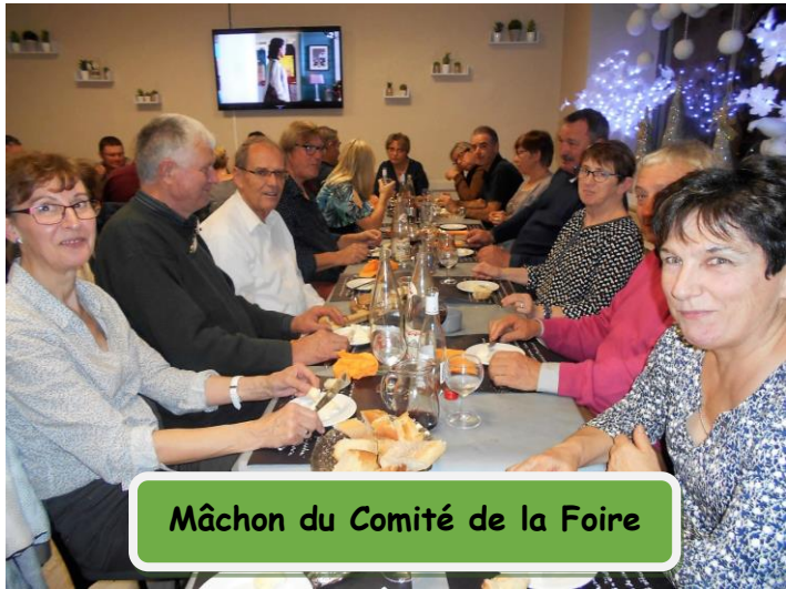
Mâchon du Comité de la Foire