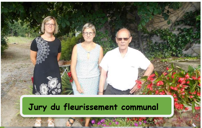
Jury du fleurissement communal