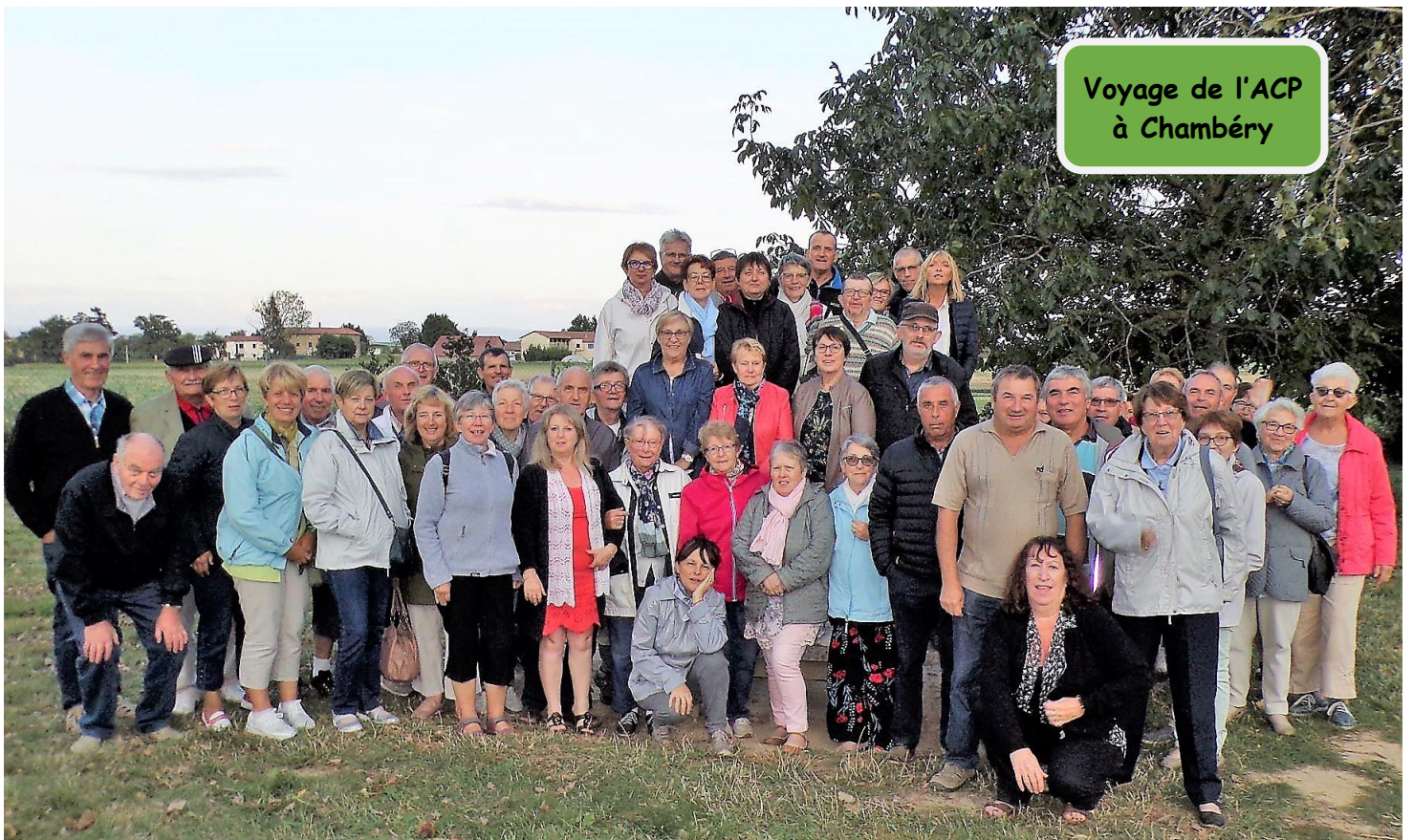
Voyage de l'ACP à Chambéry