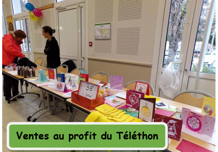
Ventes au profit du Téléthon