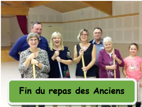
Fin du repas des Anciens