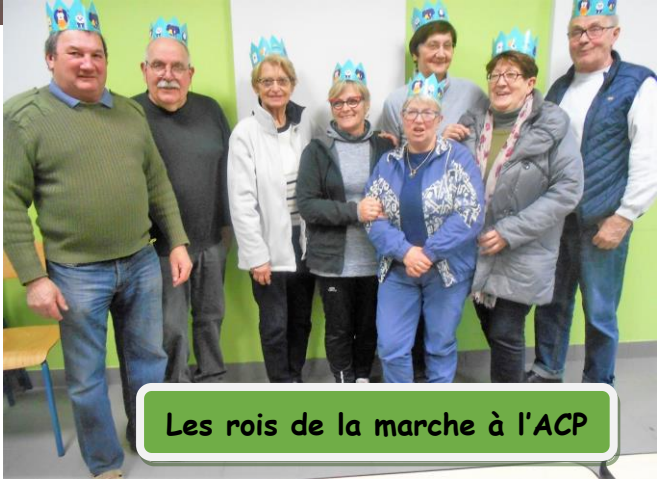
Les rois de la marche à l'ACP