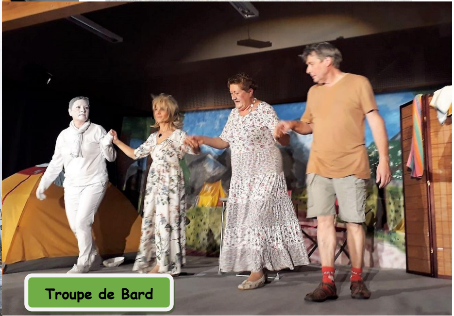
Troupe de Bard