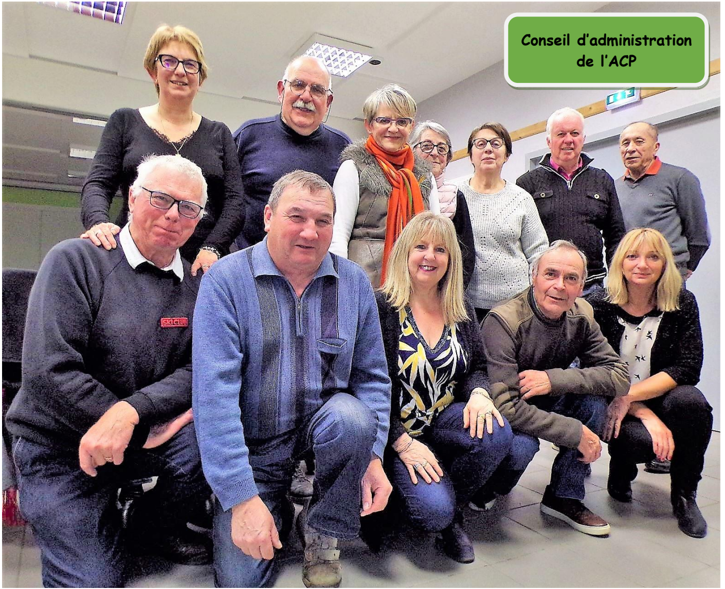
Conseil d'administration de l'ACP