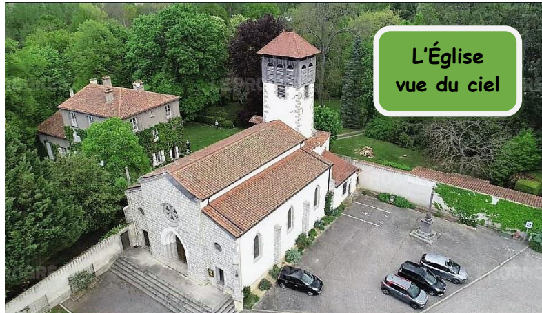
L'Église vue du ciel