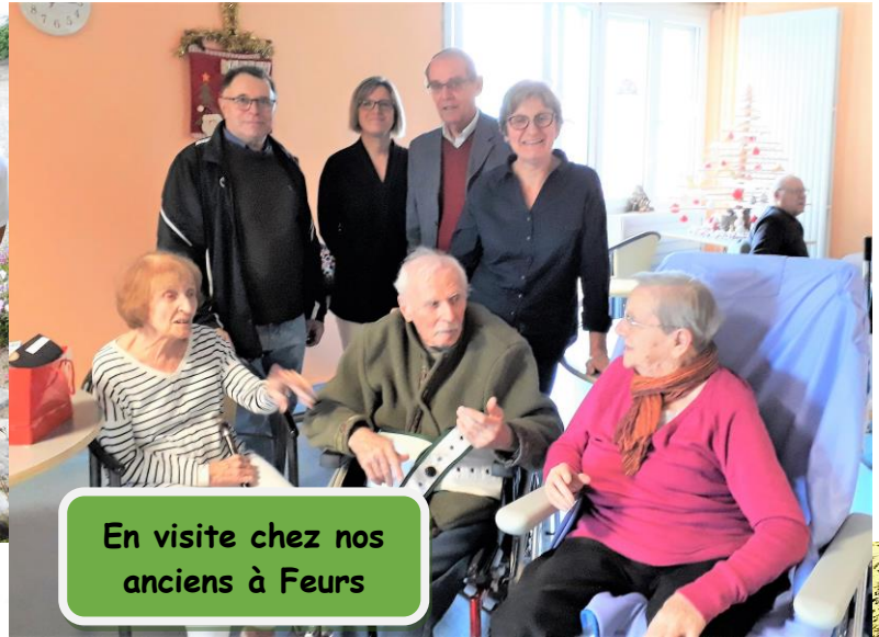
En visite chez nos anciens à Feurs