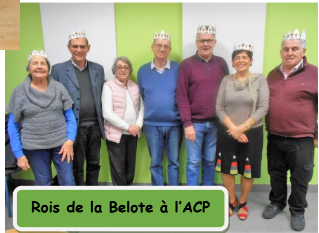
Rois de la Belote à l'ACP