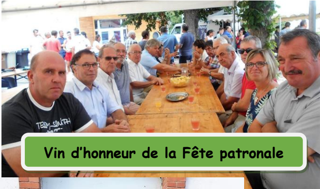
Vin d'honneur de la Fête patronale