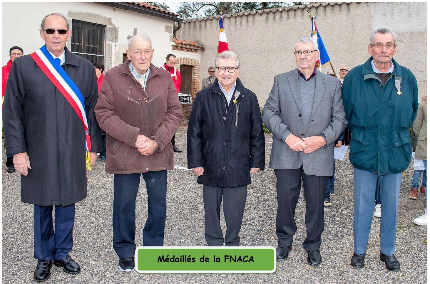
Médillés de la FNACA