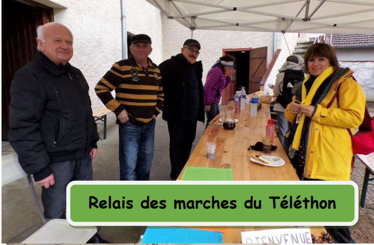
Relais des marches du Téléthon