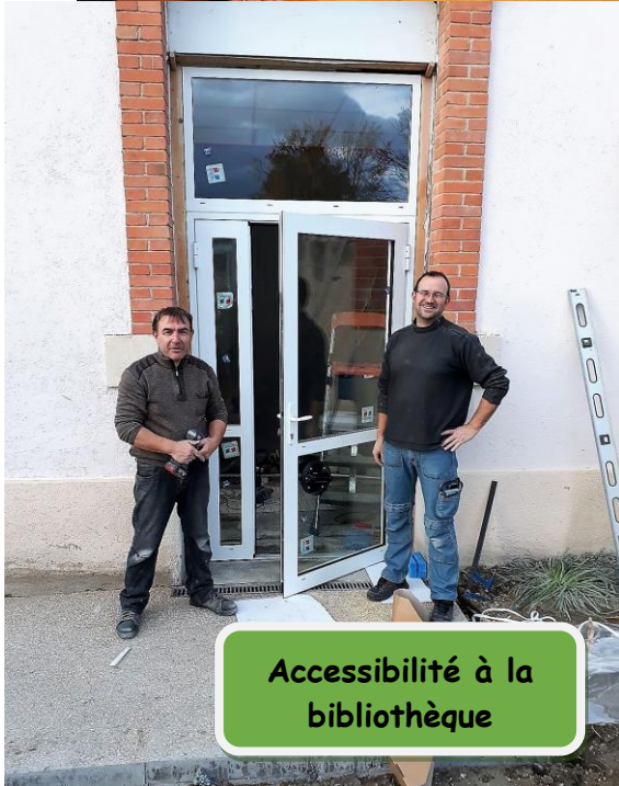
Accessibilité à la bibliothèque