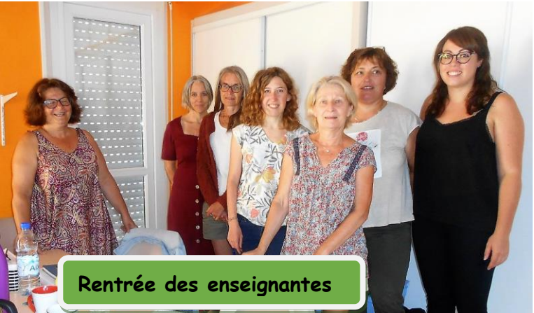
Rentrée des enseignantes