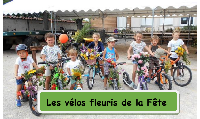
Les vélos fleuris de la Fête