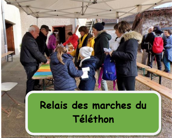
Relais des marches du Téléthon