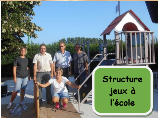
Structure jeux à l'école