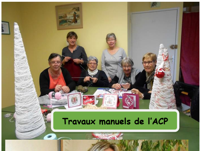
Travaux manuels de l'ACP