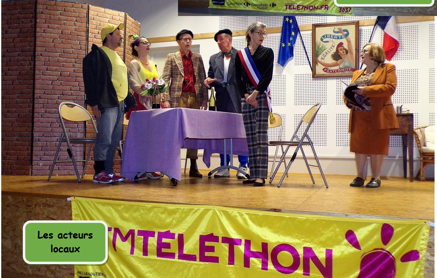
Les acteurs locaux