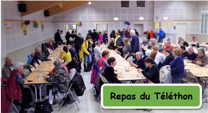
Repas du Téléthon