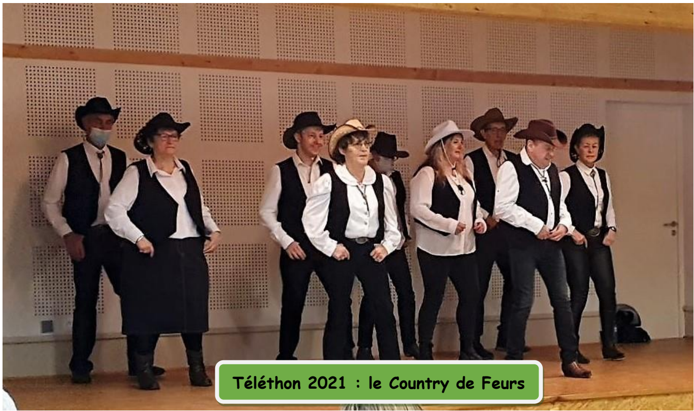
Téléthon 2021 : le Country de Feurs