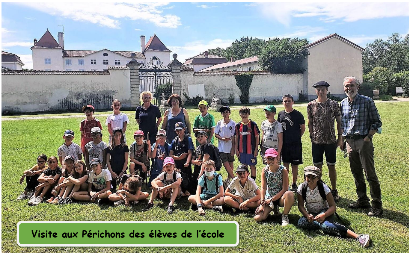
Visite aux Périchons des élèves de l'école