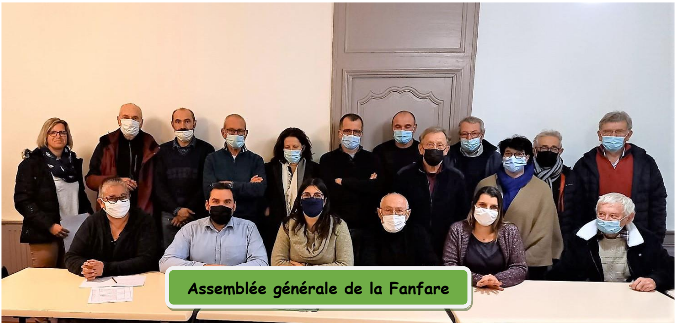
Assemblée générale de la Fanfare