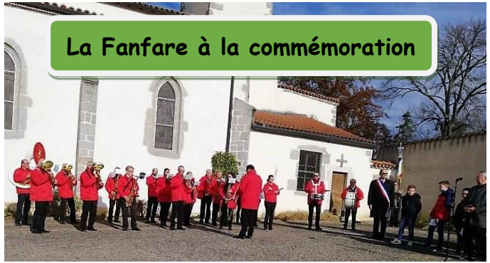
La Fanfare à la commémoration