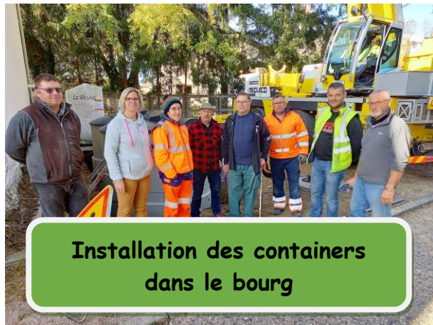
Installation des containers dans le bourg