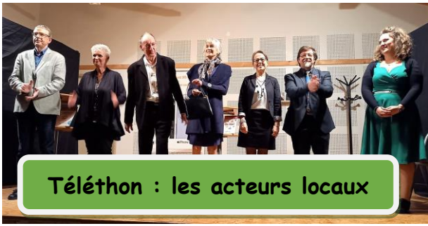
Téléthon : les acteurs locaux