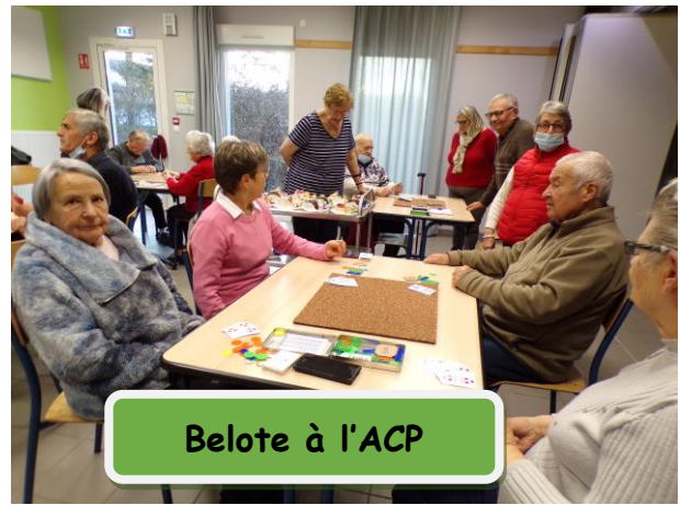
Belote à l'ACP