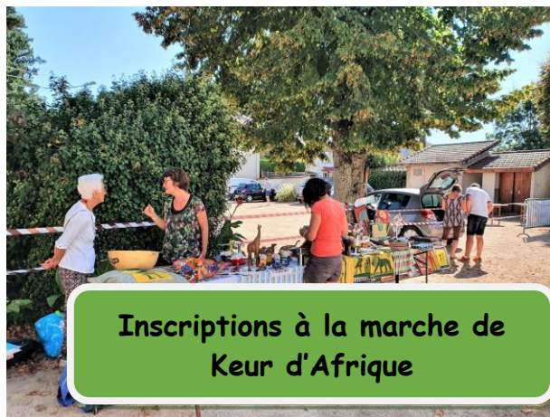
Inscriptions à la marche de Keur d'Afrique