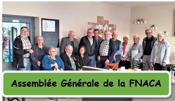
Assemblée Générale de la FNACA