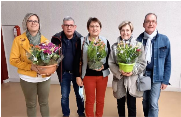
Récompensés du fleurissement de Nature et Patrimoine