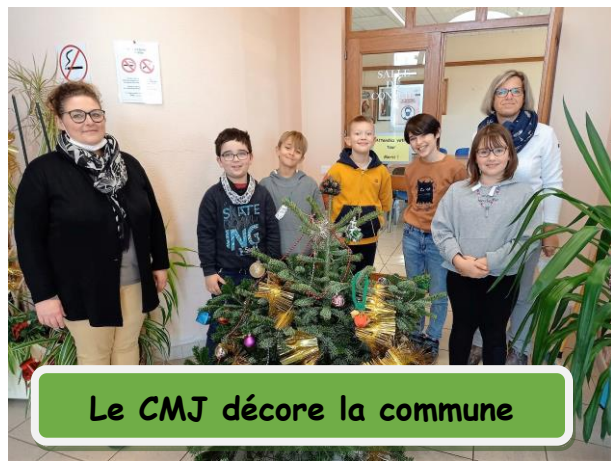
Le CMJ décore la commune