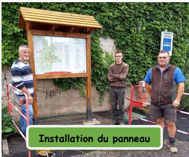
Installation du panneau