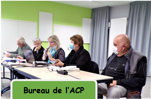
Bureau de l'ACP