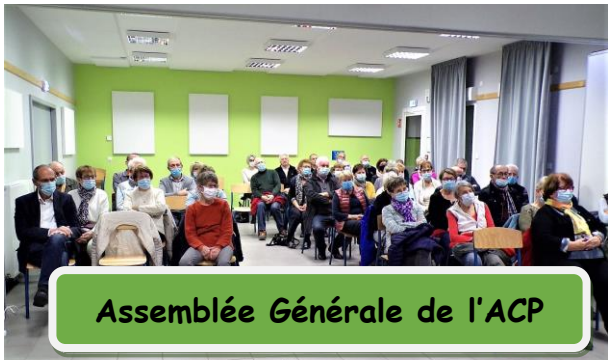
Assemblée Générale de l'ACP