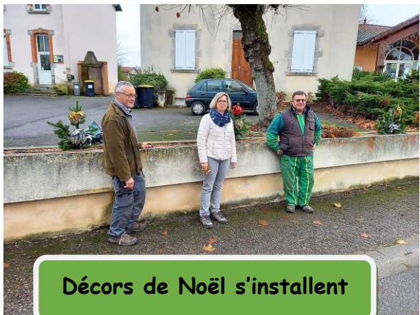
Décor de Noël s'installent