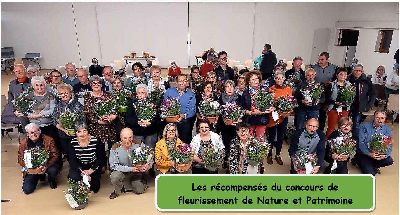
Les récompensés du concours de fleurissement de Nature et Patrimoine