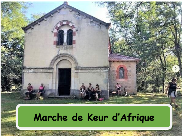
Marche de Keur d'Afrique