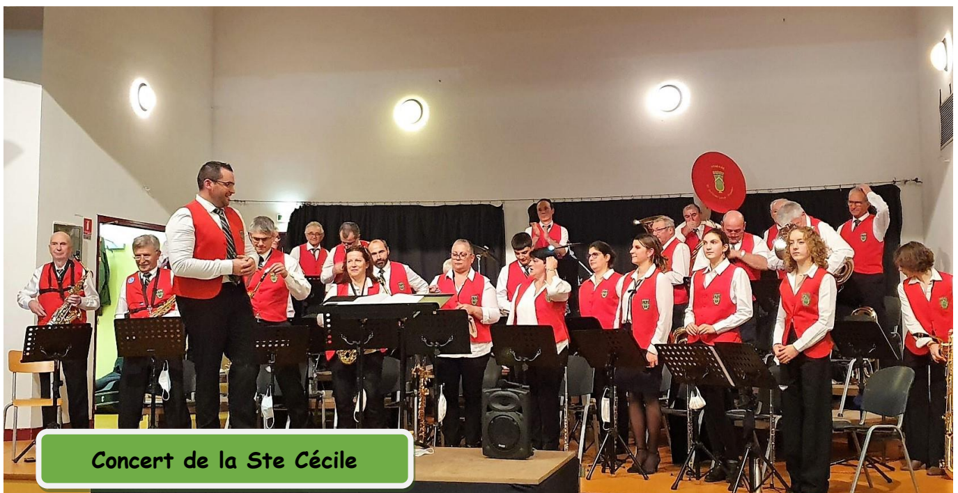
Concert de la Ste Cécile