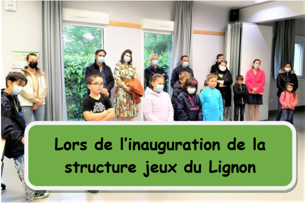
Lors de l'inauguration de la structure jeux du Lignon