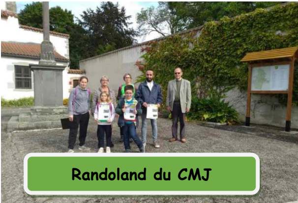
Randoland du CMJ