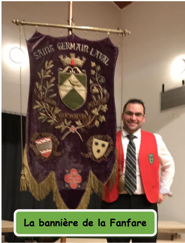
La bannière de la Fanfare