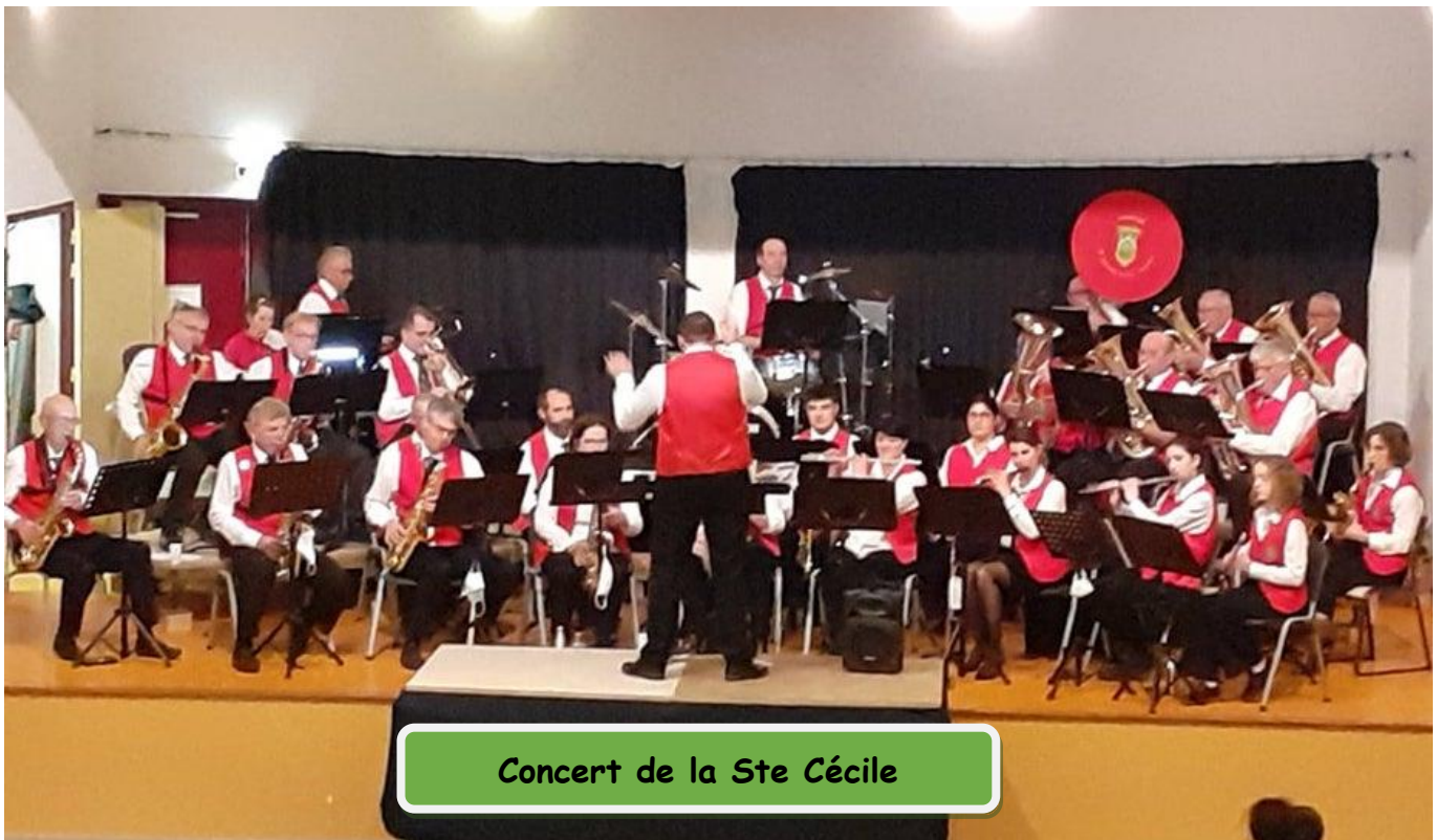
Concert de la Ste Cécile