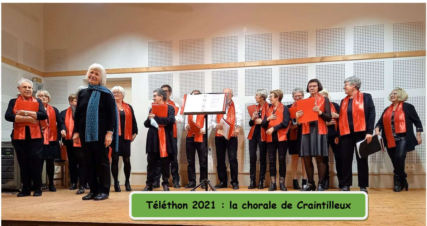
Téléthon 2021 : la chorale de Craitilleux