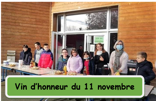
Vin d'honneur du 11 novembre