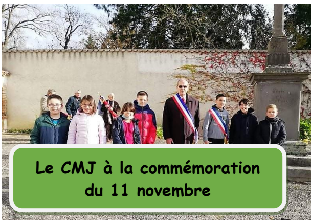
Le CMJ à la commémoration du 11 novembre