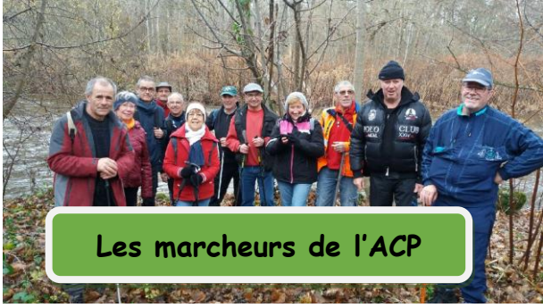
Les marcheurs de l'ACP