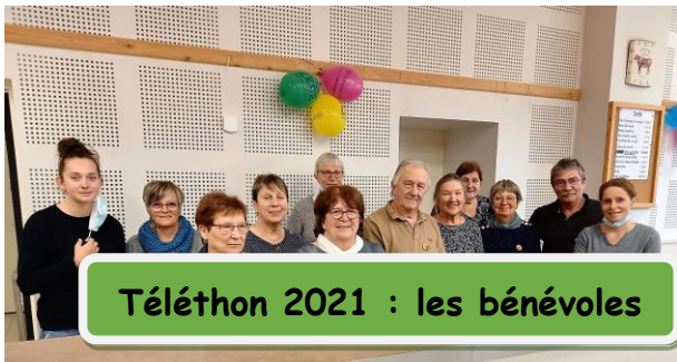
Téléthon 2021 : les bénévoles