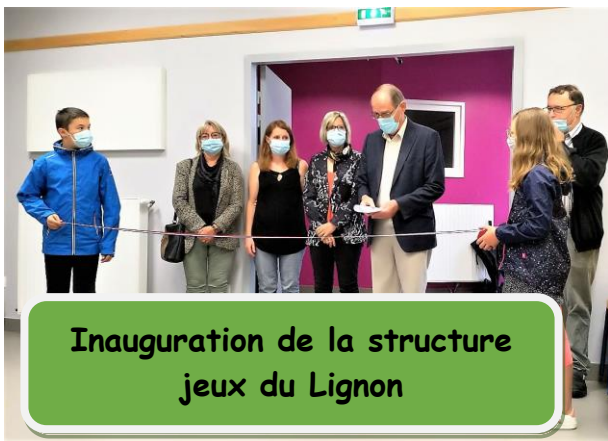
Inauguration de la structure jeux du Lignon