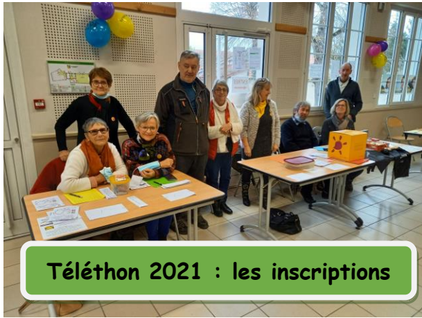
Téléthon 2021 : les inscriptions