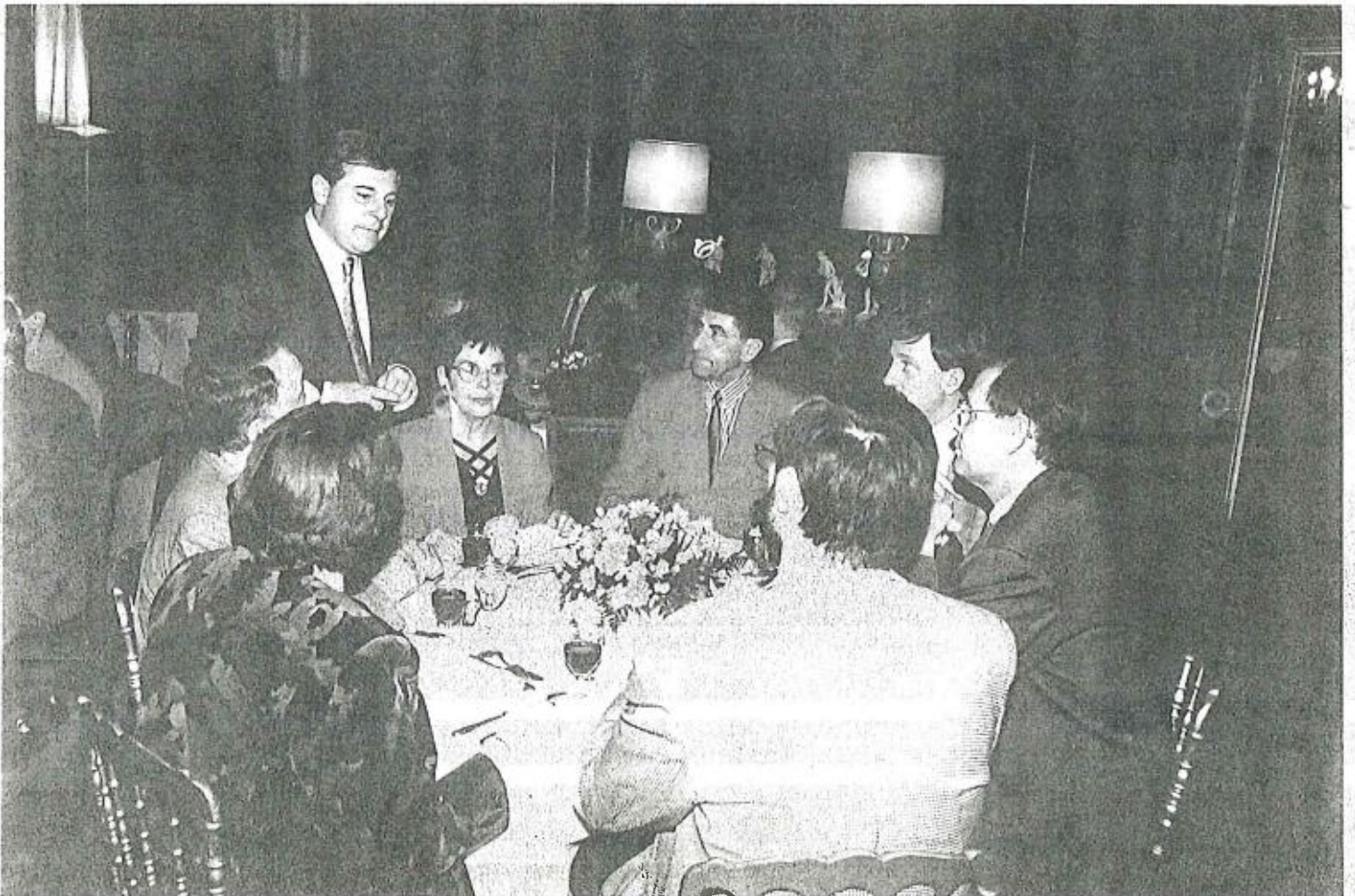
Réception chez Monsieur le Ministre Pascal CLEMENT lors du Congrès des Maires en novembre 1993