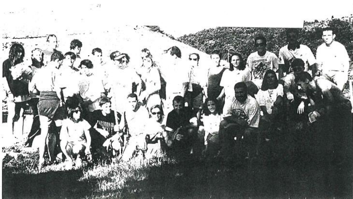
LE JACKY'S CLUB EN ARDECHE

En conclusion, le Jacky's Club remercie toutes les personnes qui ont apporté leur contribution pour le bon déroulement de ses manifestations et vous invite par avance à ses actions futures.