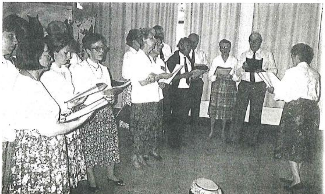
MELODIE Le groupe chant de l'A.C.P.

Pour répondre aux souhaits de nombreux Poncinois, l'A.C.P. organisera en 1995 une exposition sur le thème "Ce que l'on fait à Poncins". Aussi dès maintenant à vos aiguilles, vos crochets, vos pinceaux ! et même vos rabots !