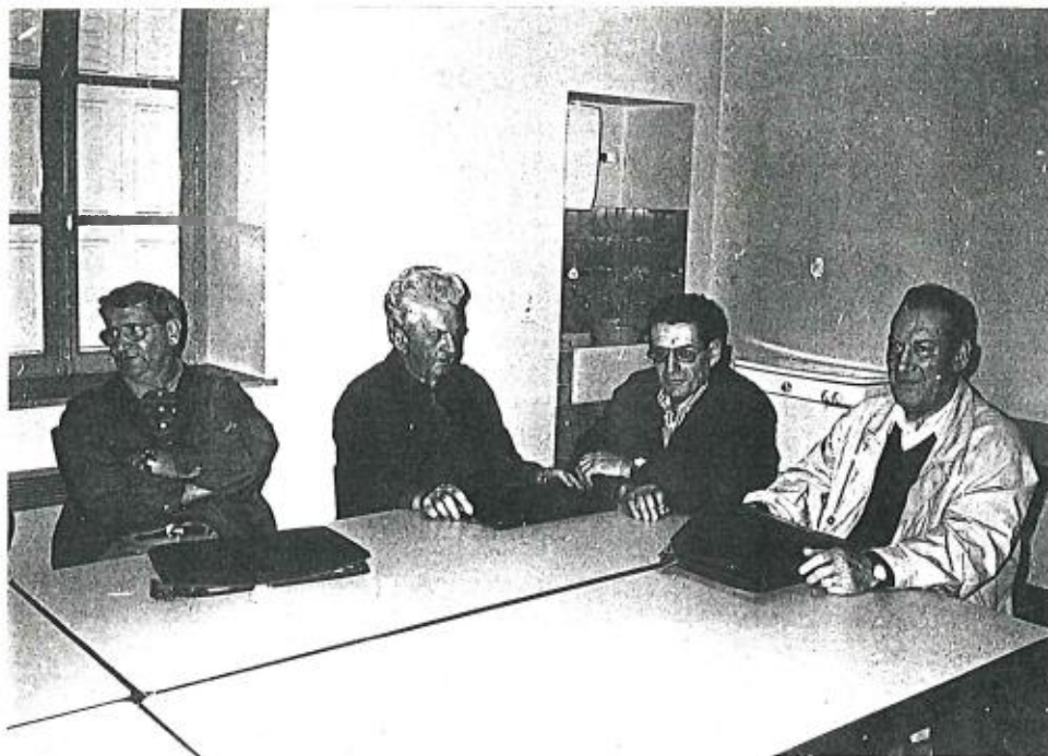
A l'heure de la réflexion