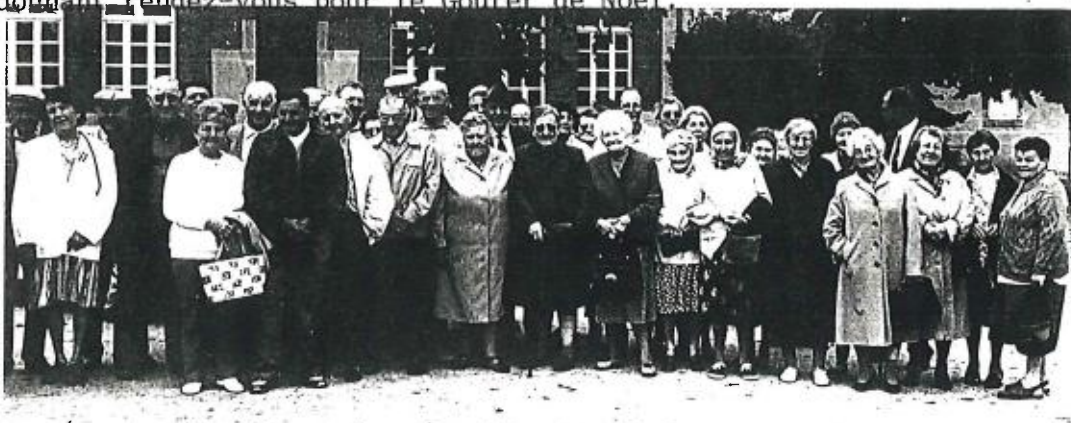
Une partie du groupe des Anciens avant le départ

L'heure du retour arriva trop vite et tout le monde se sépara dans la bonne humeur en se donnant rendez-vous pour le Goûter de Noël.