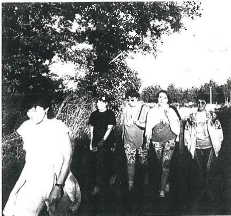
La marche nocture de juin 1994