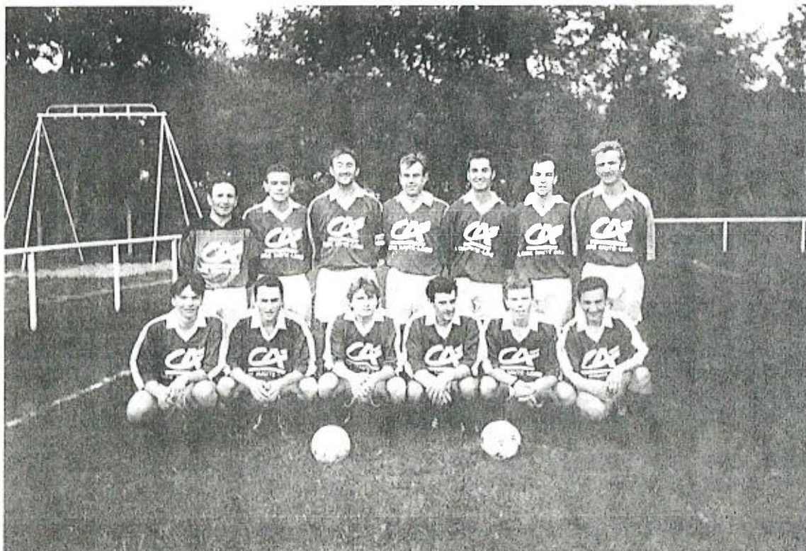
F.C.P. Seniors 1 en tête du Championnat