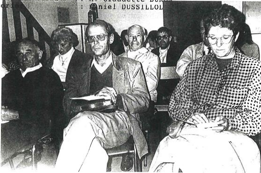
UNE ASSEMBLEE ATTENTIVE

Puis, l'assemblée procéda à la révision des diverses commissions et à l'élaboration du calendrier de la saison prochaine, à savoir :