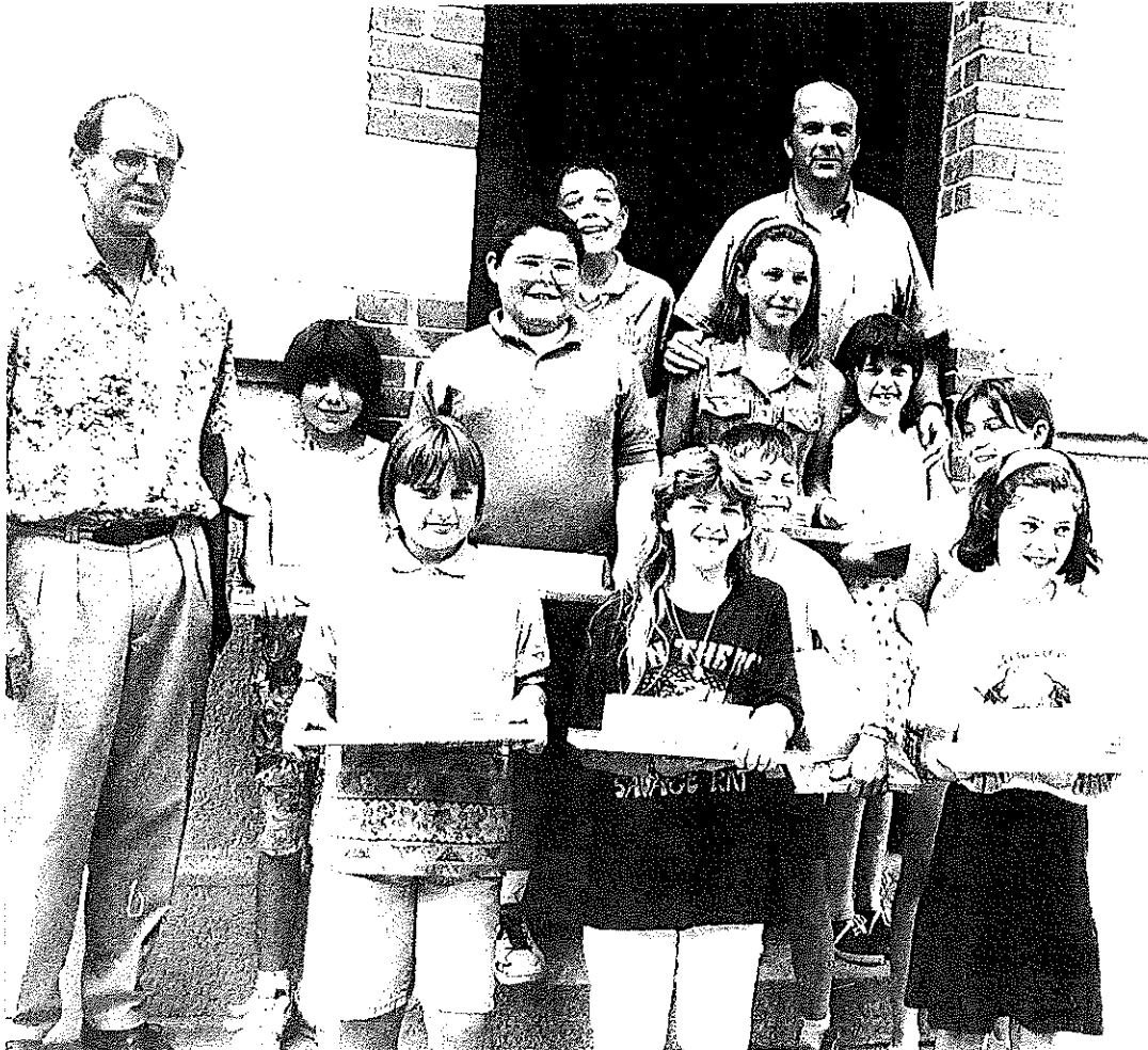
LES ELEVES DE CM2