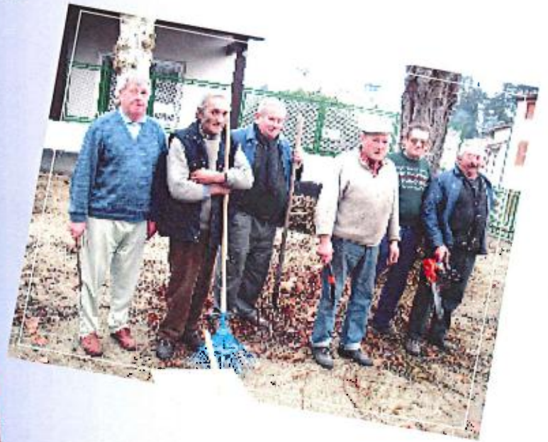
Amicale Boule Poncinoise