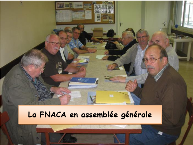
La FNACA en assemblée générale