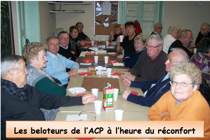
Les beloteurs de l'ACP à l'heure du réconfort