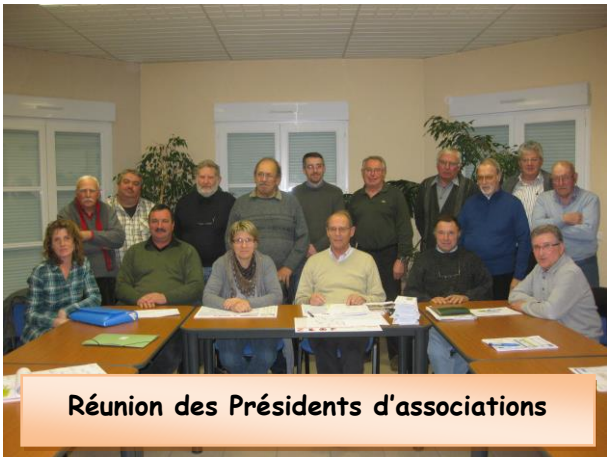
Réunion des Présidents d'associations