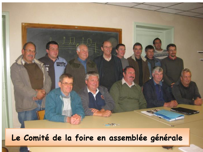
Le Comité de la foire en assemblée générale