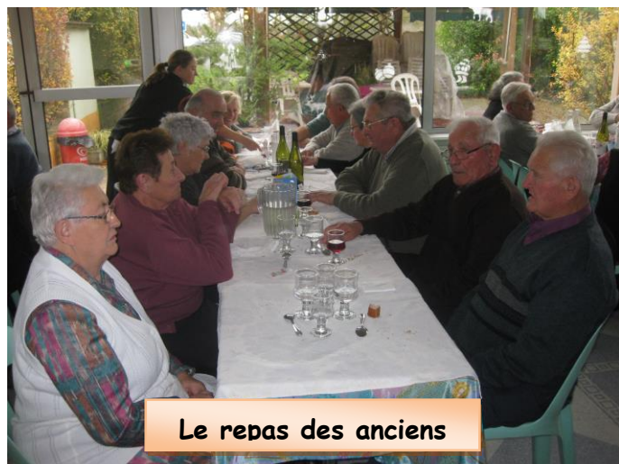
Le repas des anciens