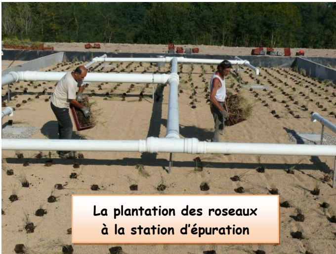
La plantation des roseaux à la station d'épuration