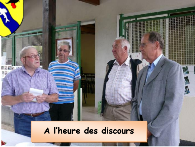
A l'heure des discours