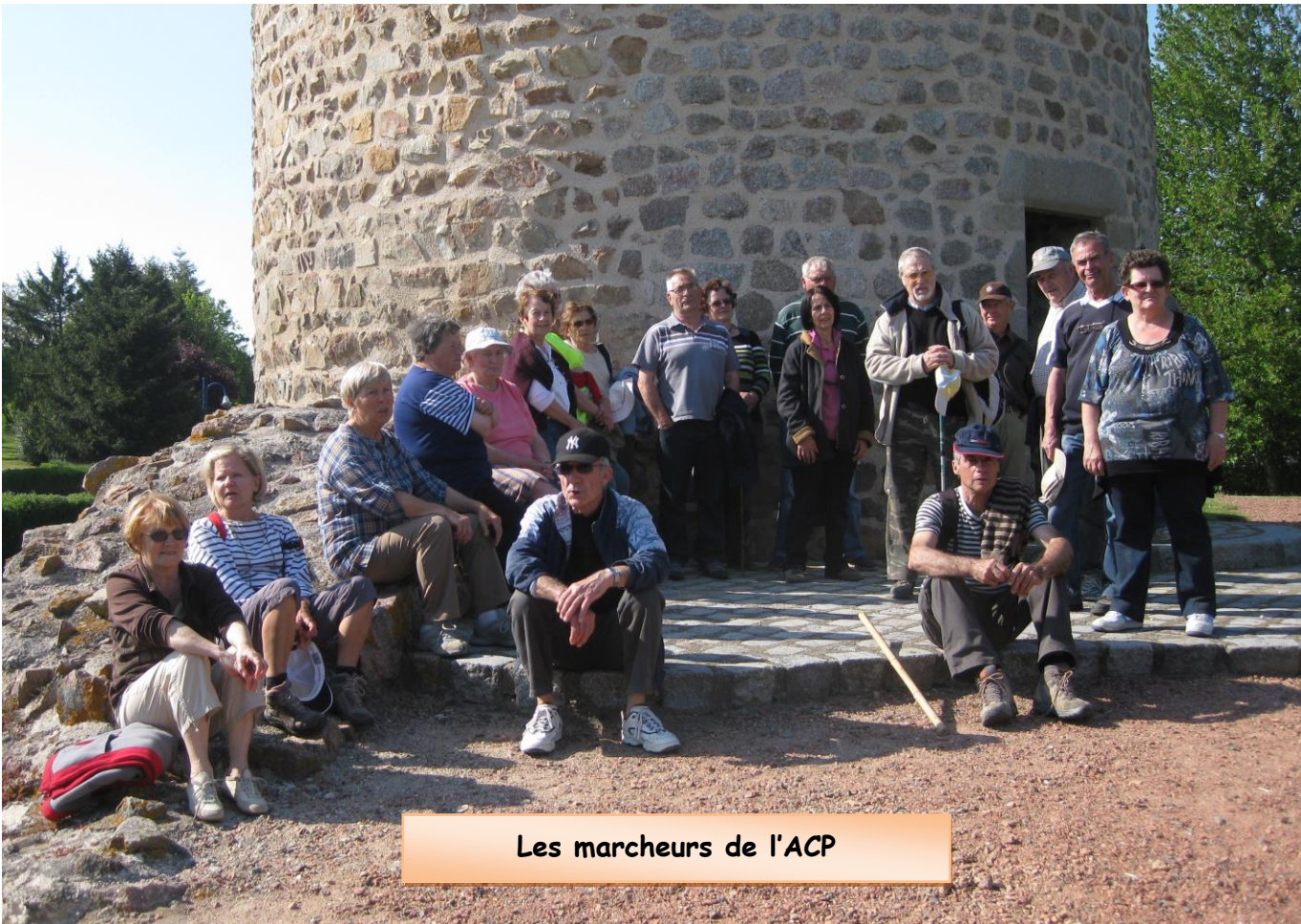
Les marcheurs de l'ACP