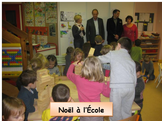
Noël à l'École