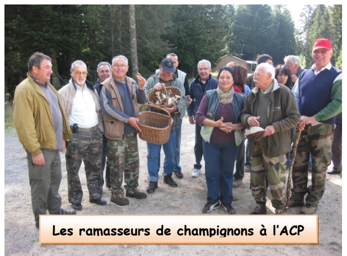
Les ramasseurs de champignons à l'ACP