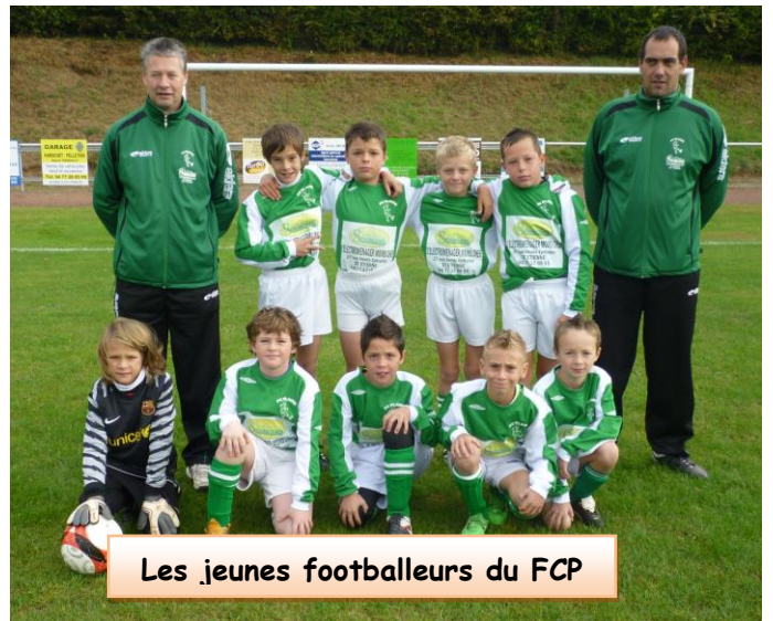
Les jeunes footballeurs du FCP