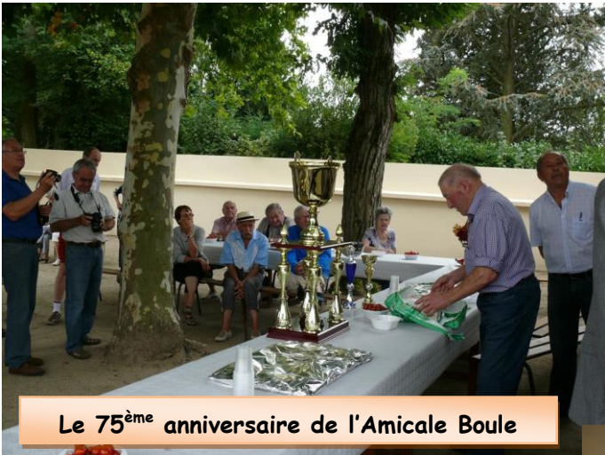
Le 75 ème anniversaire de l'Amicale Boule