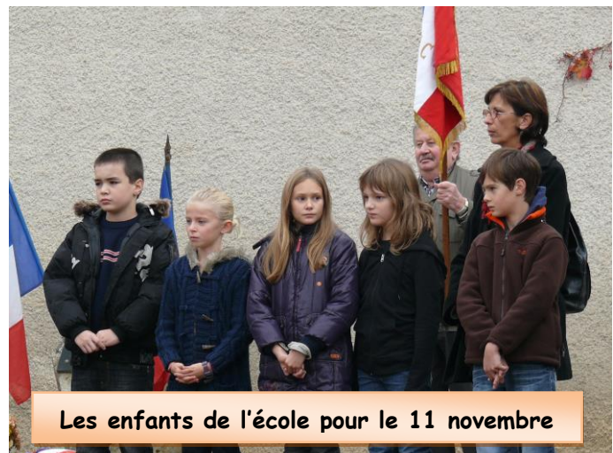
Les enfants de l'école pour le 11 novembre