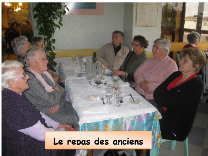
Le repas des anciens