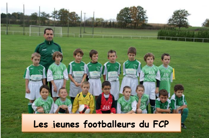
Les jeunes footballeurs du FCP