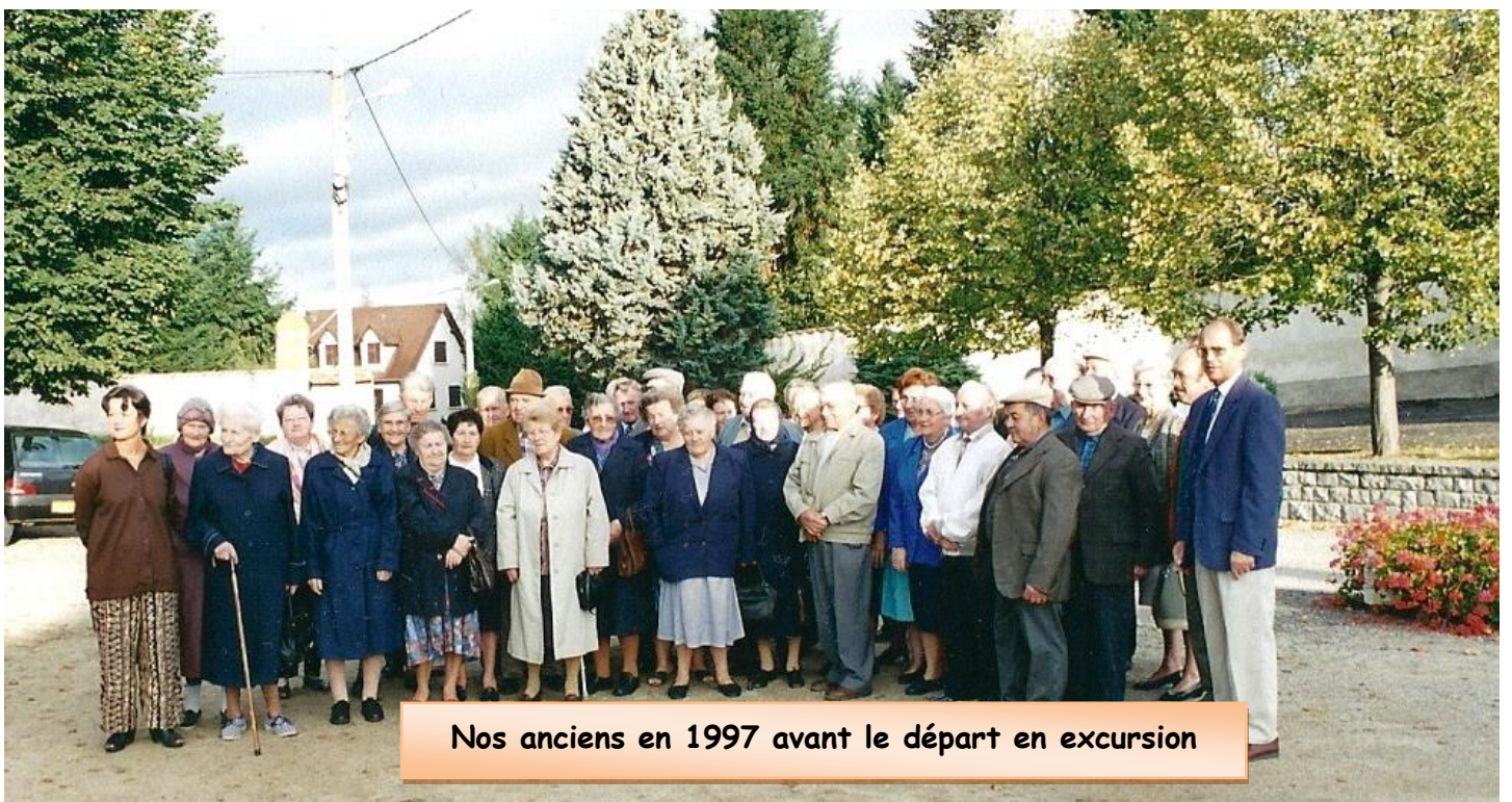
Nos anciens en 1997 avant le départ en excursion