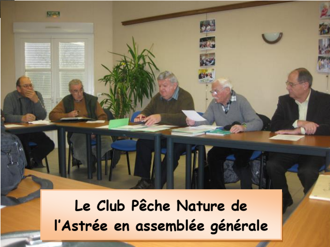
Le Club Pêche Nature de l'Astrée en assemblée générale