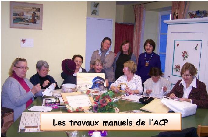
Les travaux manuels de l'ACP