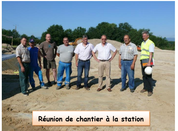
Réunion de chantier à la station