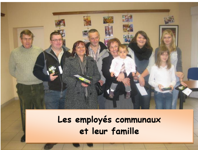
Les employés communaux et leur famille