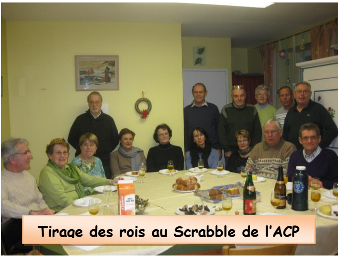
Tirage des rois au Scrabble de l'ACP