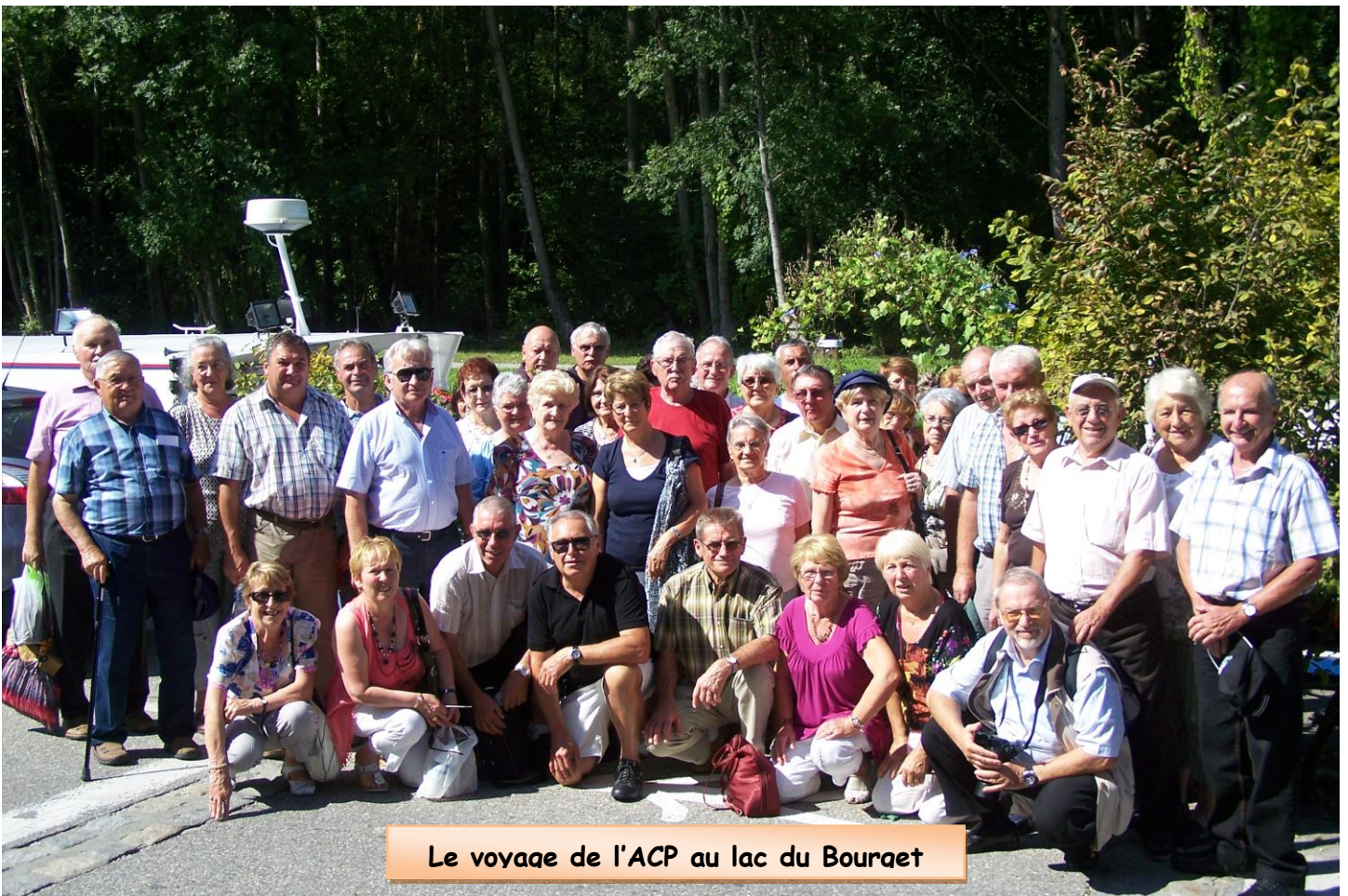
Le voyage de l'ACP au lac du Bourget