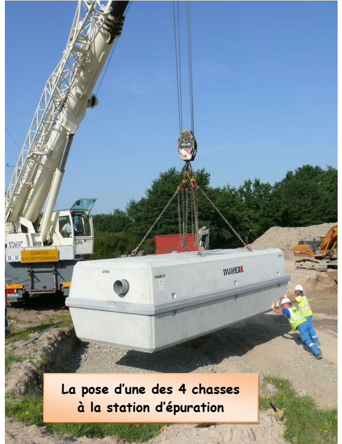
La pose d'une des 4 chasses à la station d'épuration