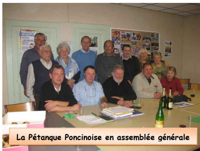
La Pétanque Poncinoise en assemblée générale