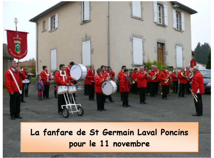
La fanfare de St Germain Laval Poncins pour le 11 novembre