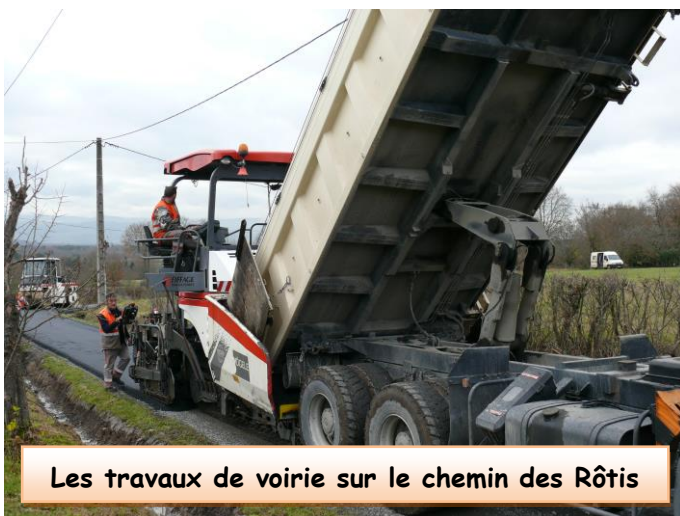
Les travaux de voirie sur le chemin des Rôtis