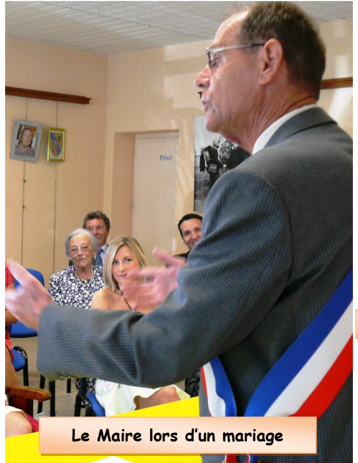
Le Maire lors d'un mariage