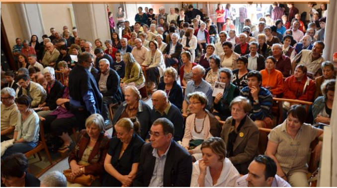
Le public lors du concert de l'Ecole de Musique