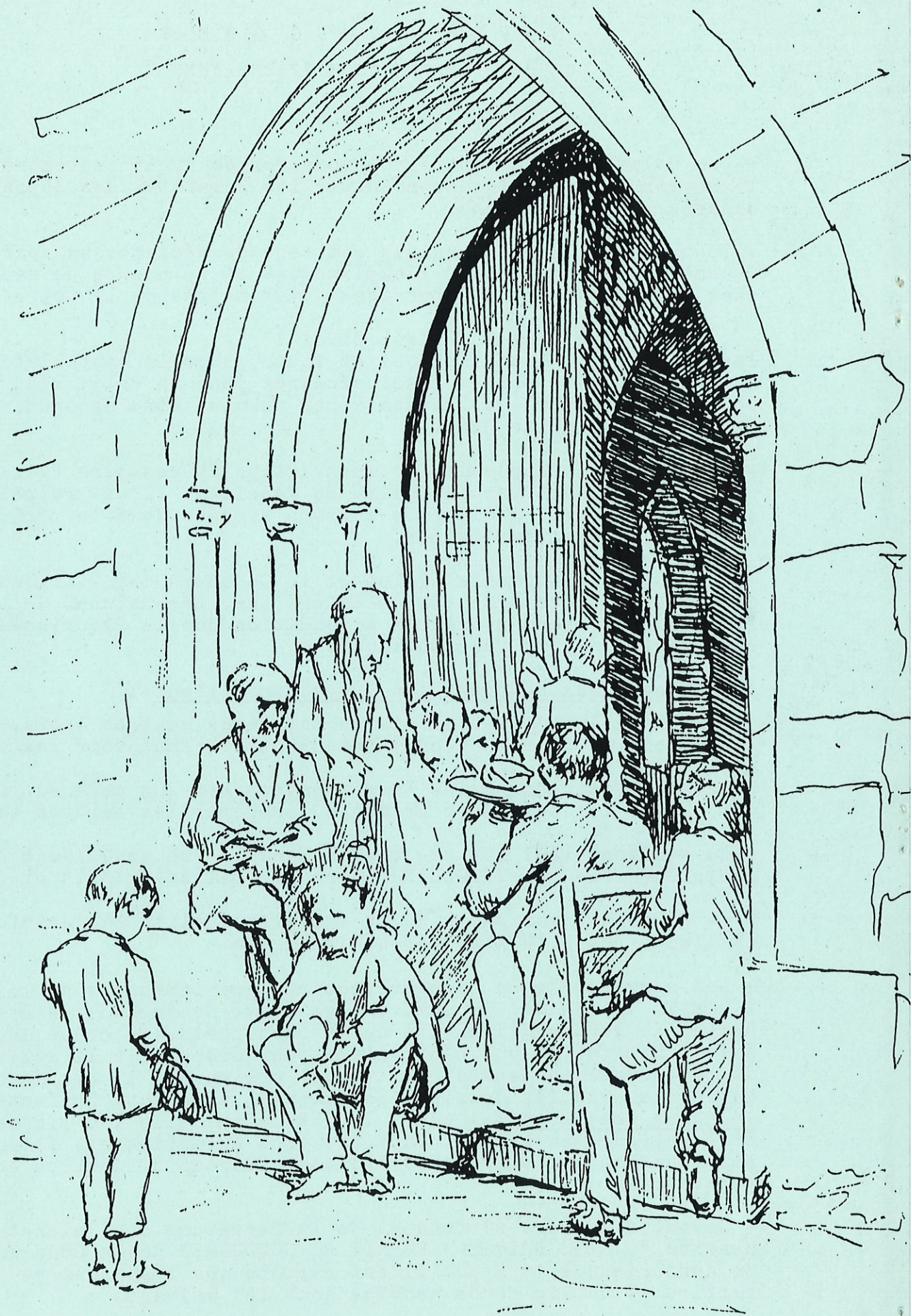
Porche de l'église de Poncins, pendant la messe - 1894 - dessin.