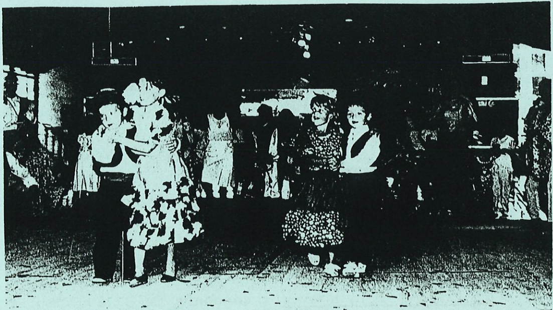
FETE PATRONALE 1985 : DANSES FOLKLORIQUES

Inter Villages : Il se déroulera le Dimanche 29 juin à CHAMBEON avec la participation des communes de CHAMBEON, CLEPPE, MAGNEUX et PONCINS.