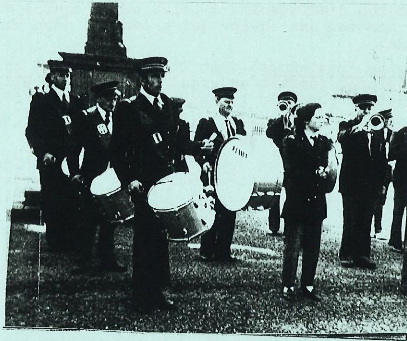
La cérémonie du 8 Mai à Poncins