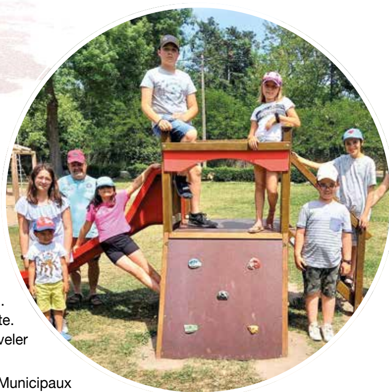
La nouvelle structure de jeux pour les tout-petits

Avec les Conseils Municipaux Jeunes de 4 autres communes (Rozier-en-Donzy, Feurs, Civens et Pouilly-lès-Feurs), nous avons organisé une rencontre inter-CMJ le samedi 11 juin à Poncins. Cette année, ils ont souhaité accueillir des familles ukrainiennes réfugiées dans les environs de Feurs. Quelques familles ukrainiennes ont répondu à l'invitation. Nous avons le plaisir d'être accompagnés d'une traductrice pour pouvoir échanger avec eux. Ce fut une journée émouvante. Ils ont dansé, joué de la musique et passé un bon moment de soutien.