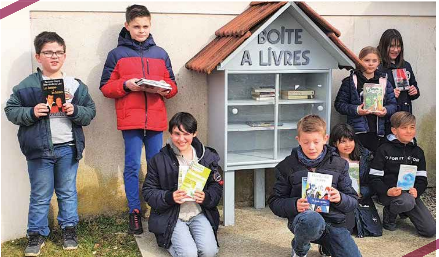
Les élus devant la boîte à livres