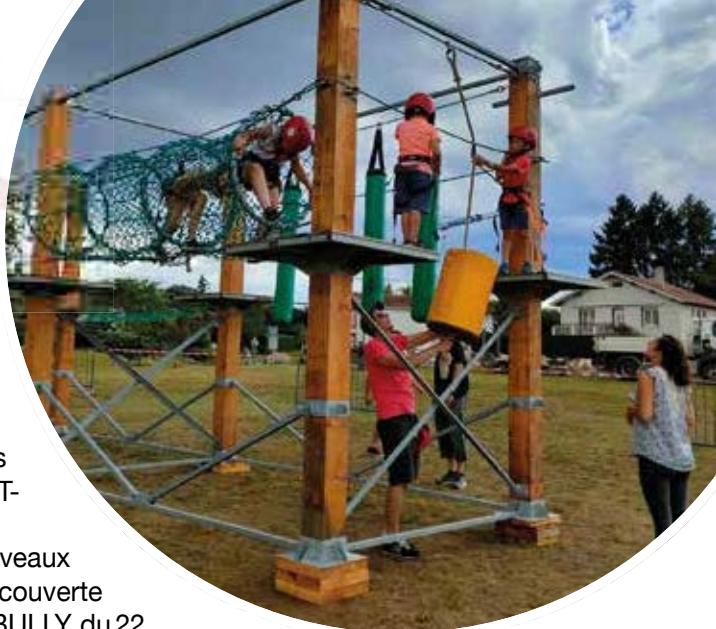
Kermesse : structure d'accrobranche

Nous communiquons essentiellement par mail, donc si vous souhaitez échanger avec nous c'est par ici : soudesecolesponcins@gmail.com