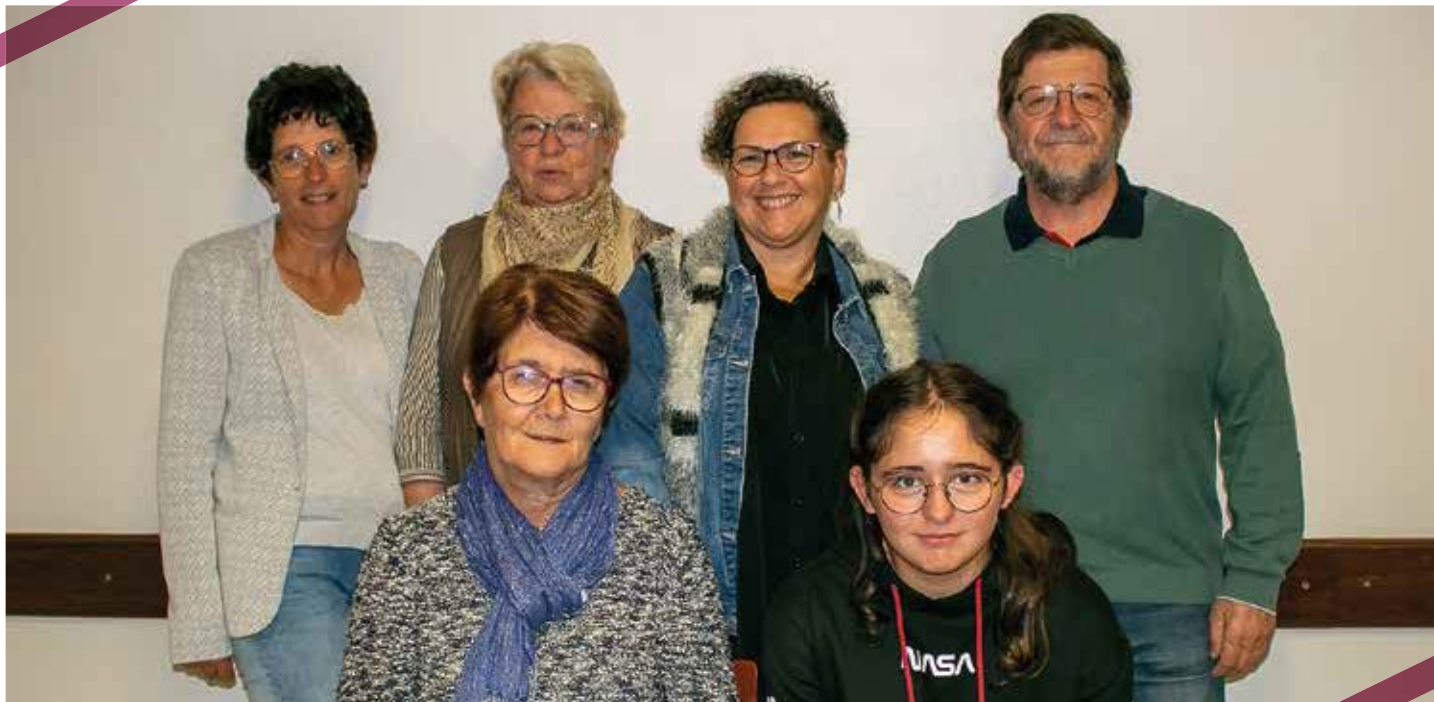
Les acteurs de l'ombre de la scène