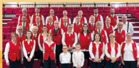
Les musiciens de la fanfare

Nous avons effectué les traditionnelles commémorations dans les communes de Saint Germain Laval et Poncins.