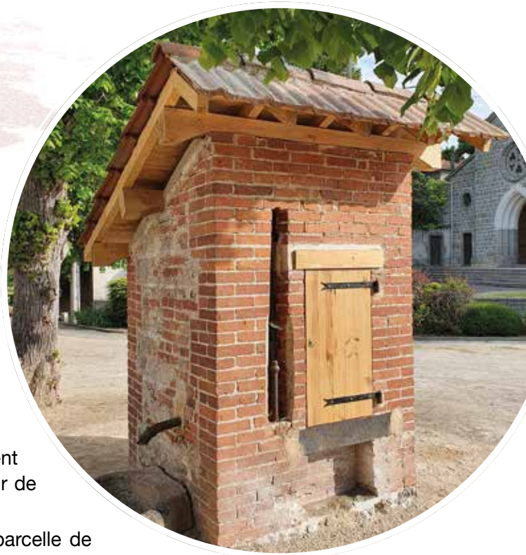
Restauration du puits , place du 19 mars

afin de diffuser des documents et des diaporamas.