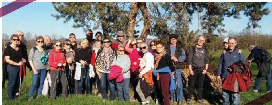
Marche février 2022