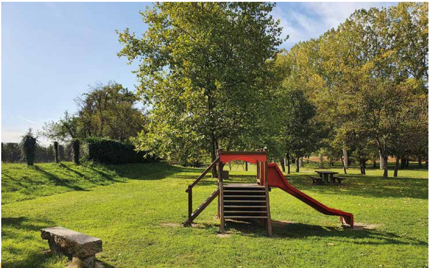
Jeux et bancs vers le Lignon