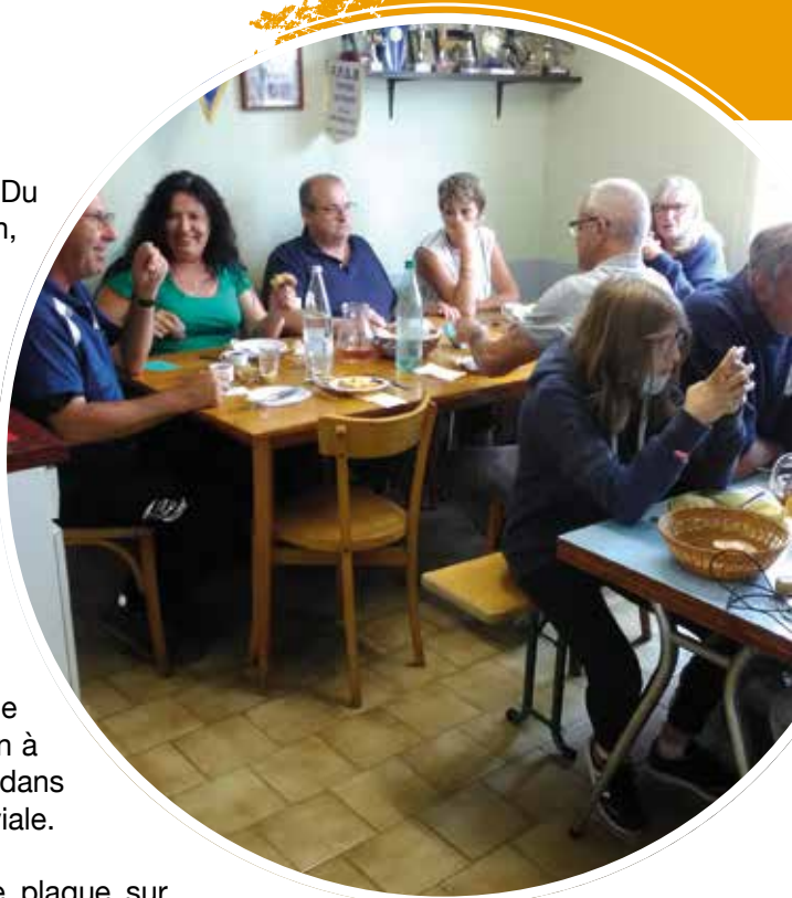
Repas à Chambéon

L'Amicale est ouverte le mardi et le jeudi à 14h, sur demande il est possible d'ouvrir le Samedi. Toutes les personnes désirant faire une partie de