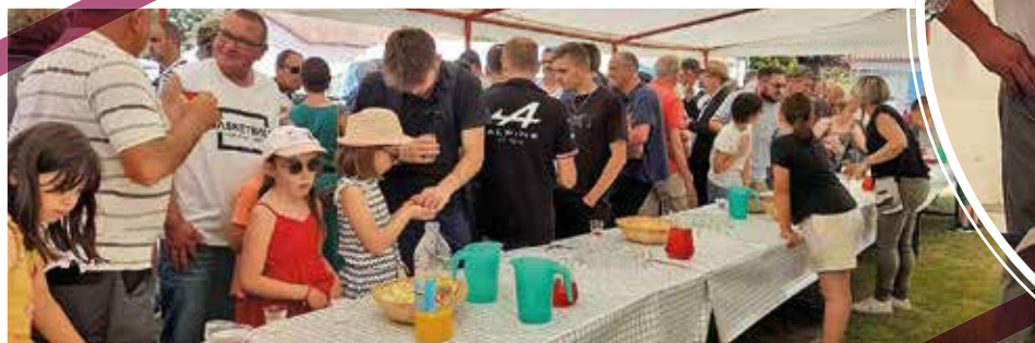
Au vin d'honneur