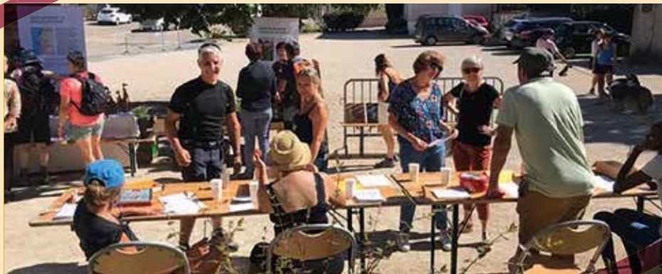
Départ des marcheurs