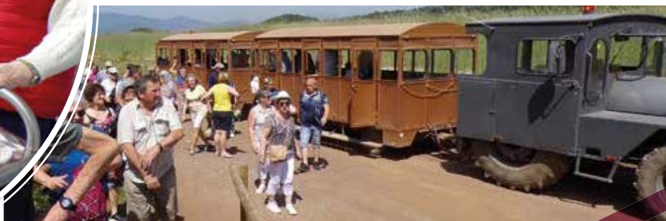
Balade en petit train dans la Garrotxa volcanique