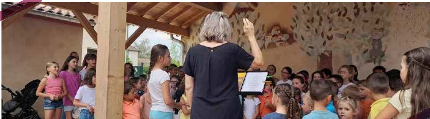
Kermesse : chorale de l'école

Pour suivre nos manifestations, n'hésitez pas à vous abonner à notre page Facebook : https://www.facebook.com/soudesecolesdeponcins