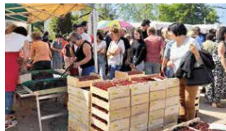
Les stands de cerises, emblème de la Foire

Un mot pour remercier la municipalité, les associations FC Plaine et Sou des Écoles, qui assurent à tour de rôle la partie festive ainsi que tous les membres actifs et bénévoles du comité qui œuvrent au bon déroulement de l'évènement.