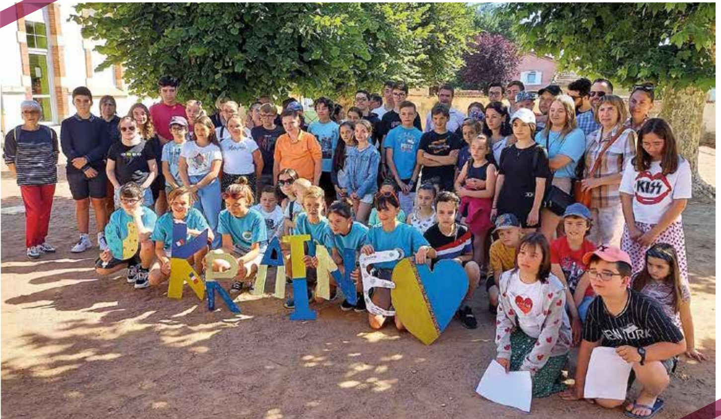
La rencontre Inter CMJ et les familles ukrainiennes