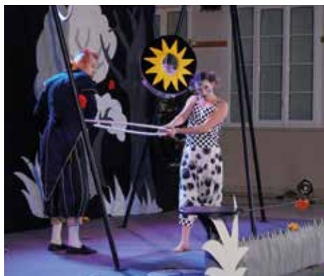
Spectacle de Noël