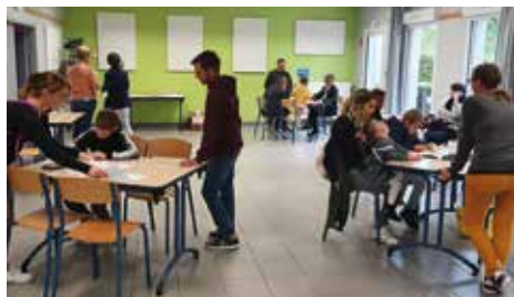
Animation Atelier créatif pour les enfants

La bibliothèque municipale a rouvert ses portes en juin 2022.