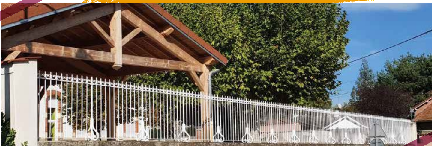
La grille de l'école repeinte