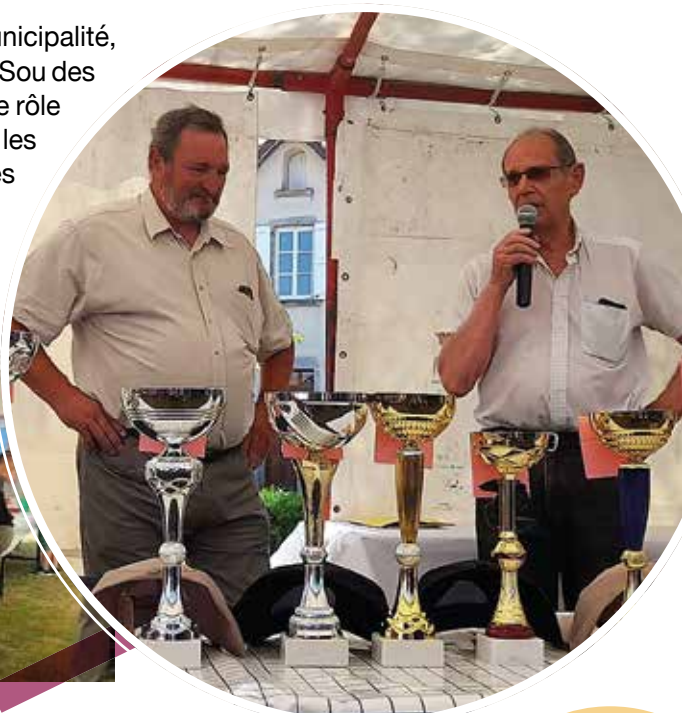
La remise des récompenses