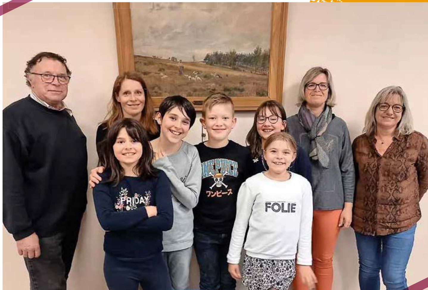
Les jeunes élus préparent le centième anniversaire de la mort de Charles Beauverie