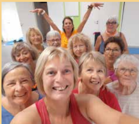
La coach et les adhérentes