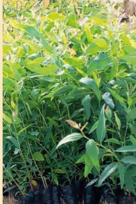
Les plants d'arbres