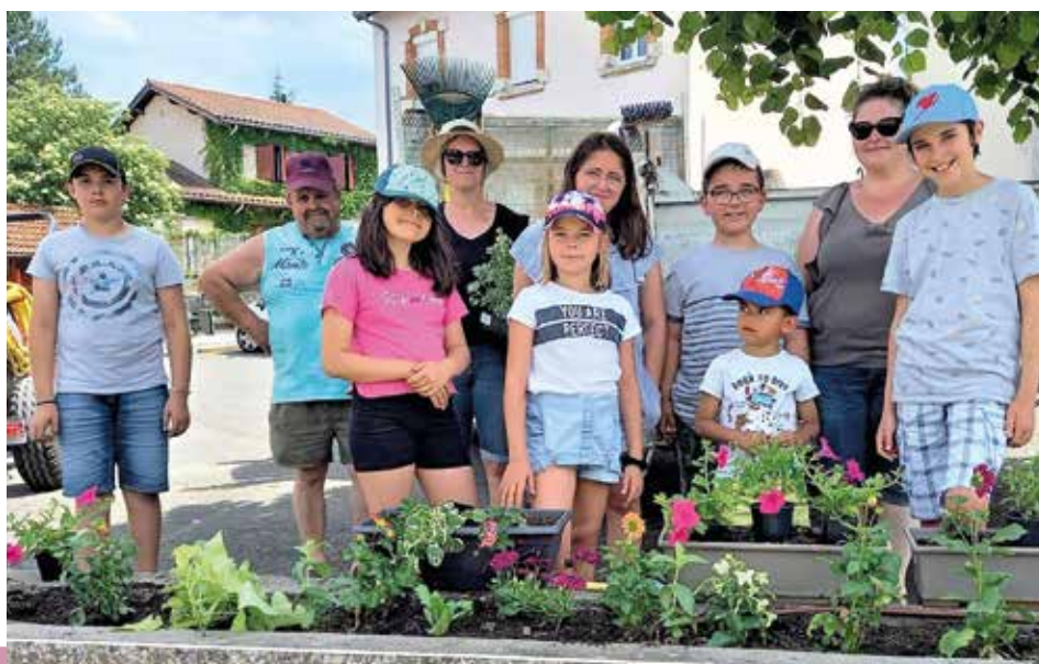
Les planteurs de fleurs

Nous les remercions pour leur implication et leur intérêt pour la commune.