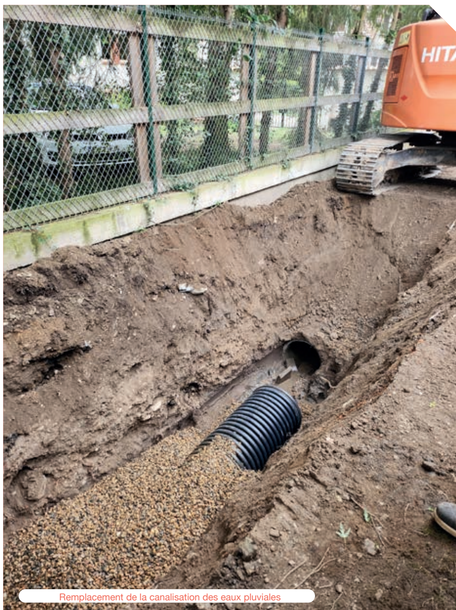
Remplacement de la canalisation des eaux pluviales

Il ne fait de secret pour personne que nos ponts sont anciens et celui du Lignon a aussi besoin de rénovation, l'installation des gabarits permettra de le protéger des engins trop lourds. Mais depuis plusieurs mois nous sollicitons également les services de l'état afin d'être accompagné au mieux pour la réparation de ce dernier. Le budget sera conséquent, les démarches seront longues. Il s'agit là, d'un projet qui va être porté sur plusieurs années entre le début des études, printemps 2024, et la fin des travaux. Nous vous tiendrons informés régulièrement des avancées de nos démarches.