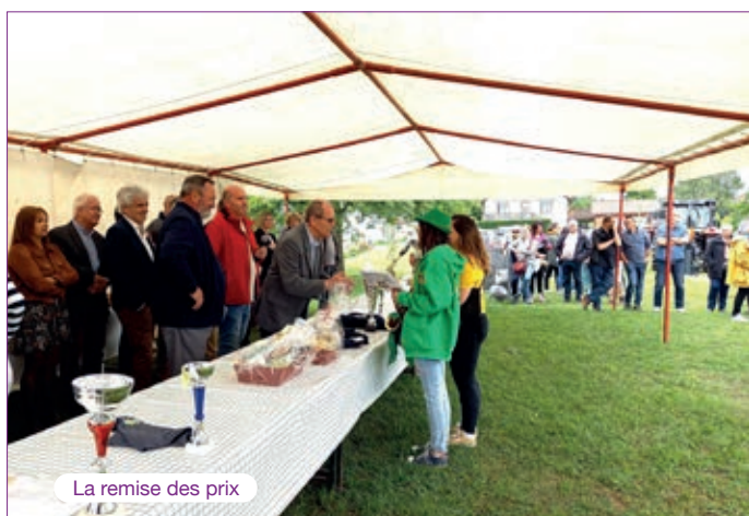
La remise des prix

Nous proposons à la location chapiteaux, tables aux particuliers (montage et démontage assurés par les membres du comité).