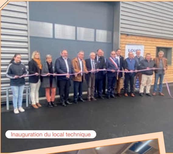
Inauguration du local technique