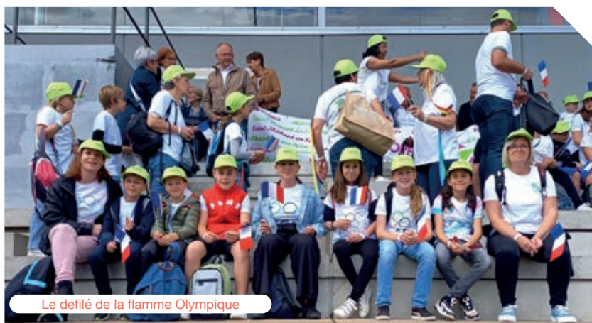
Le défilé de la flamme Olympique