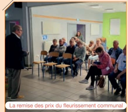
La remise des prix du fleurissement communal