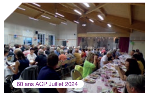
60 ans ACP Juillet 2024