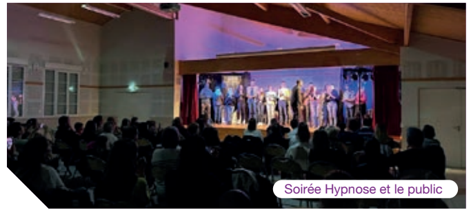
Soirée Hypnose et le public

Merci au sou des écoles pour leur implication à nos côtés dans diverses manifestations ce qui en a permis leurs réalisations.