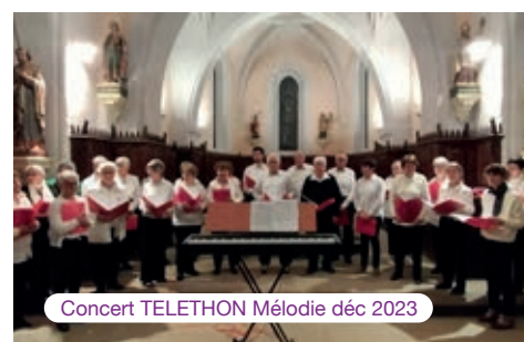
Concert TELETHON Mélodie déc 2023