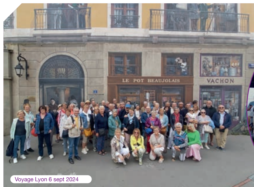
Voyage Lyon 6 sept 2024

Si vous souhaitez nous rejoindre, n'hésitez pas à contacter les responsables d'activités ou la Présidente au 06-08-83-53-68, vous y serez les bienvenus.