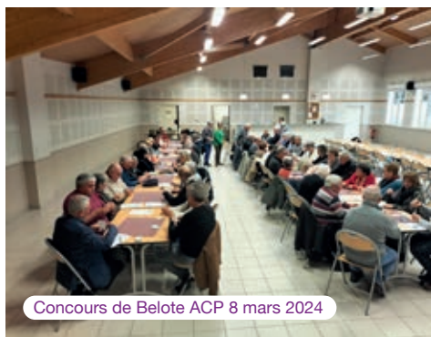
Concours de Belote ACP 8 mars 2024