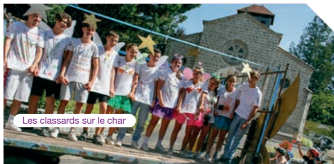
Les classards sur le char