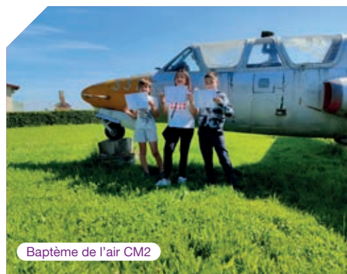
Baptême de l'air CM2