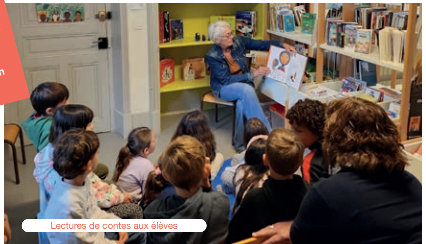
Lectures de contes aux élèves

Horaires d'ouverture : Mardi et jeudi : 16h30 à 18h30 Samedi : 10h à 12h