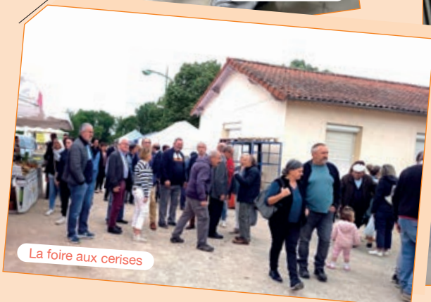
La foire aux cerises