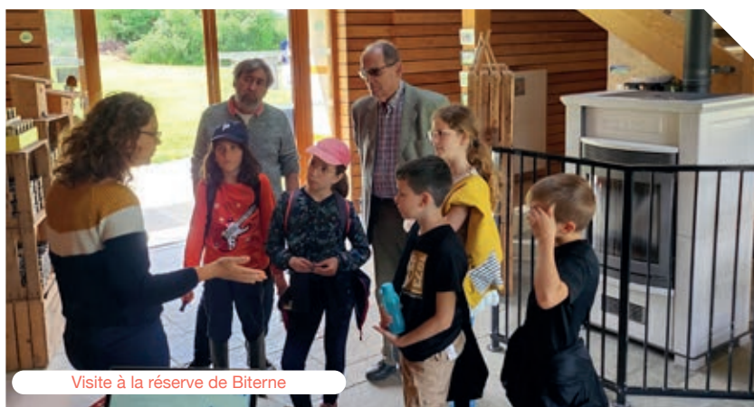
Visite à la réserve de Biterne

Ils ont eu l'idée d'implanter un hôtel à insectes aux abords du Lignon. Ils ont récupéré du bois, des branches, des tuiles, de la mousse, des écorces, du bambou. Ensuite, ils ont rempli les cases de l'Hôtel à insectes. Ce projet a vu le jour grâce au forum de la biodiversité à l'Ecopôle de Chambéon auquel les jeunes avaient participé.