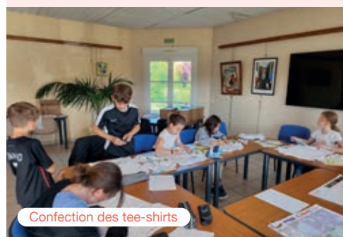
Confection des tee-shirts

Pour la 2ème édition de la soirée Halloween organisée par le comité des Fêtes et le sou des écoles, les élus du CMJ ont proposé un concours de photophores sur le thème d'Halloween. Ils ont noté les 16 photophores avant d'établir un classement. Tous les participants ont été récompensés.