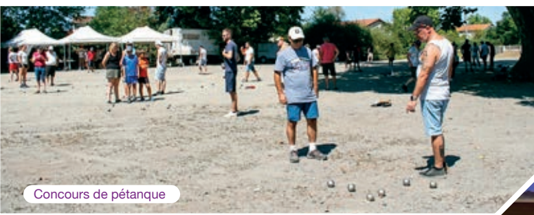
Concours de pétanque

Nous profitons d'ailleurs de ces quelques lignes afin de vous proposer de nous rejoindre, vous êtes dynamique, vous avez à cœur de faire vivre votre village ? Alors n'hésitez plus et rejoignez-nous ! Et bien évidemment un très grand merci à vous tous pour nous avoir soutenus dans tous ces projets, 2024 fut une belle année, nous espérons que 2025 sera encore meilleure grâce à vous.