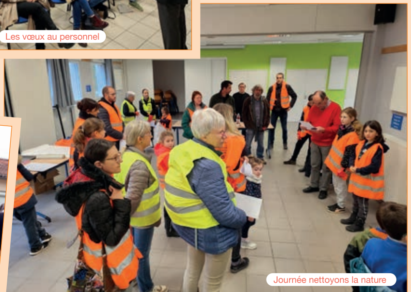
Journée nettoignons la nature