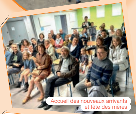
Accueil des nouveaux arrivants et fête des mères