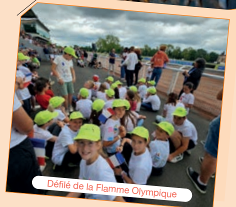
Défilé de la Flamme Olympique