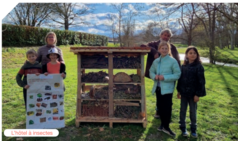
L'hôtel à insectes

Ils ont eu l'idée d'implanter un hôtel à insectes aux abords du Lignon. Ils ont récupéré du bois, des branches, des tuiles, de la mousse, des écorces, du bambou. Ensuite, ils ont rempli les cases de l'Hôtel à insectes. Ce projet a vu le jour grâce au forum de la biodiversité à l'Ecopôle de Chambéon auquel les jeunes avaient participé.