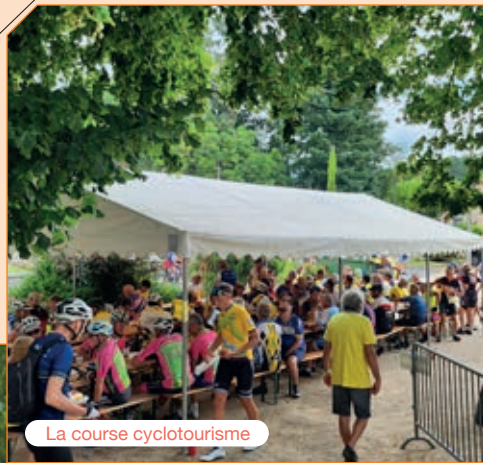
La course cyclotourisme