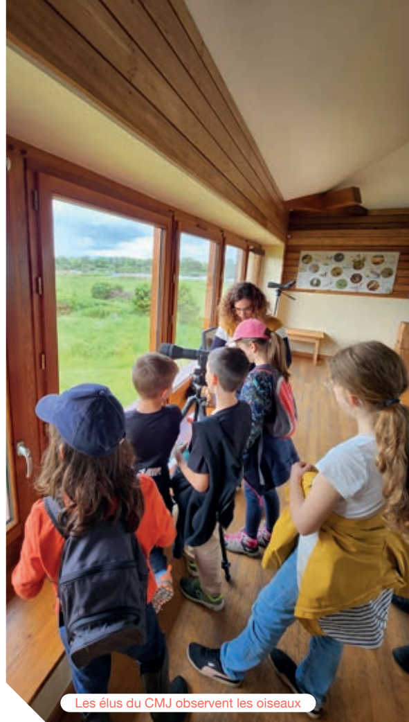
Les élus du CMJ observent les oiseaux