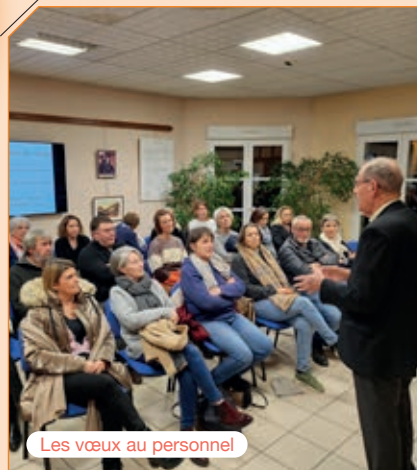
Les vœux au personnel