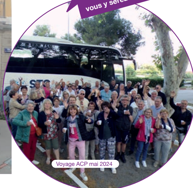
Voyage ACP mai 2024