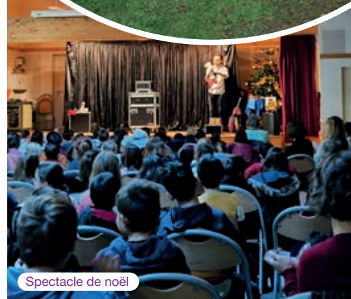
Spectacle de Noël

Pour suivre nos manifestations, n'hésitez pas à vous abonner à notre page Facebook :