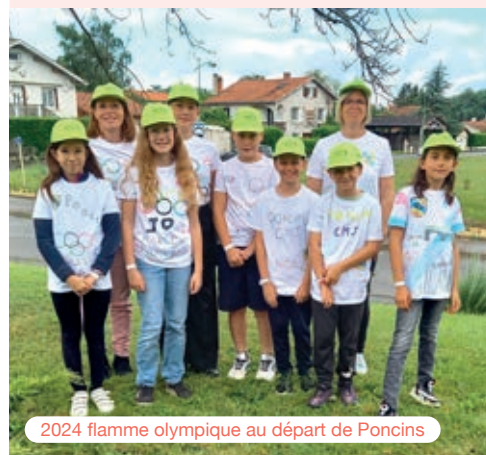
2024 flamme olympique au départ de Poncins