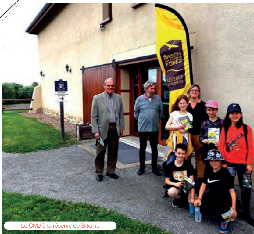
Le CMJ à la réserve de Biterne

En avril prochain, il y aura de nouvelles élections des élus du Conseil Municipal Jeunes. Les élèves du CE2 au CM2 de l'école de Poncins pourront être candidats. Ils seront élus par les élèves du CE1 au CM2 pour un mandat de 2 ans.