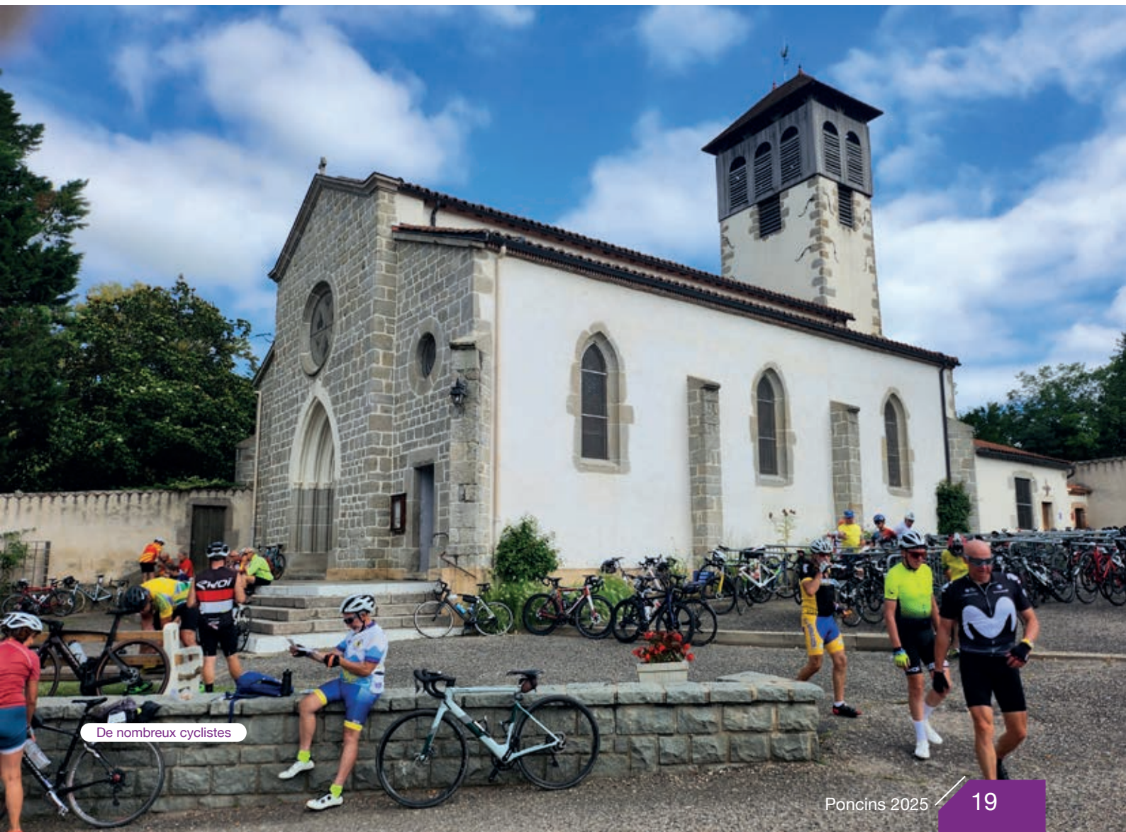
De nombreux cyclistes