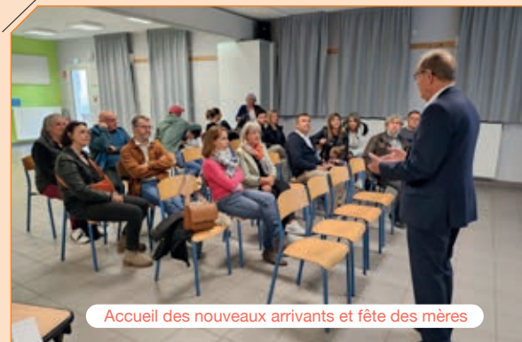
Accueil des nouveaux arrivants et fête des mères