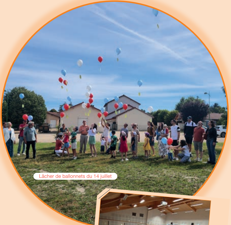
Lâcher de ballonnets du 14 juillet