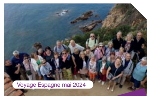
Voyage Espagne mai 2024

Si vous souhaitez nous rejoindre, n'hésitez pas à contacter les responsables d'activités ou la Présidente au 06-08-83-53-68, vous y serez les bienvenus.