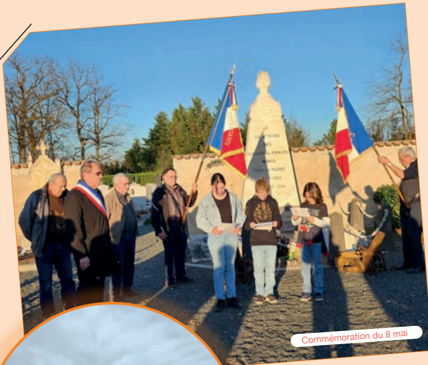
Commémoration du 8 mai