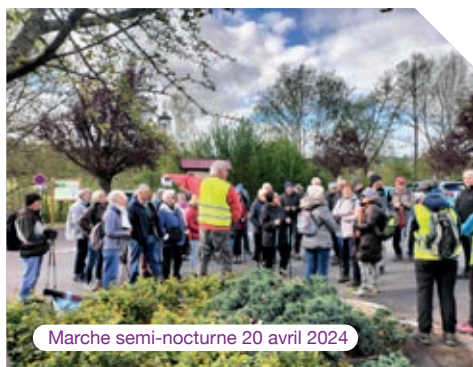
Marche semi-nocturne 20 avril 2024

Nous remercions les présidents ainsi que leurs membres pour leur dynamisme et leur dévouement pour l'animation du village.