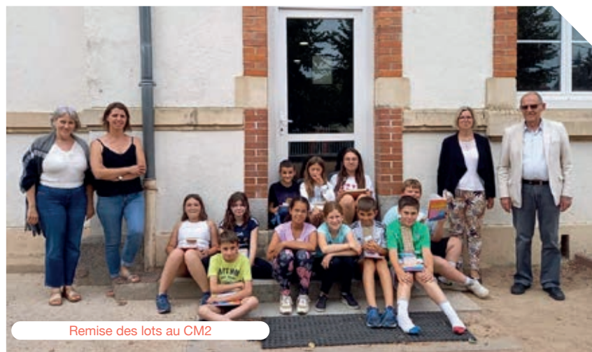
Remise des lots au CM2