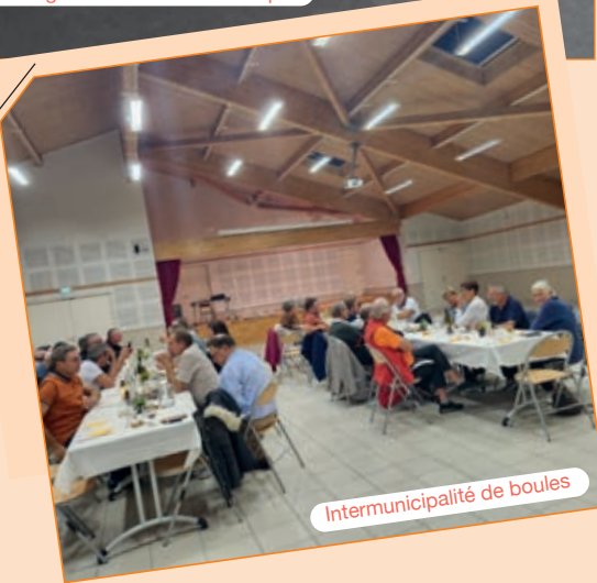
Intermunicipalité de boules