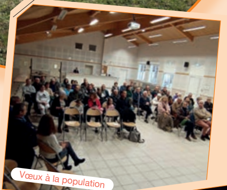
Vœux à la population