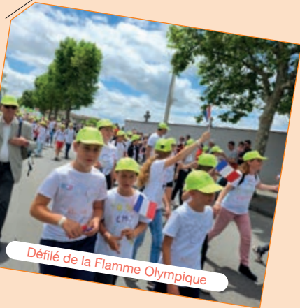
Défilé de la Flamme Olympique