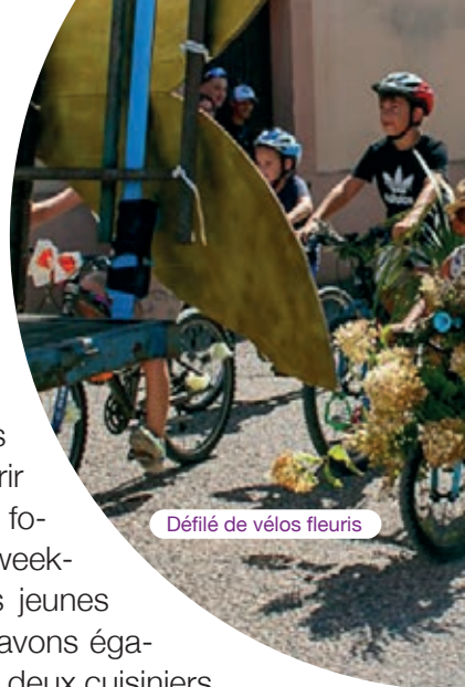
Défilé de vélos fleuris