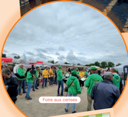
Foire aux cerises