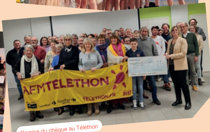
Remise du chèque au Téléthon