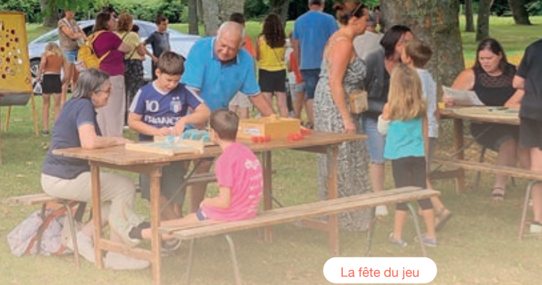
La fête du jeu