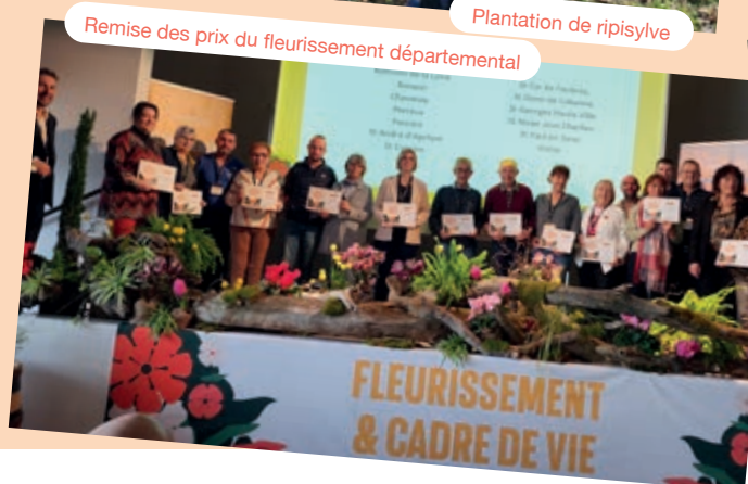
Remise des prix du fleurissement départemental