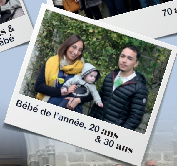
Bébé de l'année, 20 ans & 30 ans