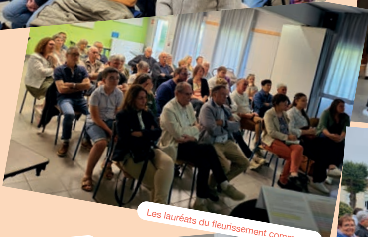
Porte ouverte de la 6 ème classe