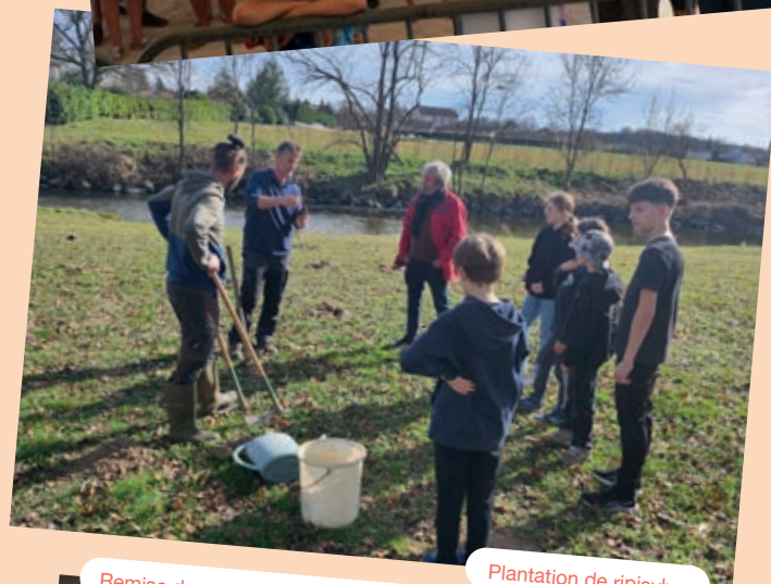
Plantation de ripisylve