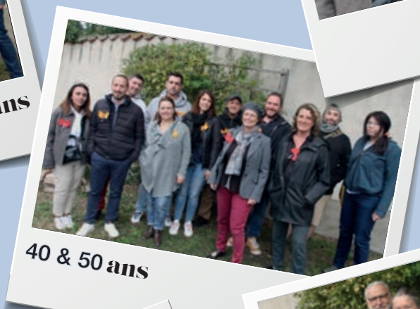
40 & 50 ans