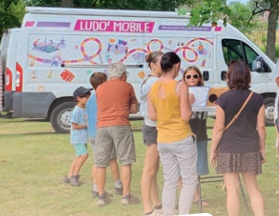
Le vin d'honneur de la fête