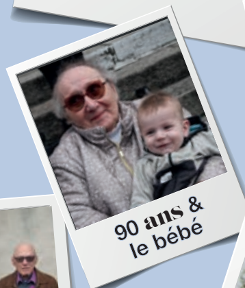
90 ans & le bébé